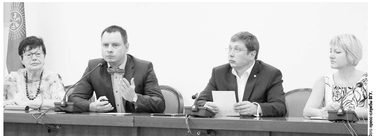
Торжественное открытие семинара.