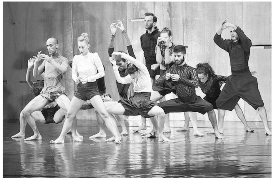
Сцена из постановки театра современного танца «Вертиго».

Она уходит за высокой забор. И ничто, и никто её не остановит.