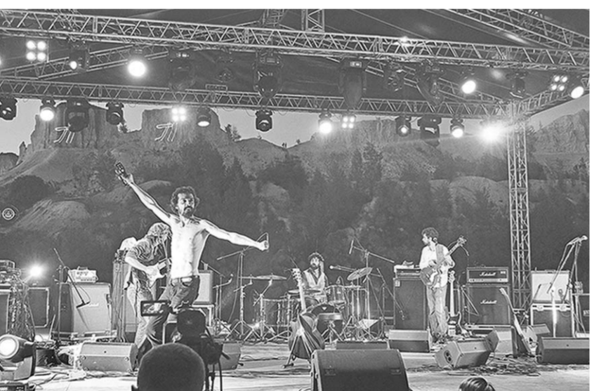
Выступает The Bambir.

Неподалёку от областного центра выступили группы из пяти стран. Воронежцы и гости фестиваля продолжили знакомство с творческим поиском музыкантов