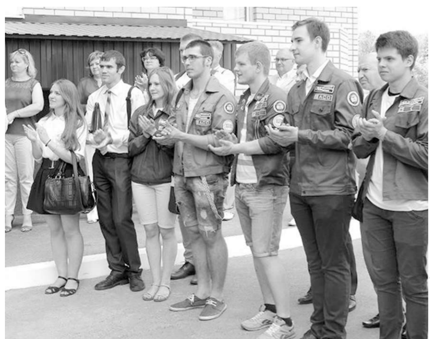
Особенно рады новому общежитию его будущие новосёлы.

Осмотрев новый материально-технический объект ВГУ, гости перешли в новый корпус экономического факультета, где осмотрели выставку детской робототехники от Экспериментальной технической школы и встретились со студентами воронежских вузов, сообщает пресс-служба ВГУ.