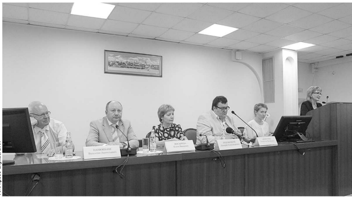
На открытии международной научной конференции в ВГУ.

– Её целью было показать, что такое юридическое равенство. Это необходимо понимать студентам – будущим судьям, прокурорам. В этом важно разобраться учёным. В свою очередь, Воронежскому государственному университету необходимо было продемонстрировать свой научный потенциал, дать ответы на многие теоретические и практические вопросы. Большую активность на конференции проявили студенты и молодые преподаватели юридического факультета. Безусловно, это говорит о высоком рейтинге ВГУ и усиливает интерес к нему со стороны тех, кто думает о будущей профессии.