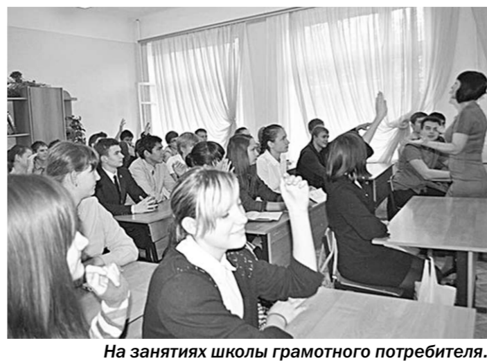
На занятиях школы грамотного потребителя.

А это значит, что есть надежда на то, что добрые и благородные герои и их поступки оставят след в детских душах, ведь рассказы о доблести, подвигах, славе, волнуя воображение ребят, всегда находят нужный отклик в сердцах, что, несомненно, посевит первые семена любви к родной земле.