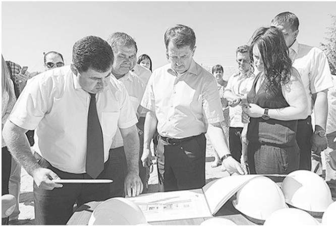
Алексей Гордеев знакомится с планом новой поликлиники в селе Митрофановка.

Затем в центре рабочего поселка Кантемировка Алексей Гордеев возложил цветы к стеле «Населённый пункт воинской доблести», которую установили ко Дню Победы. Напомним, что сражения на территории Кантемировского района в годы Великой Отечественной войны стали частью наступательной операции советских войск под названием «Малый Сатурн». В ходе боев за Кантемировку была разгромлена значительная группировка немецко-фашистских войск. В самом райцентре было захвачено несколько эшелонов противника с вражескими танками.