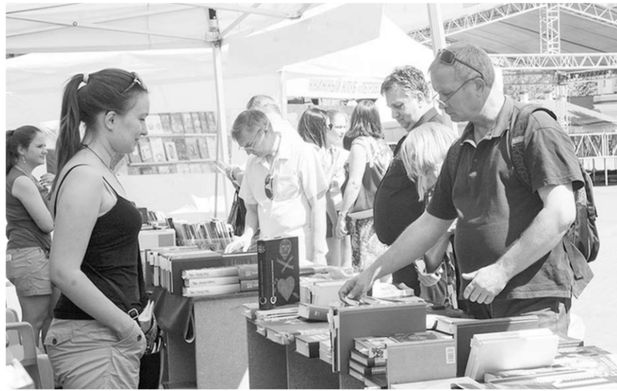
На Советской площади продавалась только качественная литература.

В последний день работы ярмарки представители издательства провели «круглый стол» «Издатель и поэт: варианты возможного», посвящённый проблемам российского книгоиздания.