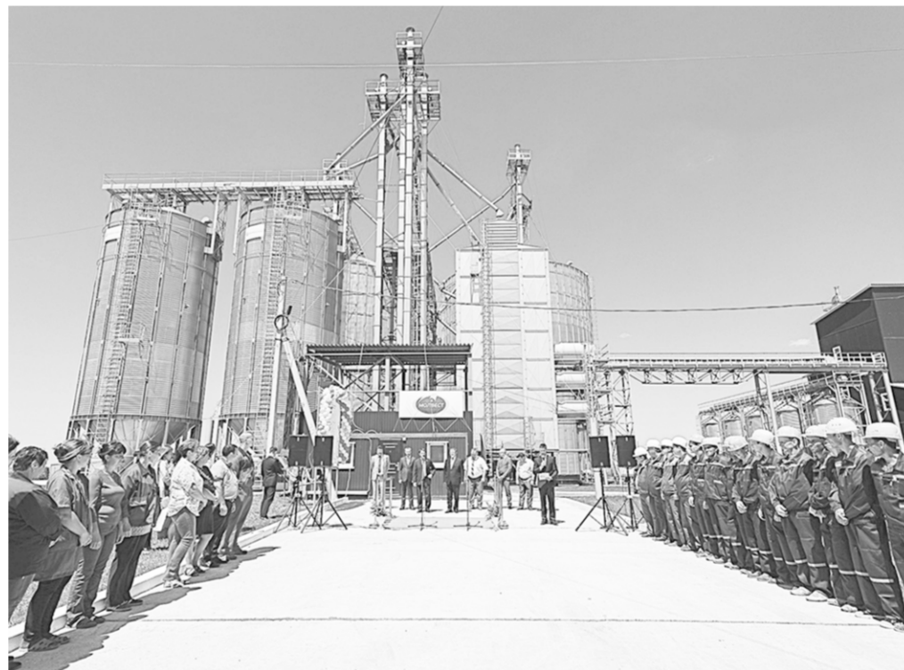
Открытие элеватора и комбикормового завода в селе Новомарковка.