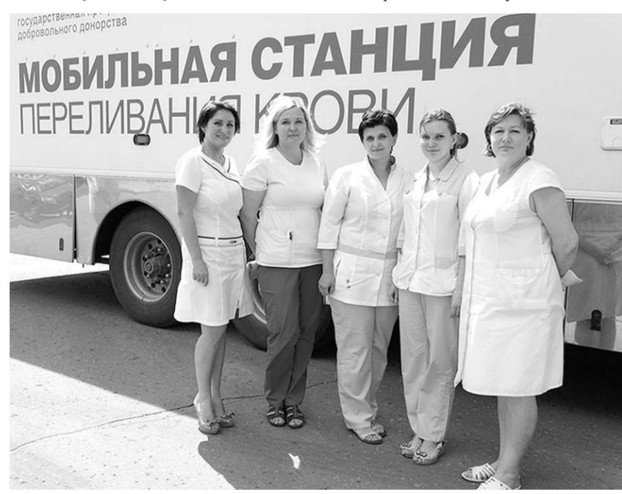
Донорство – важная социальная миссия медиков.

От руководства и коллектива городской клинической больницы скорой медицинской помощи №8 поздравляем коллег с профессиональным праздником – Днём медицинского работника! Пусть ваш высокий профессионализм, чуткое сердце и золотые руки всегда будут вознаграждены признательностью и любовью пациентов. Желаем вам тех жизненных благ, которые вы ежедневно дарите людям – доброго здоровья, энергии, оптимизма и веры в себя!