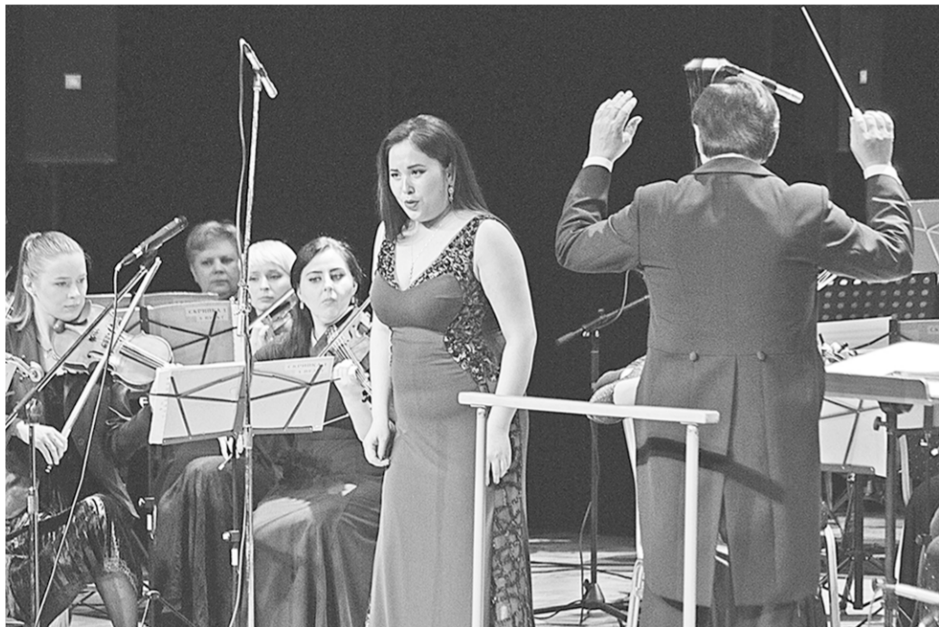
В последние часы фестиваля звучали арии из опер.

Грандиозным концертом звёзд оперной сцены стран СНГ завершился Пятый Платоновский фестиваль искусств