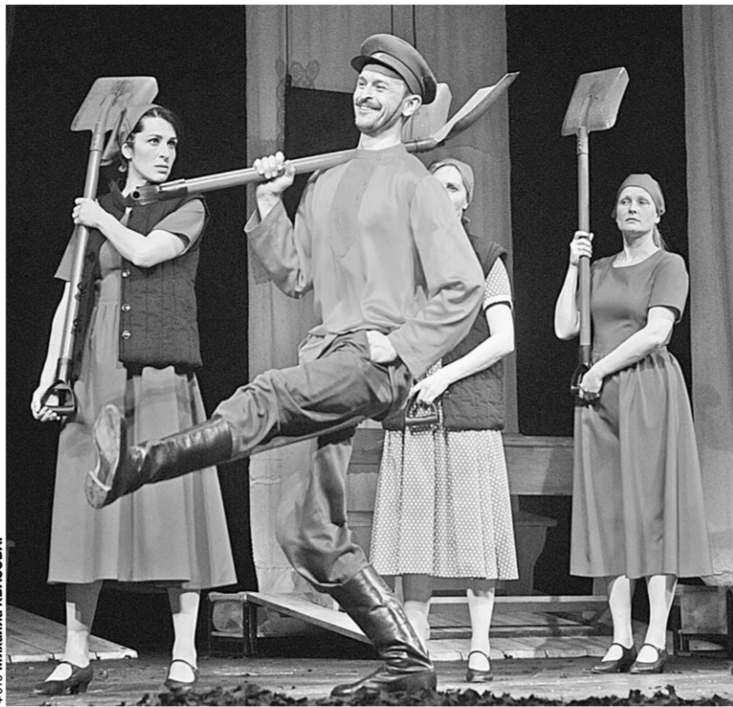
Сцена из спектакля «Фро». Рижский театр им. М.Чехова.

«Третий сын» разыгран в психинском стиле: дед с баладашкой, стол с мисками, где отец хлопает по лбам всех сыновей, бабка, чья смерть - только залог продолжения жизни. Ребята прекрасно перевоплощаются, не прибегая к гриму, бородам и усам. В этом отрывке прекрасно работает исполнитель роли деду. Но всё-таки юмора больше, чем трагизма. Это ещё можно понять: слишком моло-