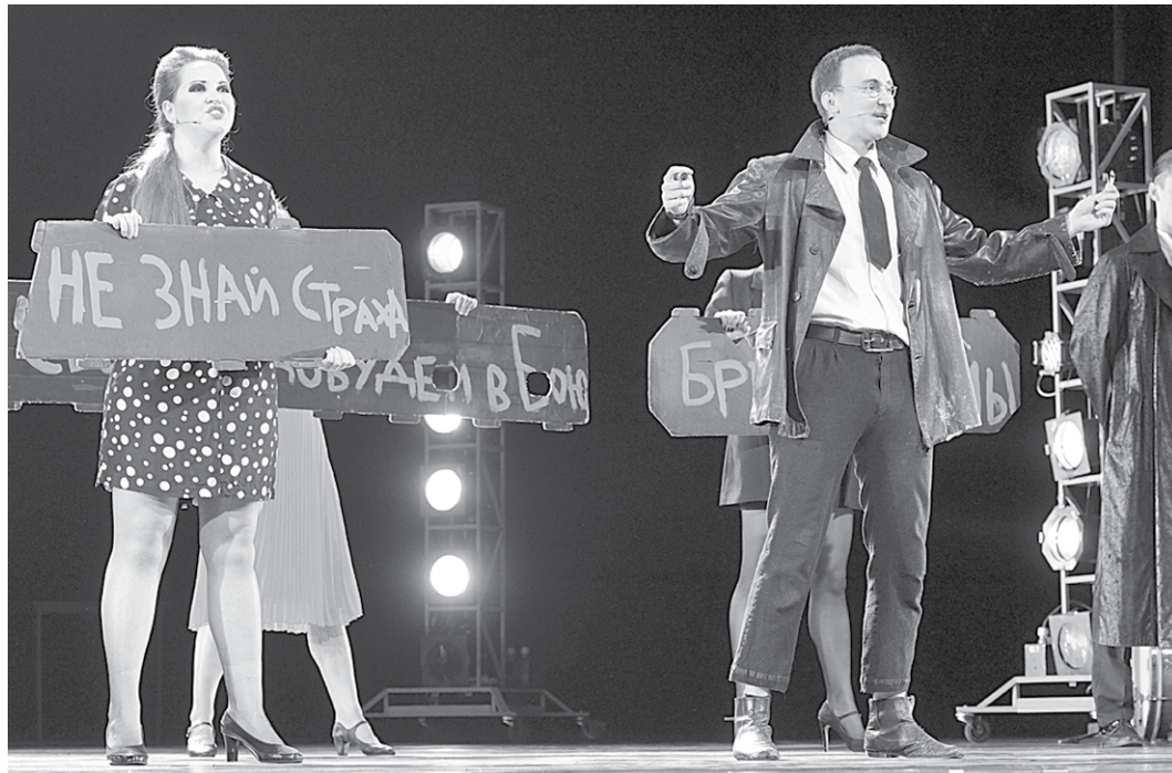
Сцена из спектакля «Кабаре Брехт».

Спектакль поражает, ещё не начавшись. Вместо вежливого напоминания отключить мобильные телефоны, зрителям предлагают бежать по залу, громко болтать со знакомыми и даже курить (хотела бы я посмотреть на тех, кто осмелился бы это сделать!). Вот так, от противного, опровергая все представления о развитии