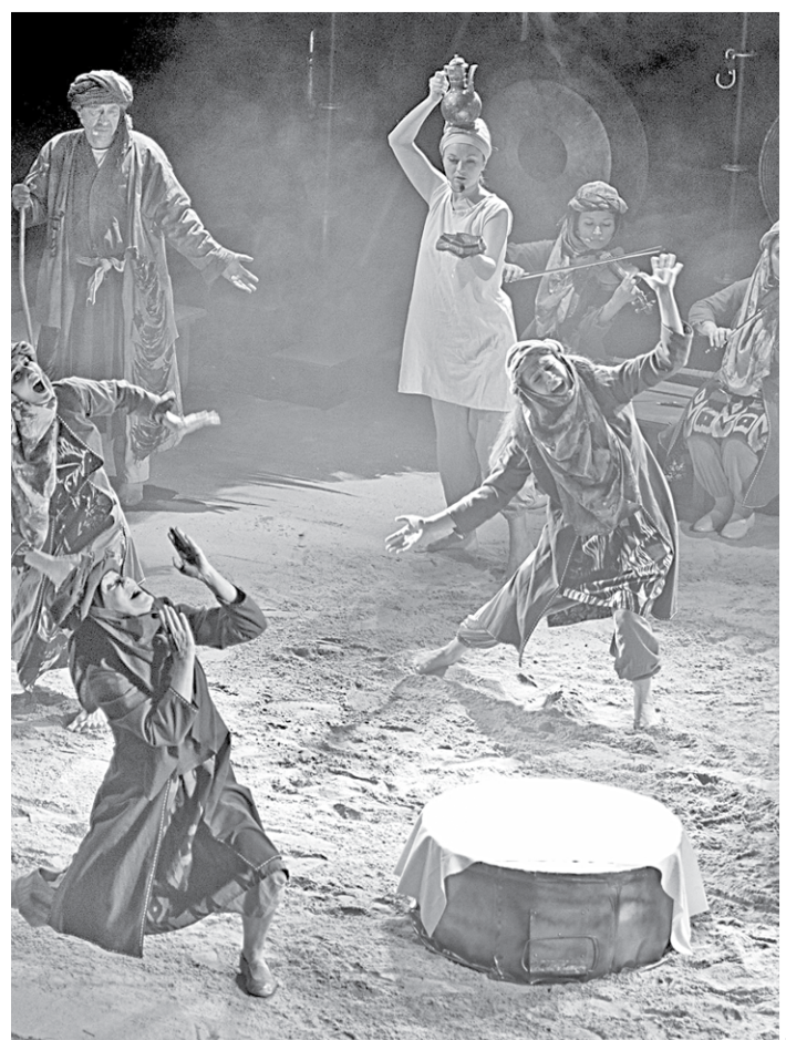
Сцена из спектакля «Семь лун».

И человеческий придёт к нему только вместе с безумием. А потом всё повторится.