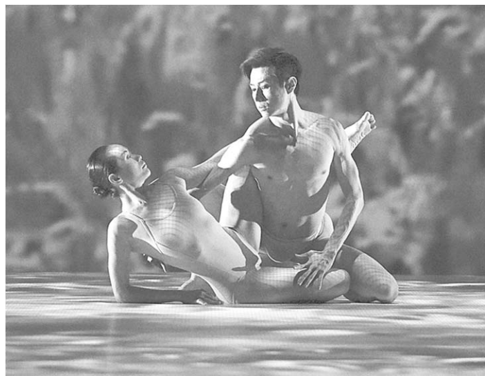
Сцена из балета «Рис».

Также через много лет поступил и художественный