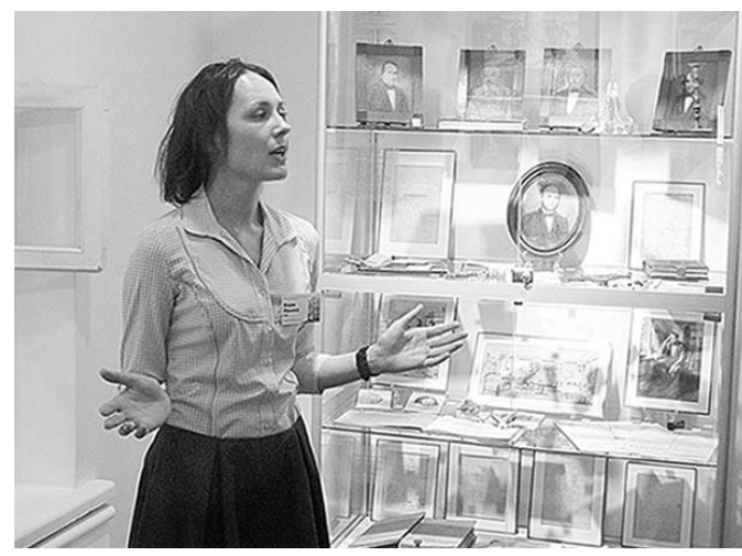
Экскурсия по дому, в котором жил поэт.

В Воронеже после завершения ремонтно-реставрационных работ открылся дом-музей поэта Ивана Саввича Никитина.