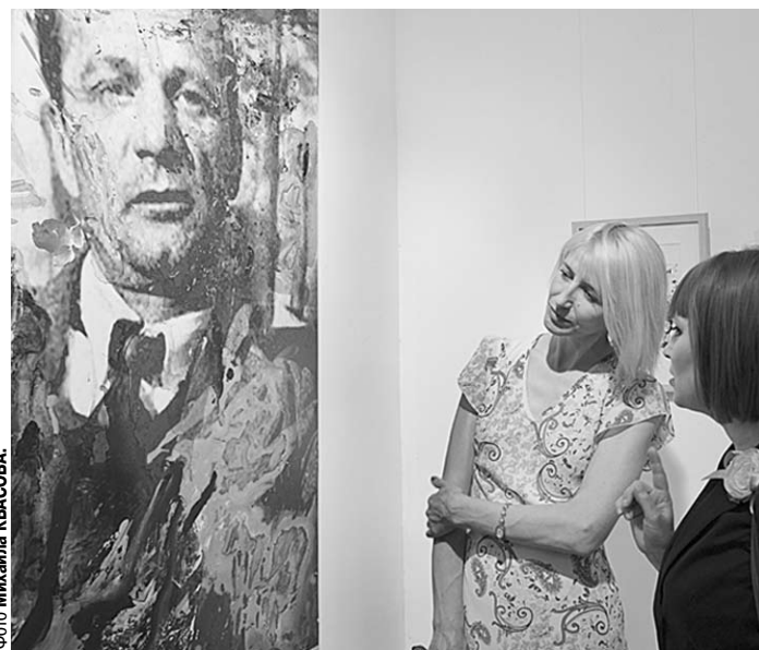
Посетители выставки подолгу стояли у портрета Андрея Платонова.

Алексей Горбунов признался, что перед открытием выставки ему довелось поблизиться со своим кумиром писателем Андреем Битовым, и оказалось, что и ему интересно