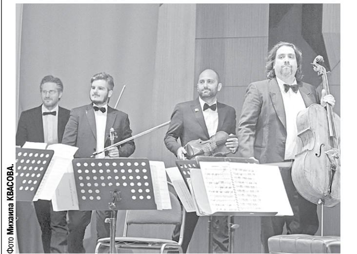
Квартет из Италии.