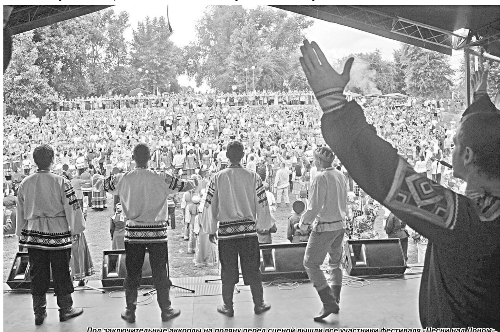
Под заключительные аккорды на поляну перед сценой вышли все участники фестиваля «Песни над Доном».

Событие | Два дня жители и гости Верхнемамонского района пели и танцевали вместе с народными артистами – участниками Пятого межрегионального фестиваля «Песни над Доном»