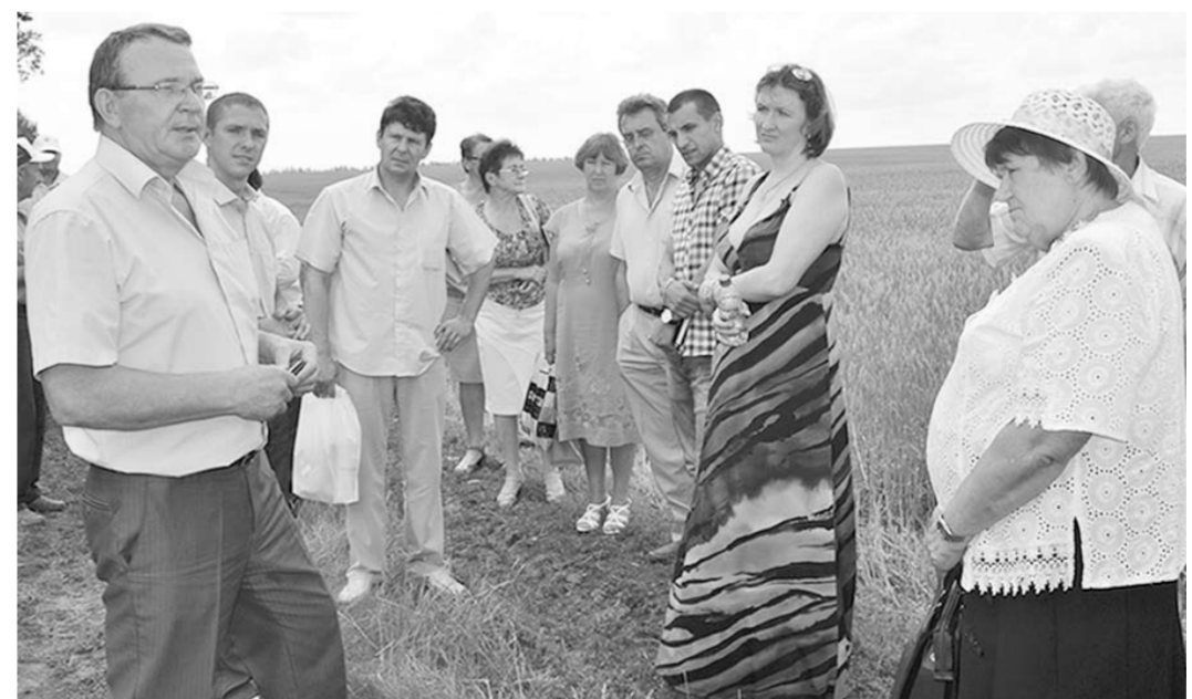
Участники семинара на опытно-экспериментальном участке хозяйства.

«В пору перестройки и последующих губительных экономических реформ большинство сельхозпредприятий находилось примерно в одинаковых условиях. Многие рухнули, раз-