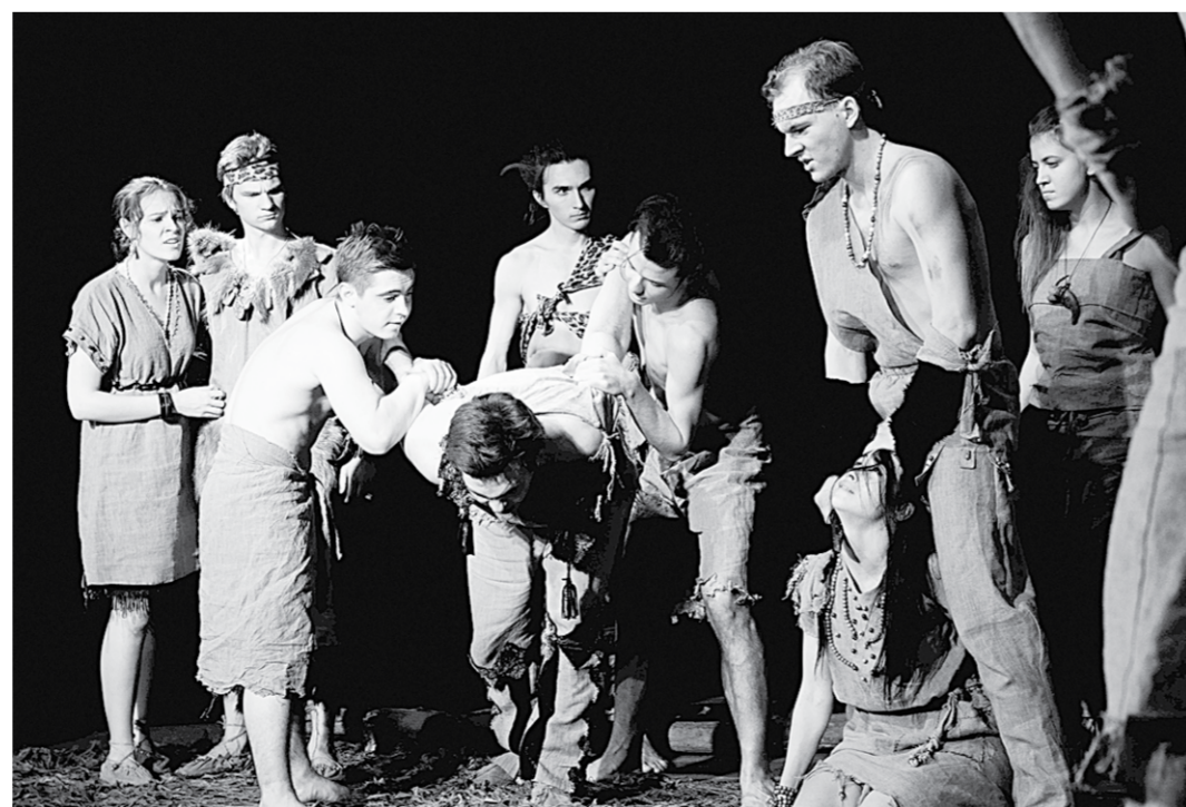
Сцена из спектакля «Дикие».

В «тронной» речи председателя госкомиссии прозвучало много конструктивных предложений: о пластическом воспитании (а это сейчас альфа и омега современного театра), об умении выстраивать образ, о речевых погрешностях, о конкурентоспособности (рынок Москвы перенасыщен актерами). Но обо всем этом Константин Райкин говорил с болью, с позиции профессионального педагога, как равный с равными. Кафедра мастерства актера есть над чем подумать. Кстати, худрук «Сатирикона» предложил обмен студенческими спектаклями своей студии с нашей академией. Вот было бы здорово!