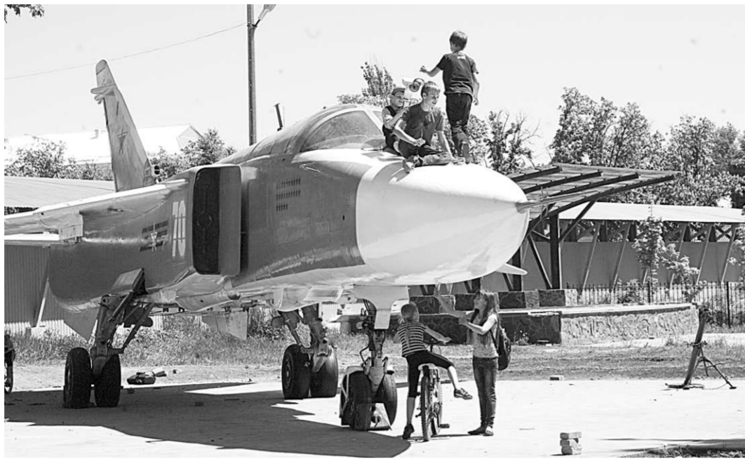
Городской парк после появления в нём боевой техники стал особенно привлекательным для мальчишек.

Из воинских частей сюда пошлут танк Т-80 и бронированная разведывательно-дозорная машина БРДМ-2. Местные мальчишки ждут - не дождутся этого часа. А пока и ту боевую технику, что появилась здесь в мае 2015 года, с большим интересом рассматривают не только детвора, но и взрослое население района.