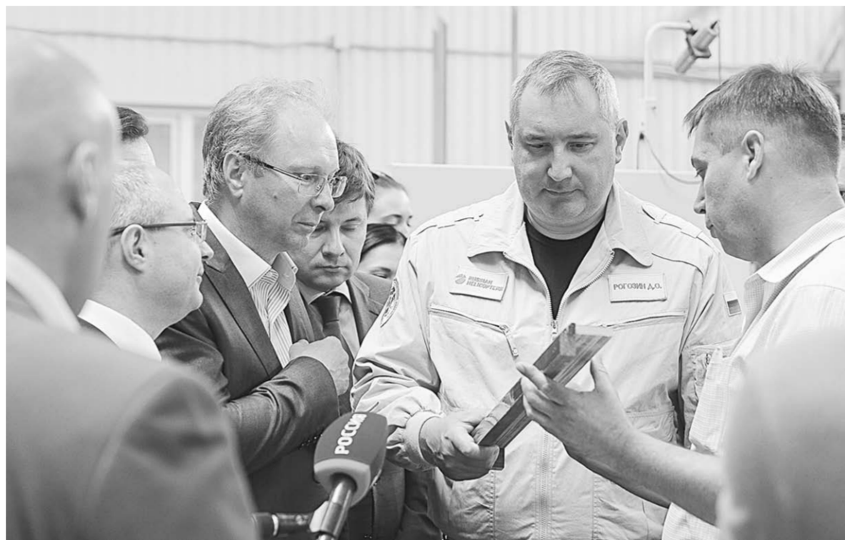
Дмитрий Rogozin в цехах «Русавиаинтер».