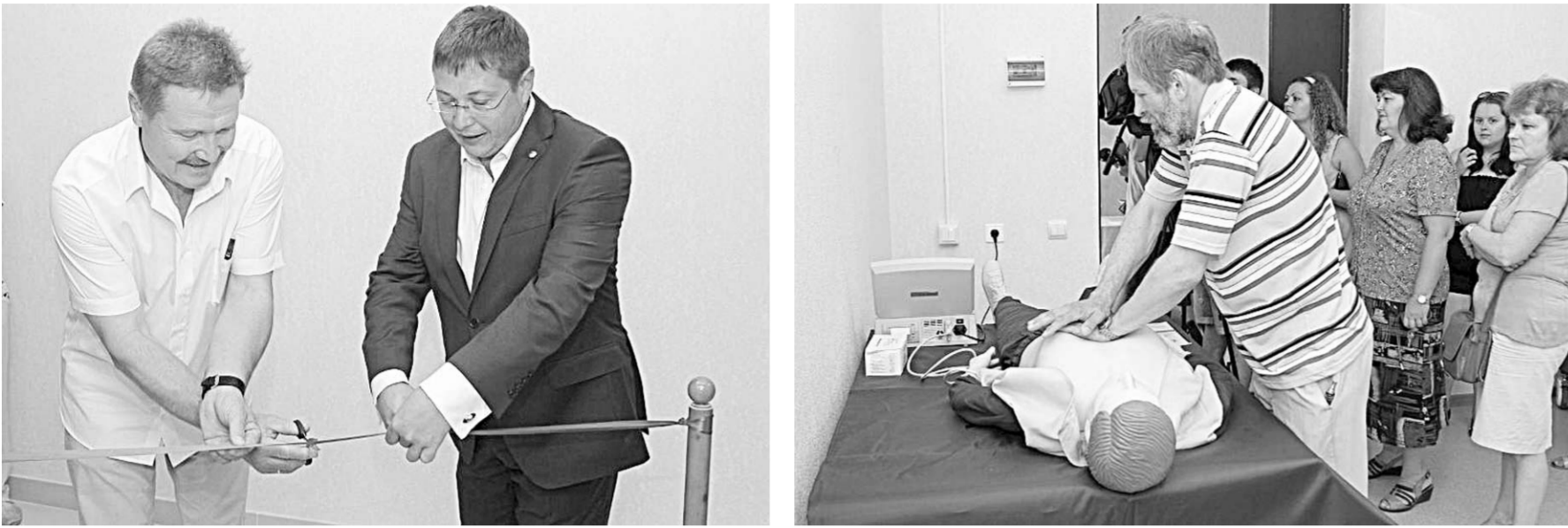
Торжественное открытие анатомического музея.

Высшее образование | В Воронежском государственном университете сделан ещё один шаг на пути к подготовке специалистов в области медицины