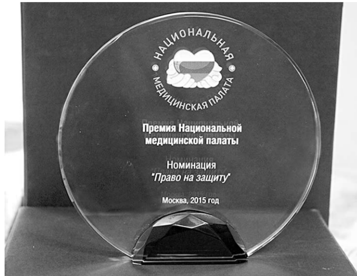
Первым лауреатом учреждённой премии стали воронежцы.

Несколько лет назад в одном из районов области прошёл довольно редкий судебный процесс. Ветеран войны подал иск к районной больнице. Старый человек обвинял врачей не только в том, что они просмотрели его онкологическое заболевание, но и в том, что, взявшись лечить, назначили ему такие лекарства, которые принесли вред и лишь усугубили развитие тяжёлой болезни.