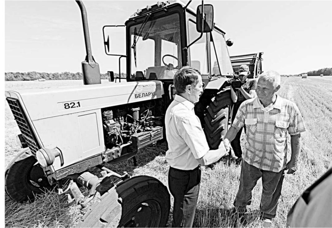
Бывая в Грибановском районе, губернатор Алексей Гордеев обязательно встречается со знатным хлеборобом, Героем Труда России Юрием Конновым.

Проблемы, связанные с деятельностью Грибановского сахарного завода, уже вышли на федеральный уровень, - заметил глава региона. - Но больше всего нас волнует то, что местные жители постоянно жалуются на экологические проблемы и недопонимание между заводом и местной властью. Отсюда возникает целый ряд ненужных противостоятелей, которые не приводят к конструктивной работе и