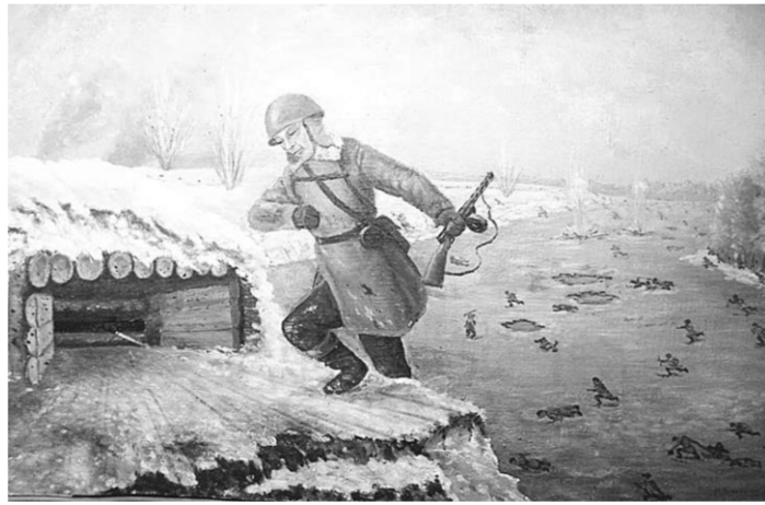
«Подвиг Василия Прокатова».

Цена освобождения села была великой. Всего на территории Дерезовского сельского поселения находятся 16 братских захоронений, в которых покоятся останки 584 красноармейцев, погибших в первые дни наступления. На правом берегу Дона, в полтора километра к западу от села, у высоты 190,7 в двух могилах похоронены 145 и 47 стрелков-автоматчиков 350-й стрелковой дивизии. На сельском кладбище в общей могиле захоронены 109 солдат той же дивизии. На правом берегу Дона близ села покоятся 34 красноармейца 267-й стрелковой дивизии. Помимо этого, братские могилы находятся на хуторах Донской и Оробинский. Ежегодно поисковые отряды находят все новые солдатские могилы. В центре села Дерезовка устроен некрополь с вечным огнем Славы. Здесь нашли свое упокоение солдаты Великой Отечественной войны из всех уголков России, погибшие в жестоких боях за освобождение нашей земли от фашистских захватчиков.