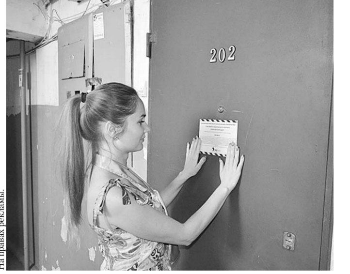
Таким образом энергетики напоминают должникам о необходимости погасить задолженность за свет.