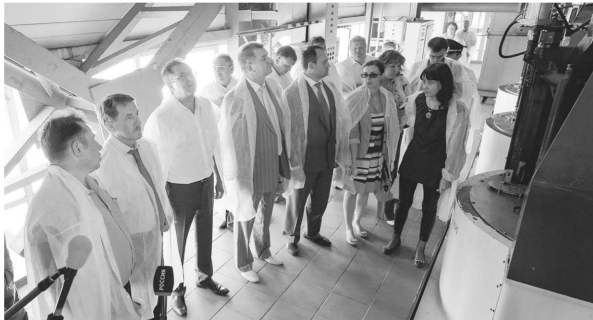
Алексей Гордеев знакомится с производственным процессом Грибановского сахарзавода.

ООО «Воронежсахар», которое, кстати, является старейшим предприятием Грибановского района входит в Группу компаний «Ассоциация современного бизнеса» (ГК «АСБ»). Основной вид продукции – сахар-песок, патока и гранулированный жом. Предприятие рассчитано на переработку 3,5 тысячи тонн свёклы ежегодно, что даёт примерно 450-550 тонн готового сахара. Генеральный директор и учредитель ГК «АСБ» Юрий Хохлов рассказал губернатору Алексею Гордееву, что с 2008 года на предприятии ведётся реконструкция, направленная на увеличение мощностей. Смонтировано новое свёлоприёмное отделение, установлены пластинчатые подогреватели и кристаллизатор. Проведён капитальный ремонт диффузионного аппарата, имеется мощный генератор, обеспечиваю-