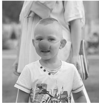
«Я бы в клоуны пошёл».

... Как-то легко и просто у него всё получается: объяснил