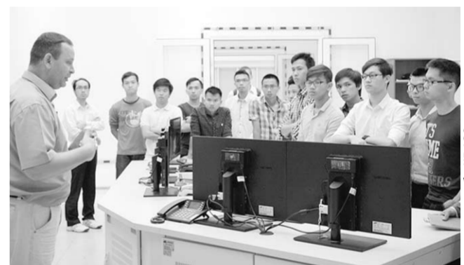
На занятиях с вьетнамскими студентами.

На днях на Нововоронежской АЭС завершили технологическую практику вьетнамские студенты, обучающиеся в Обнинском институте атомной энергетики.