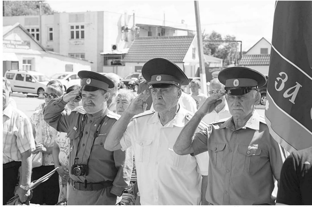
Казак Семилукского хуторского казачьего общества «Хутор Николаевский».

После митинга в Доме культуры прошла презентация