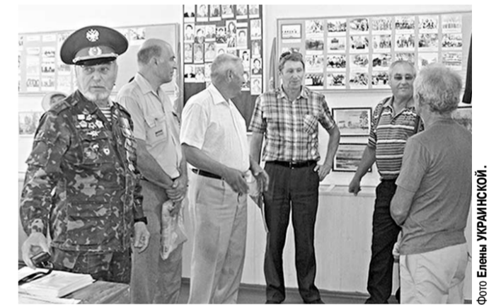
Воины-ветераны в школьном музее.

В Терешковской школе продолжается Вахта памяти. В эти дни здесь вспоминают выпускника, чьё имя носит детская общественная организация, воина-интернационалиста, командира вертолётной авиаполка пограничника Михаила Капустина.