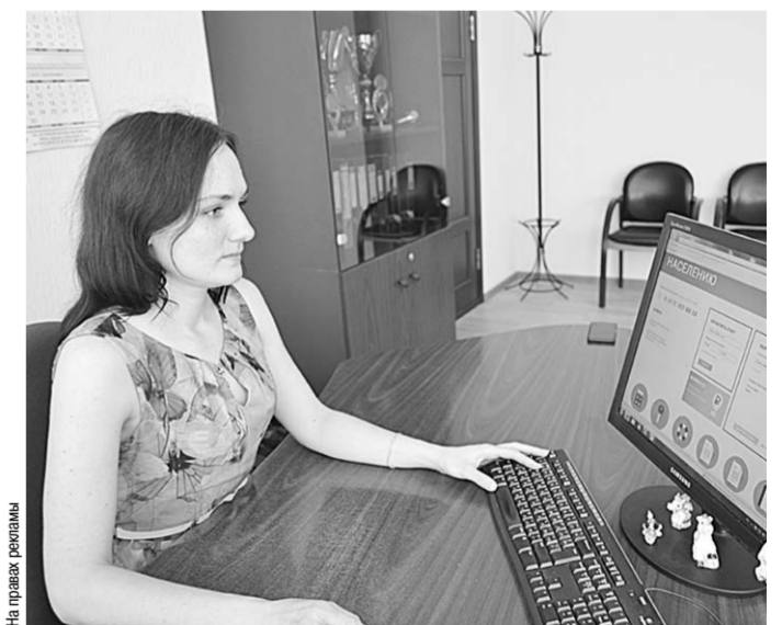
На портале компании

Теперь на главной странице можно самостоятельно произвести расчеты за поставленную электроэнергию без прохождения регистрации, задать вопрос специалисту