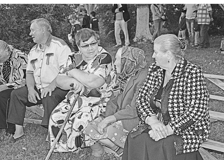
Для сельских жителей фестиваль – это ещё и возможность оторваться от тяжёлых сельских трудов и узнать местные новости.