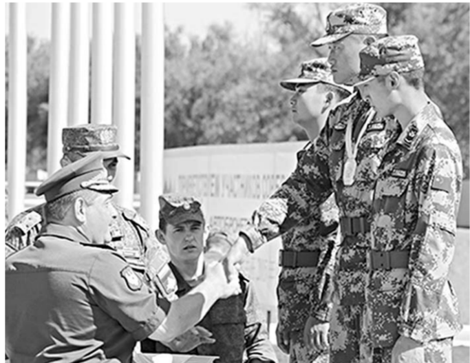
Награждение китайских военнослужащих.

Лучшими экипажами бомбардировщиков конкурса «Авиадартс» на Армейских международных играх-2015