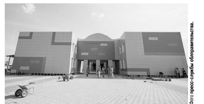
Так выглядит новостройка.

Ход строительства общеобразовательной школы в микрорайоне Репное Воронежжа проинспектировал в минувшую пятницу губернатор Алексей Гордеев.