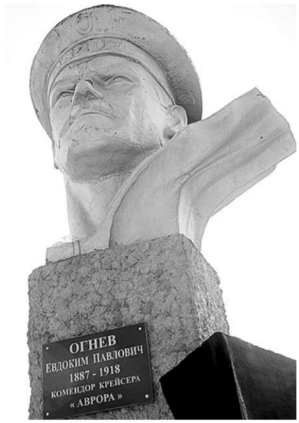
Памятник Евдокиму Огнёву.

На эти деньги осуществили планировку, затем проложили тротуары, установили ограждение по всему периметру, скамейки, урны, провели