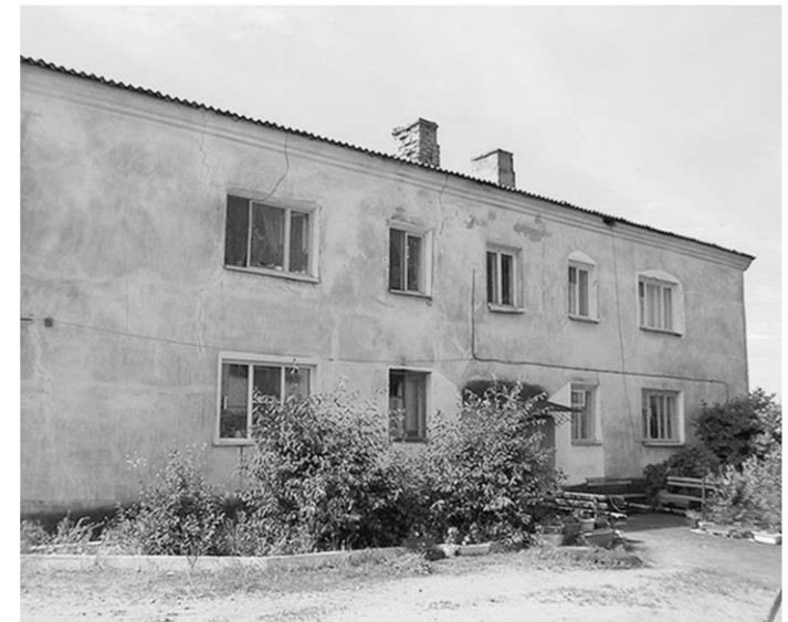
Петропавловка, ул. Ленина, д. 107 — до и после ремонта. В доме проведён ремонт кровли, фасада, систем отопления и электроснабжения.

— Да. В случае, если размер фактических поступлений взносов на капремонт на спецсчет составляет менее 50 процентов от начисленных сумм, то Госжилинспекция уведомляет владельца специального счета о необходимости погашения задолженности. Владелец спецсчета, в свою очередь, обязан провести соответствующую работу с должниками. Если в пятилетний срок задолженность так и не будет погашена, то орган местного самоуправления принимает решение об отнесении этого дома на счет регионального оператора. А владелец специального счета обязан в течение месяца перечислить все накопленные собственниками средства на счет Фонда капитального ремонта многоквартирных домов Воронежской области.