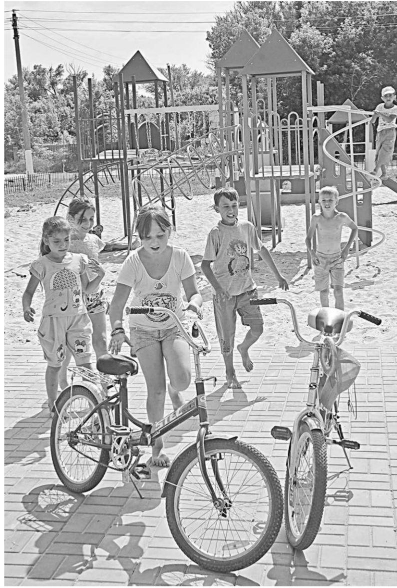
На детской площадке.

По работы по благоустройству села закончились. Этим летом в Старой Криуше принялись за тротуары. А к осени в отдалённой части села появится ещё одна современная детская площадка.