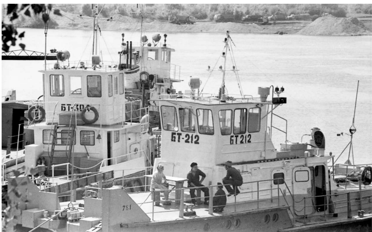
Этому снимку - без малого три десятка лет. Тогда Лискинский речной порт жил полноценными, насыщенными трудовыми буднями.