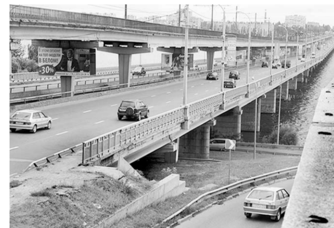
Северный мост ждёт реконструкции.

Воронежские водители на себе прочувствовали, как небезопасно стало проезжать по Северному мосту. Со второго яруса, где когда-то ходил трамвай, на проезжающие внизу машины порой сыплется бетонная крошка, а то отваливаются и целые куски. На днях рабочие приступили к ремонту покрытия верхнего уровня. Демонтировать трамвайные пути пока не планируется.