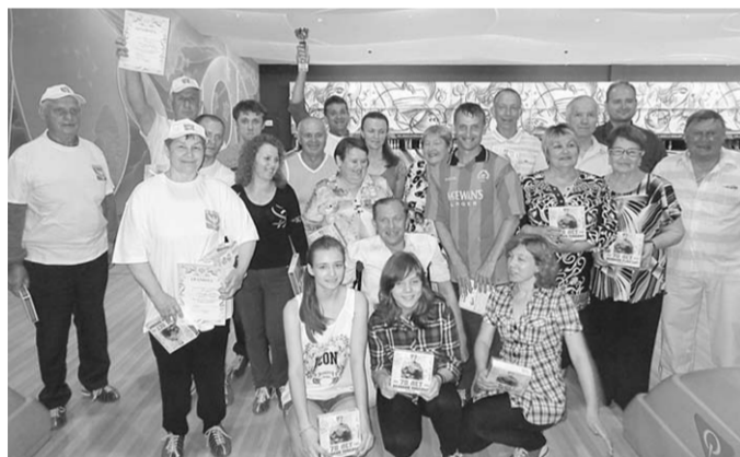
Участники соревнований по боулингу.

В Воронежской области состоялись первые межрайонные соревнования по боулингу среди инвалидов.