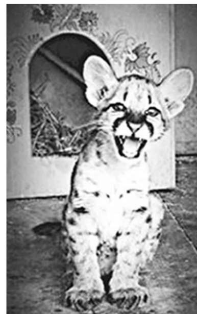
Детёныш пумы во всей красе.

...Вот и подумайте: могло ли быть подобное, будь в ту пору мобильные телефоны, по которым можно и позвонить, и принять звонок в любом месте и в любое время? Да разве она только, сотовая связь, так неузнаваемо изменила и нашу жизнь, и отношения человеческие? Конечно же – нет! Но это уже совсем другие истории.