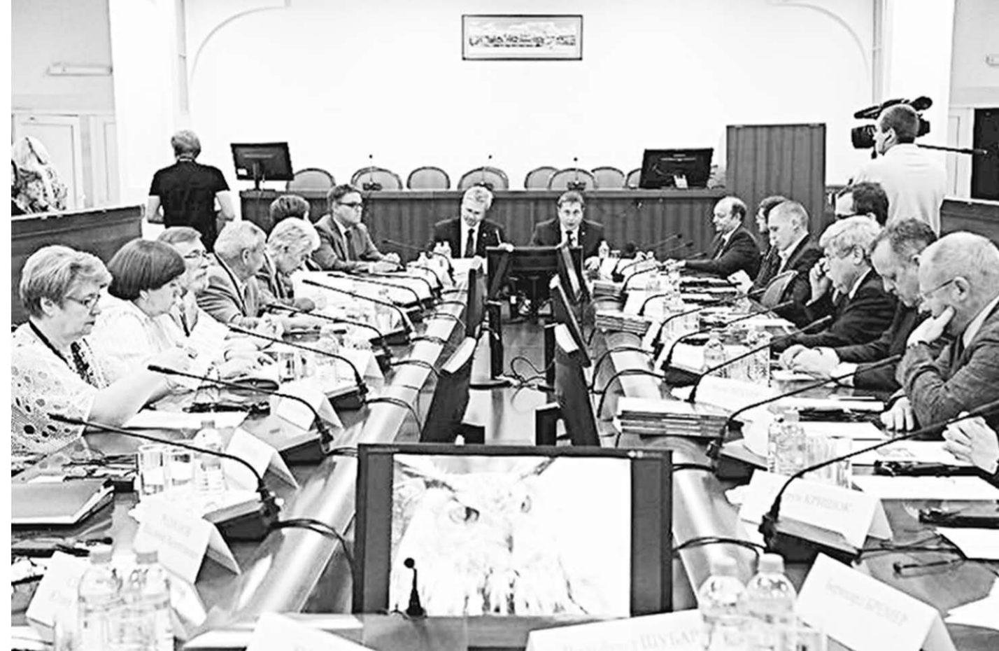
Тепло и радужно прошла встреча немецких выпускников в стенах ВГУ.

Также были зачитаны доклады: «Страницы культурной истории России и Германии и пути позитивного взаимодействия между странами сегодня», «Перспективы научного сотрудничества между университетами России и Германии: проблемы и пути их решения».