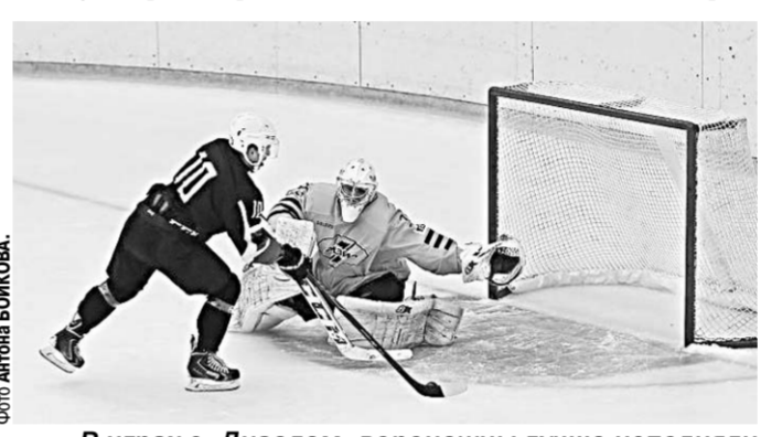
В играх с «Дизелем» воронежцы лучше исполнили послематчевые буллиты.

Спустя пару дней соперники провели ответный поединок на льду Дворца спорта «Юбилейный». Основные события раз-