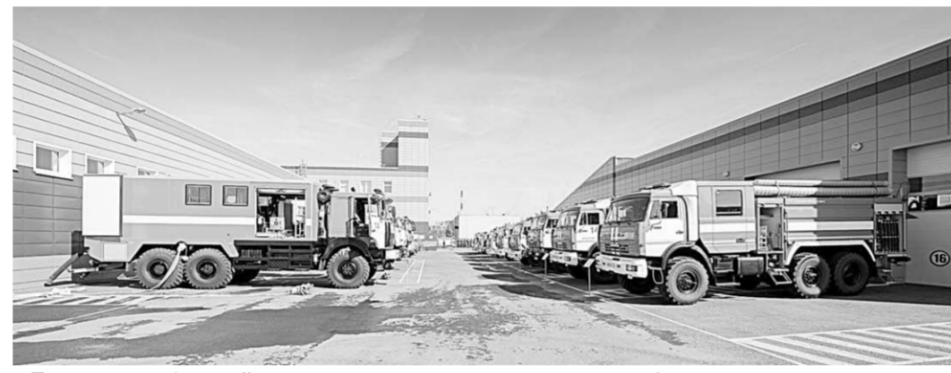
Парк автомобильной техники включает пожарные автомобили различного назначения.

ными респондентами для учета их мнения в ходе принятия решений, способных повлиять на рейтинговую оценку; повысить уровень подготовки сотрудников, ответственных за достижение наилучших значений показателей рейтинга и другое.