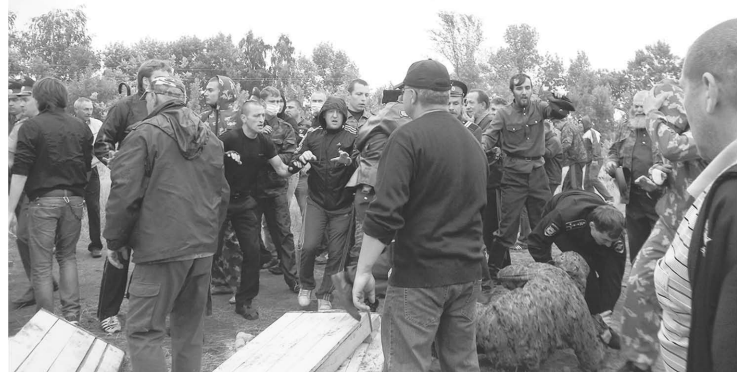
2013 год. Противостояние на Сорокинском поле. Хочется надеяться, что подобное не повторится.

– Ответ Чередникова был краток: «За получение денег, чтобы прекратились протестные действия».