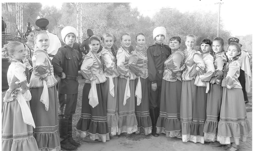
Фестиваль для «Вечерушки» стал первой пробой сил.