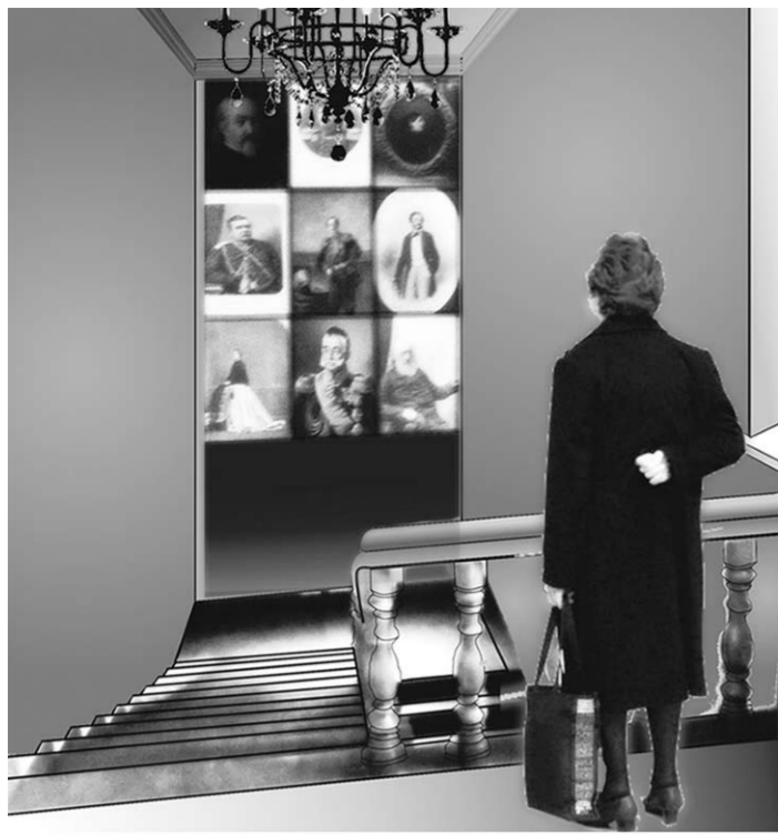
Архитектурно-художественный проект музейной экспозиции «Сибирский коридор».