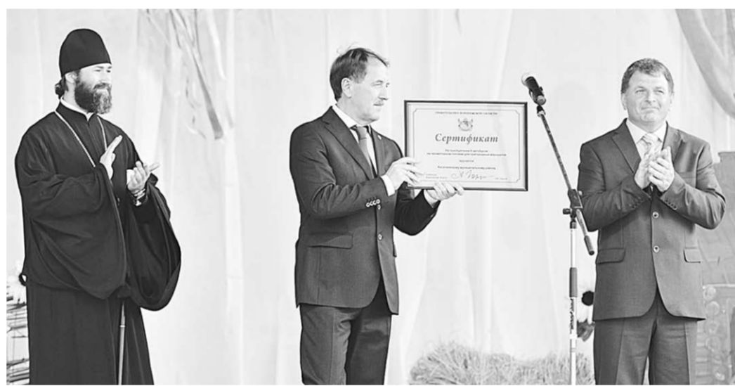
Губернатор Алексей Гордеев вручил калачеевцам сертификат на шесть новых автобусов.

Предприятие развивается стабильно, прирастающая поголовье