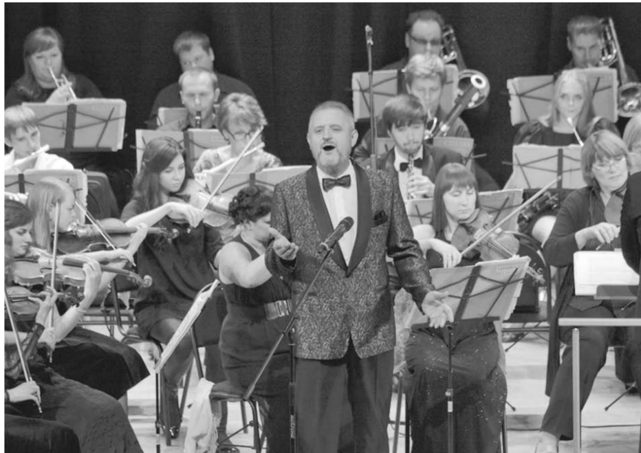
В тот вечер со сцены звучала классика.

Публика благодарно встречала каждый номер. На фоне пугающих свистящих на всех телевизионных кнопках; на фоне крика народных ораторов, борющихся за правду в многочисленных шоу; на фоне пошлых шуточек заезженных номеров, притворяющихся, что им очень весело, хорошая музыка напоминала, что есть другая жизнь – светлая, добрая, согревающая душу.