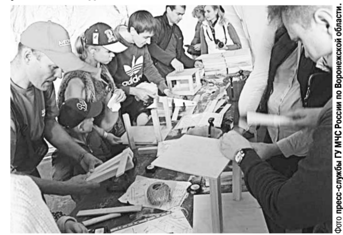
Ребята с интересом учились работать с деревом.

Семейный фестиваль «Папин день» прошёл в минувшее воскресенье в селе Ямное Рамонского района. Его девизом стал слоган «Папа может!».