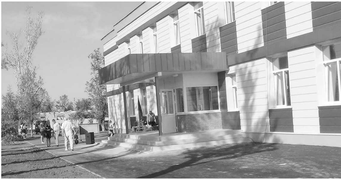
Школа в посёлке Хрящеватое.

Увидев, в каком состоянии находится поселок и учебное заведение, лискинские шефы открыто сомневались в том, что школу реально удастся восстановить к началу учебного года. И потому звонок в Лиски от директора Хрящеватовской