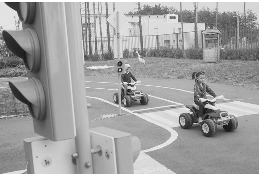
Шуберские дошколята Правила дорожного движения знают назубок.