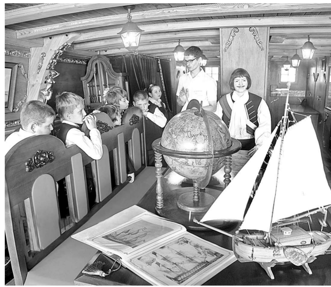
Лицеисты с неподдельным интересом знакомятся с корабельной экспозицией.