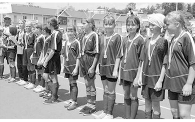
Юные футболистки из Терновки.

Финальный турнир всероссийских соревнований по футболу «Кожаный мяч» в младшей возрастной группе среди девочек (10-11 лет) прошёл в Туапсе. Юные футболистки из Терновки заняли второе место.