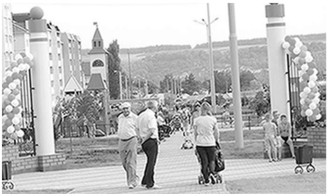
Новый сквер в Лиска.

Многофункциональная зона отдыха появилась в новом микрорайоне Лиска.