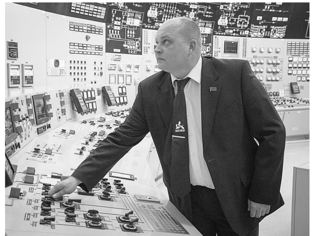
На блочном щите управления энергоблоков №№3-4.