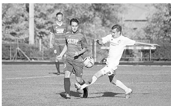
Фотопанорама ФК «Факел».

Дублёрам «Факела» нелегко на равных противостоять лидеру первенства, располагающему мастеровитыми игроками.