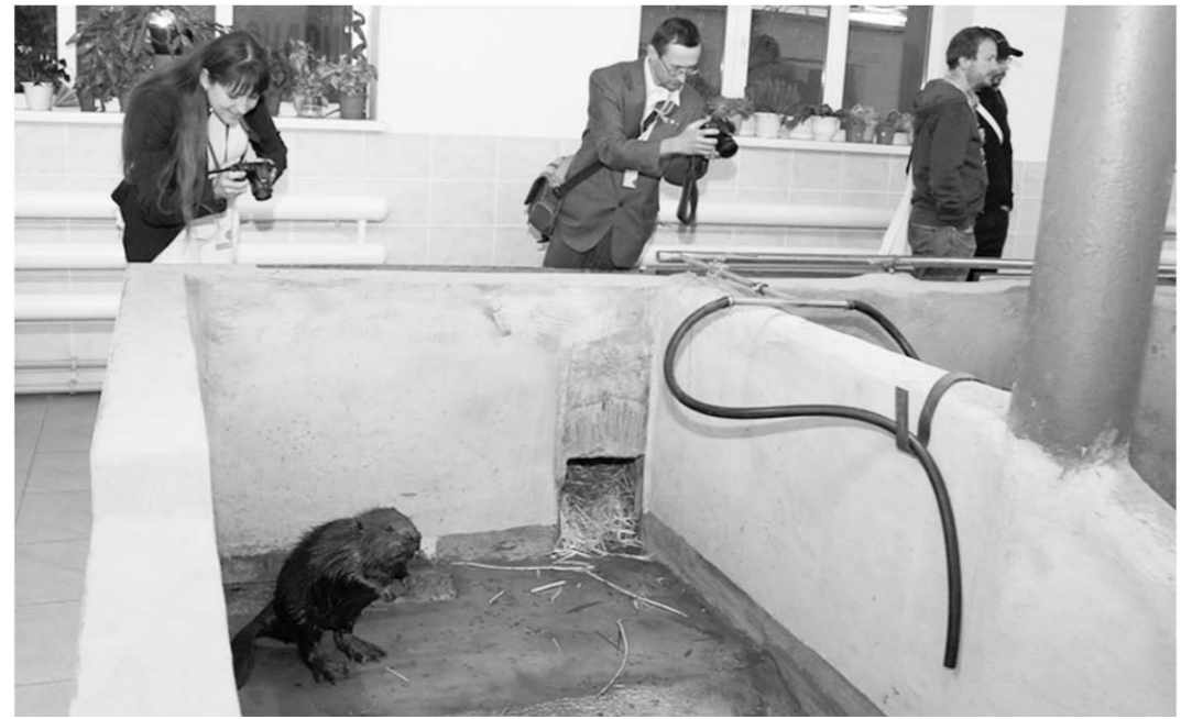
Во время симпозиума можно было увидеть, как обитают бобры в условиях, приближенных к природным.