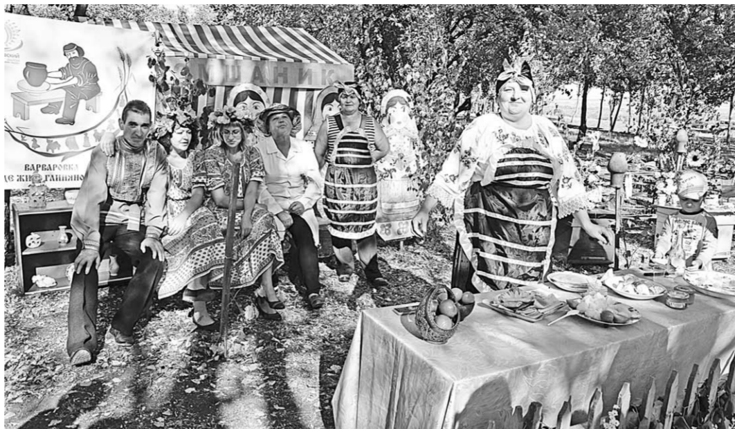
Подворье из Варваровского сельского поселения привезло на фестиваль и мёд, и поделки из глины.

Фестиваль литературно-музыкальный, по традиции самое трепетное отношение - к поэтам. Поэтому они и едут за десятки, а то и сотни километров, чтобы прочитать свои стихи. Из воронежских были представители литературных объединений из Россоши, Острогожска. Читали с удовольствием - сначала на сцене районного Дома культуры, а затем в дворянском парке. Публика принимала их доброжелательно. Но не были забыты и другие виды искусств. Здесь выступили народные танцевальные и песенные коллективы, в том числе казацкие. Художники, пользуясь щедрой теплотой осени, на свежем воз-