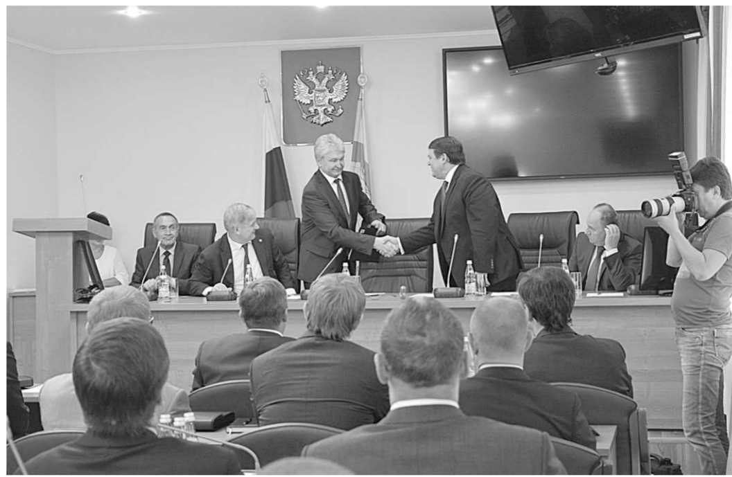
Напутствие на новые дела на благо города.

Многopартийность — это положительный момент, она даёт более полную картину, помогает увидеть те недостатки, о которых власти, может быть, не знает. Главное, не забывать о том, что представители каждой партии представляют на благо нашего города и его жителей.