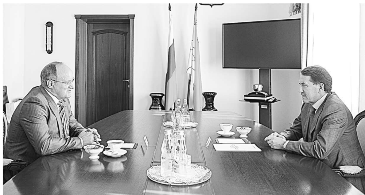
Между губернатором Воронежской области Алексеем Гордеевым и вице-губернатором Санкт-Петербурга Владимиром Кирилловым состоялся обстоятельный разговор о путях развития сотрудничества в областях экономики и культуры.

Живые контакты как нельзя лучше помогают сотрудничеству: укрепляют горизонтальные связи между регионами, а значит, напрямую служат развитию экономики всей страны. В программу