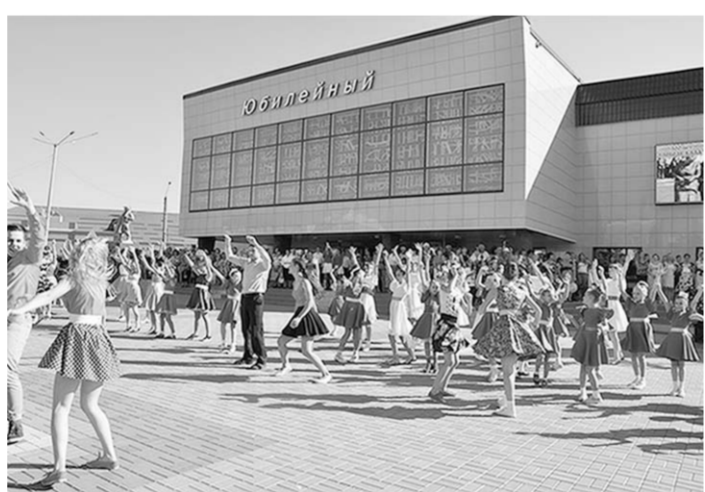
Детские коллективы дарили зрителям хорошее настроение.