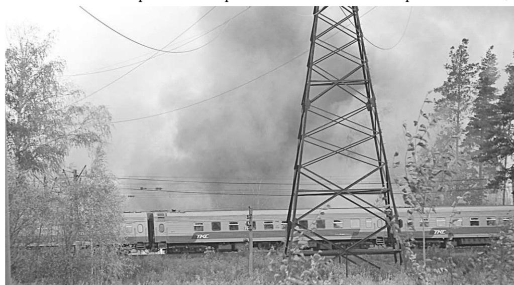
Из-за дыма в солнечный день неба не было видно.

Происшествие | Два крупных возгорания, угрожавших безопасности движения, ликвидировали пожарные поезда Лискинского региона ЮВЖД