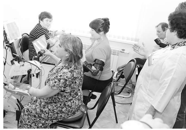
В реабилитационном отделении воронежской городской больницы №5.

В Воронежской области ежегодно происходит более 700 несчастных случаев на производстве