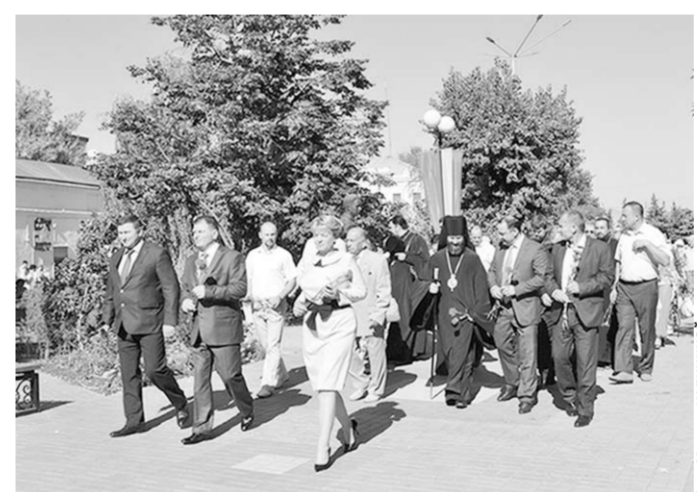
Возложение цветов к мемориалу памяти.