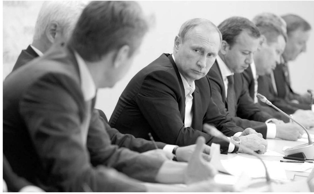
Президент Владимир Путин во время совещания по вопросам развития сельского хозяйства.

— Нужно сейчас воспользоваться этим моментом для того, чтобы твердо встать на своем собственном рынке. А потенциал, конечно, для этого есть. В последние годы в отрасли реализуются крупные инвестиционные проекты, ведётся реорганизация предприятий. И в целом российский агропромышленный комплекс демон-