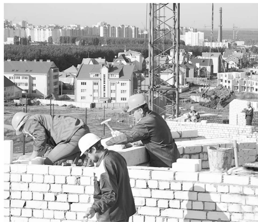
Строительство жилья в Воронеже не прекращается ни на день.

— Застройщики дают очень хорошие скидки на квартиры, в то время как ситуация с деньгами у покупателей сложная. Что касается вторичного жилья, то здесь цены держатся на прежнем уровне и могут быть даже выше, чем у застройщиков. Это связано с тем, что долевку, в силу разных нюансов, нельзя приобрести по тем же военным сертификатам, а жильё на вторичном рынке — можно. Сегодня и застройщики, самостоятельно реализующие жильё, готовы отдавать его на разных условиях: под военный сертификат, программу «Жильё для молодых семей» и т.д. Стоимость квадратного метра