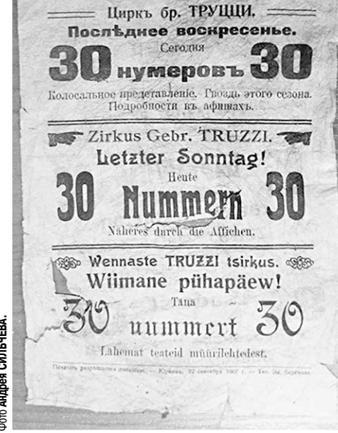
Та самая листовка цирка братьев Труцци.

меется, они лежат под стеклом, посетитель может прочитать лишь текст на титульных листах. Однако можно полистать копии этих изданий, сделанные в единственном экземпляре благодаря прохоровскому гранту.