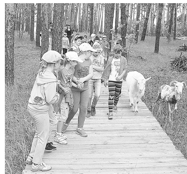
На экскурсии по экологической тропе.

В живописном лесном уголке на берегу водохранилища в областном центре открылся зоопитомник «Червлёный Яр» Воронежского зоопарка им. А.С. Попова.