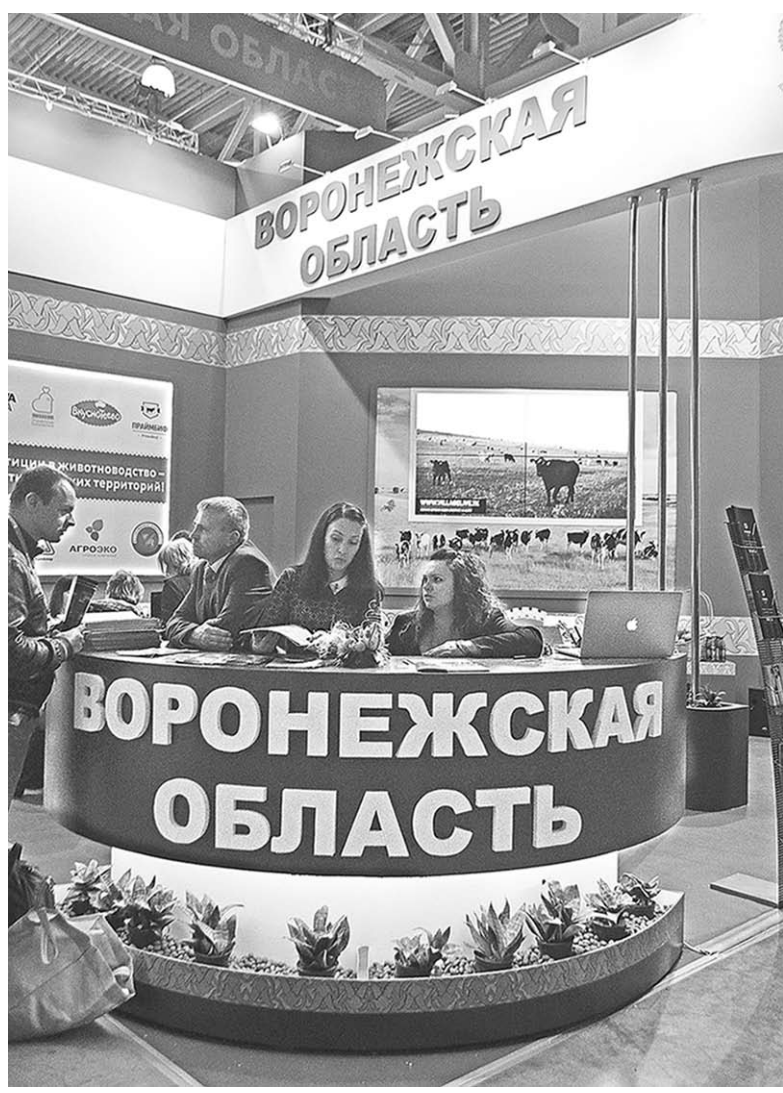
У стенда воронежских сельхозпроизводителей.