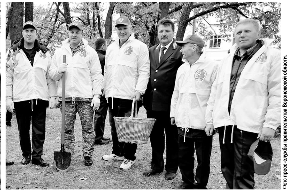
Гости — участники экологической акции «Живи, лес!»