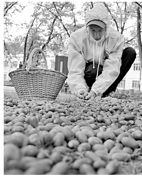
Вот такой урожай жёлудей!

— То, что сегодня делает Воронежская область в сфере лесного хозяйства, для нас