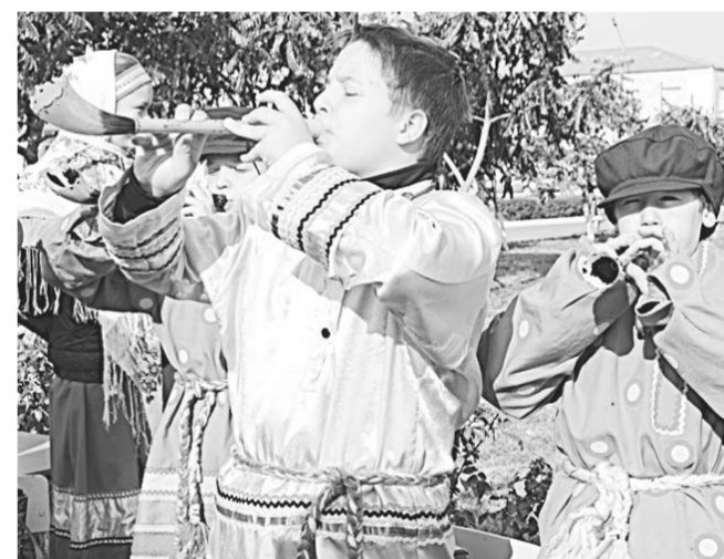
Гостей встречали скоморохи-зазывалы.

Она прошла на Соборной площади храмового комплекса в Россоши.