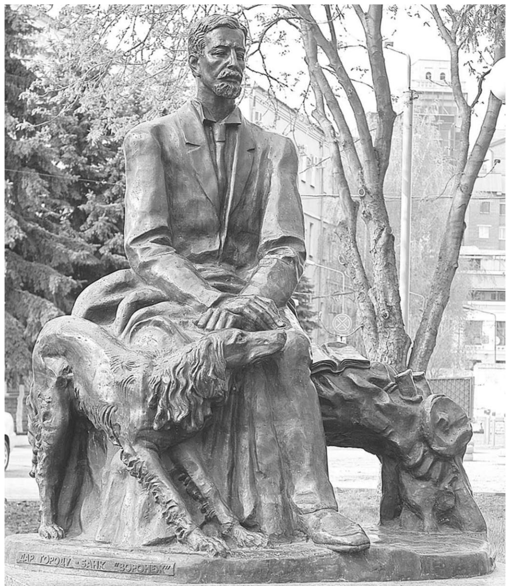
Памятник Ивану Бунину в Воронеже.

гало самым обездоленным из русской эмиграции.