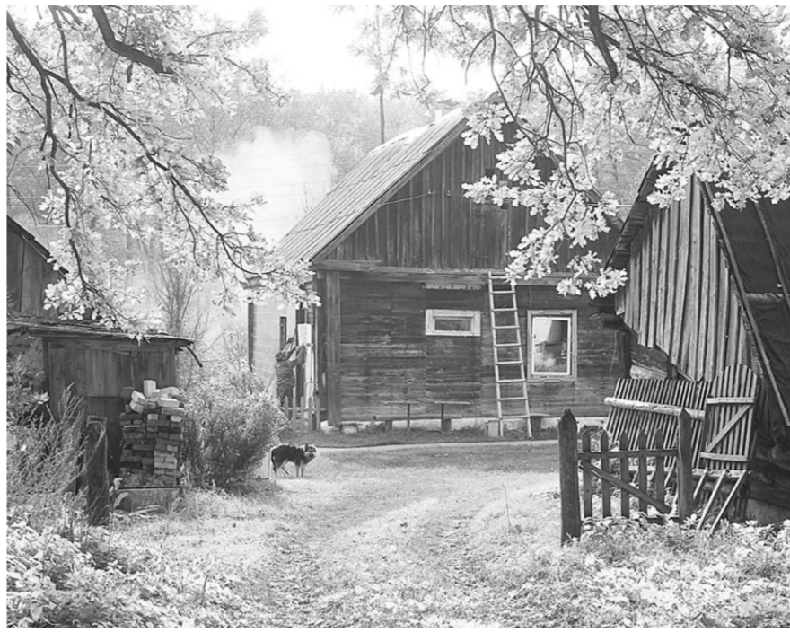
Осень в заповеднике.