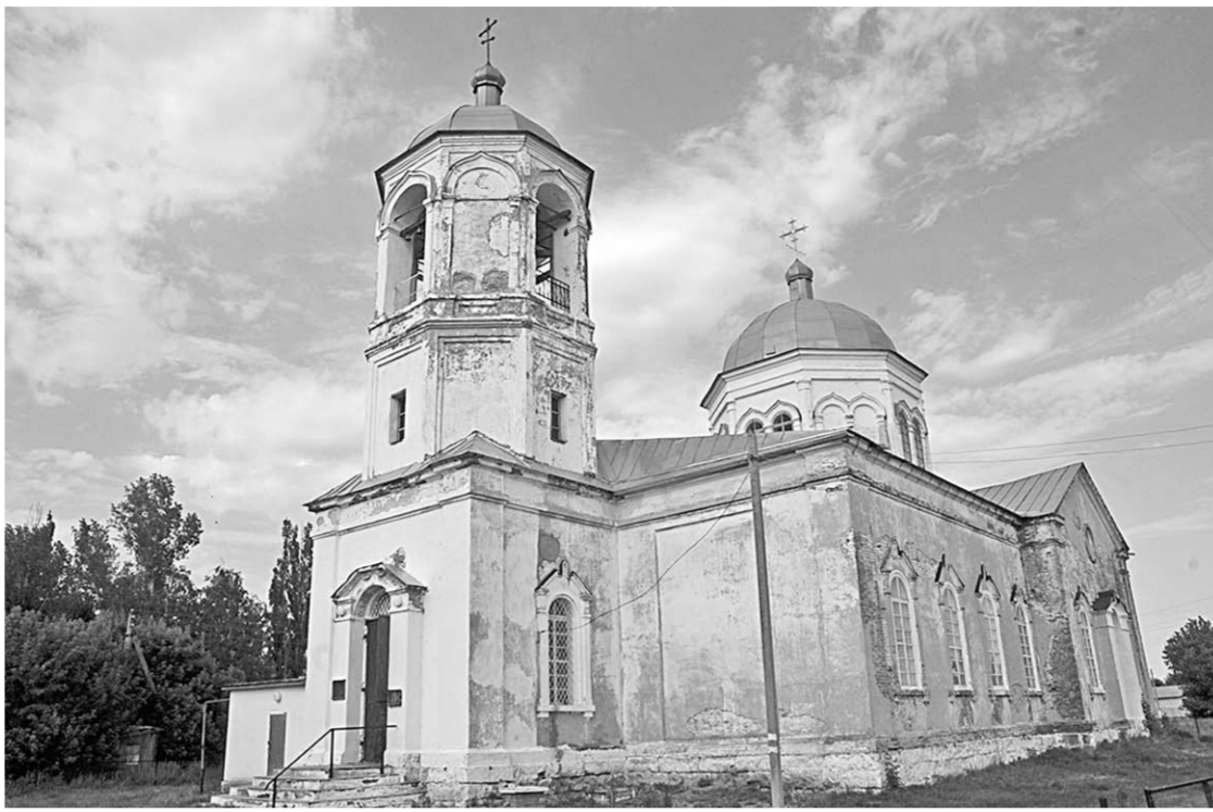
Храм Рождества Пресвятой Богородицы в селе Старая Криуша.