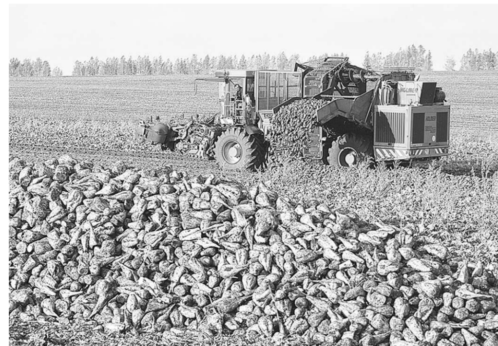
На свекловичных плантациях продолжается уборочная страда.

Трудной выдалась и копка сахарной свёклы, которая занимает в районе площадь в 4954 гектара. Урожайность сладкого корня, уже поднятого из твёрдой, как бетон, земли, не превышает 292,2 центнера с гектара. «Это всего лишь 65 процентов от запланированного», – объясняет ситуацию на свекловичных плантациях начальник от-