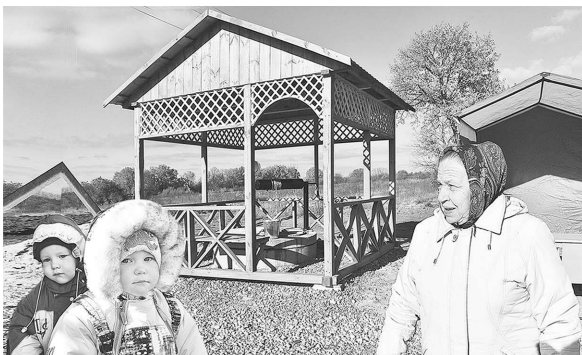
В Гвоздёвке новому колодцу рад и стар и млад.

Почему темой проекта стало строительство именно колодца?