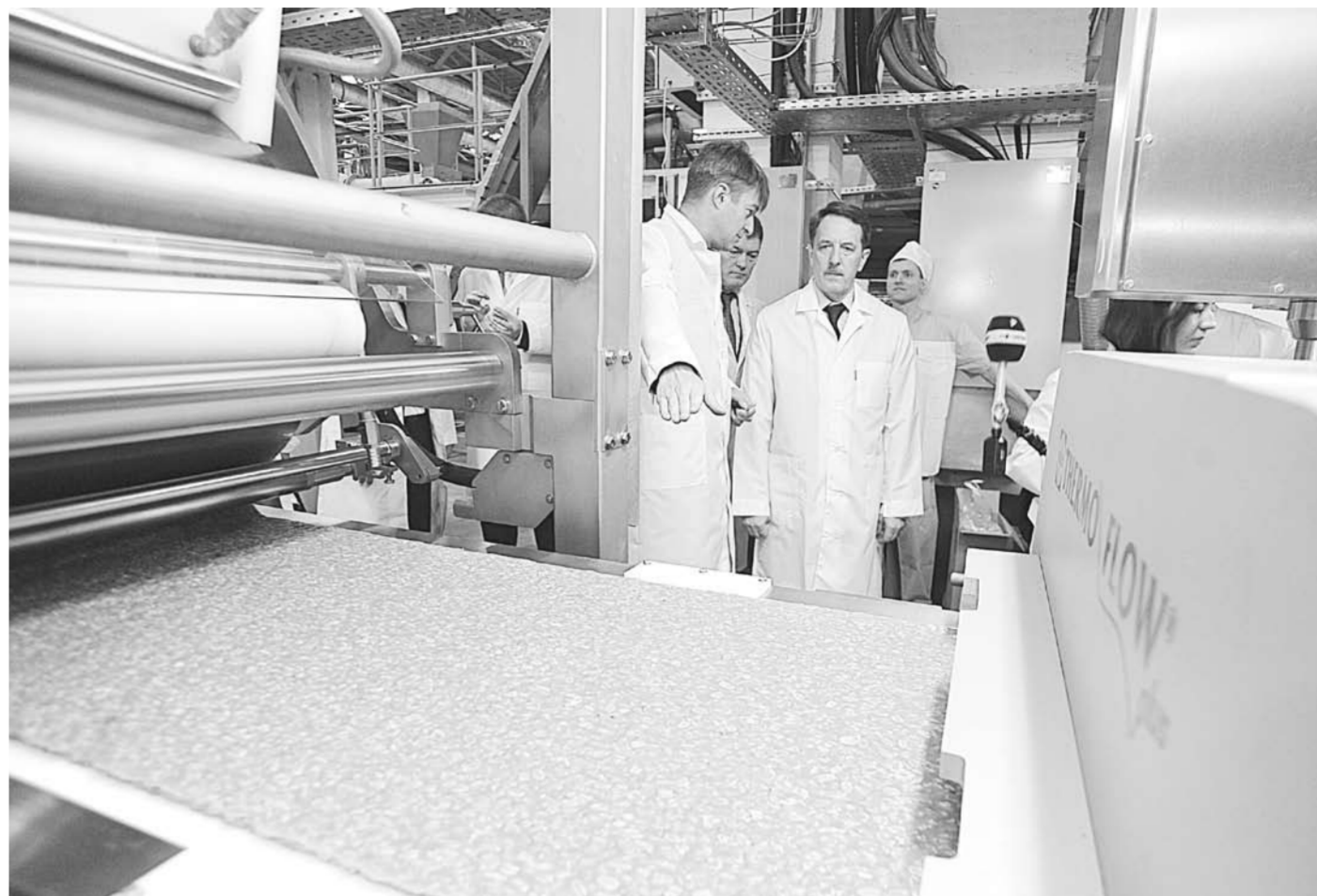
На губернатора Алексея Гордеева произвела впечатление производительность «КДВ Воронеж».

— Школьная тема сегодня тоже на острие проблем. Конечно, в большинстве сёл школы у нас работают, мы их содержим, не закрываем. Но встаёт вопрос касательно уровня образования, который дают школы. Нам по-прежнему не хватает учителей. В результате, в школах работают педагоги, средний возраст которых стремится к пенсионному. Это – тревожная тенденция. Меня радует, что в этом году в школы Рамонского района пришли 10 молодых специалистов. Но на сегодняшний день этого мало.