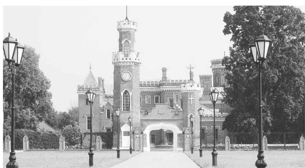
Замок принцессы Ольденбургской – гордость не только Рамонского района, но и всей Воронежской области.

— Ещё одна большая тема: кадры для объектов здравоохранения на селе. Несмотря на то, что медицинское обслуживание населения – это полномочия областной власти, для нас эта сфера тоже очень важна, ведь от качества предоставления медицинских услуг населению напрямую зависит уровень его удовлетворённости качеством жизни. Сегодня, к сожалению, большинство заведующих ФАПами – пенсионеры. Молодые специалисты в сельскую медицину идти не спешат. Выход здесь я вижу один: строить ФАПы, и тут же рядом – возводить жильё для