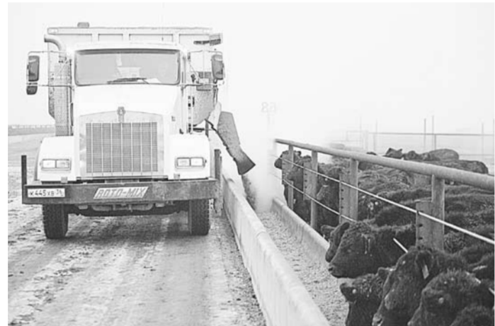
На откормочной площадке ООО «Заречное».

— И на этом производстве трудится не менее 350 человек