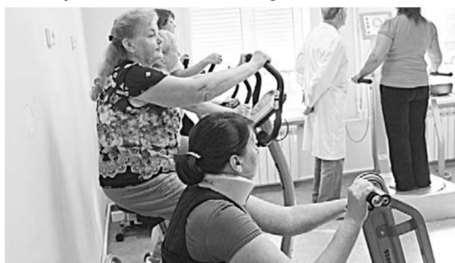
В зале лечебной физкультуры проходит очередной урок здоровья.

Число несчастных случаев на производстве не уменьшается, и врачи воронежских медучреждений прилагают немало усилий, чтобы помочь пострадавшим.