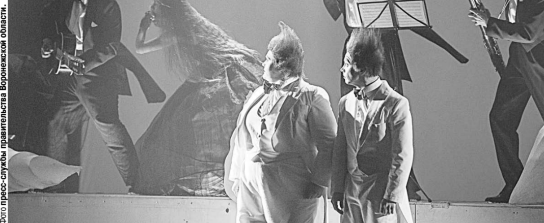
Сцена из спектакля «Русалочка».

Незадолго до открытия фестиваля «МАРШАК» довелось посетить лекцию, на которой показывали фрагменты постановки Роберта Уилсона «Эйнштейн на пляже», где значительную часть времени странное одеяние совершают повторяющиеся, лишённые «обычной человеческой логики» действия под минималистичную, похожую на звук заезавшей пластинки музыку, создавая у публики ощущение, что та попала в чужую, непостижимую реальность.