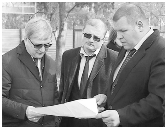
Александр Гусев взвешенно подошёл к решению проблемы.

— Я прошу вас проработать совместно с общественностью варианты, где инвестор может разместить ледовый каток, который является необходимым для развития массового спорта в Воронеже, — обратился к подчинённому мэр.