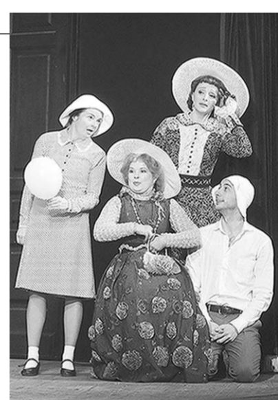
Сцена из спектакля «Лёля и Минька».