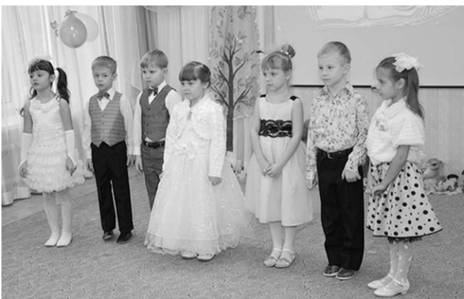
На сцене – юные юбиляры.

Детский сад № 69 в поселке Боровое отметил круглую дату – 50-летие. Поздравить юбиляра пришли представители Воронежской городской думы.