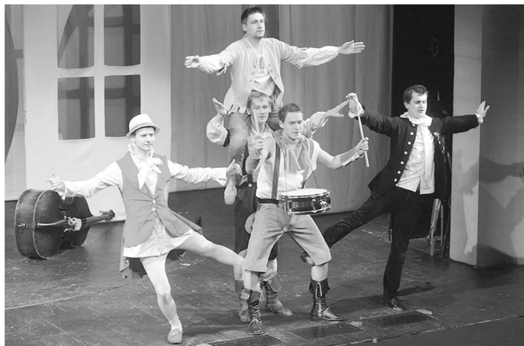
Сцена из спектакля «Бременские музыканты».

Что же касается встречи с известным режиссером Адольфом Шапиро, то она знает дилемму «детское — не детское», что каждый возраст считает спектакль то, что доступно возрасту, а главная