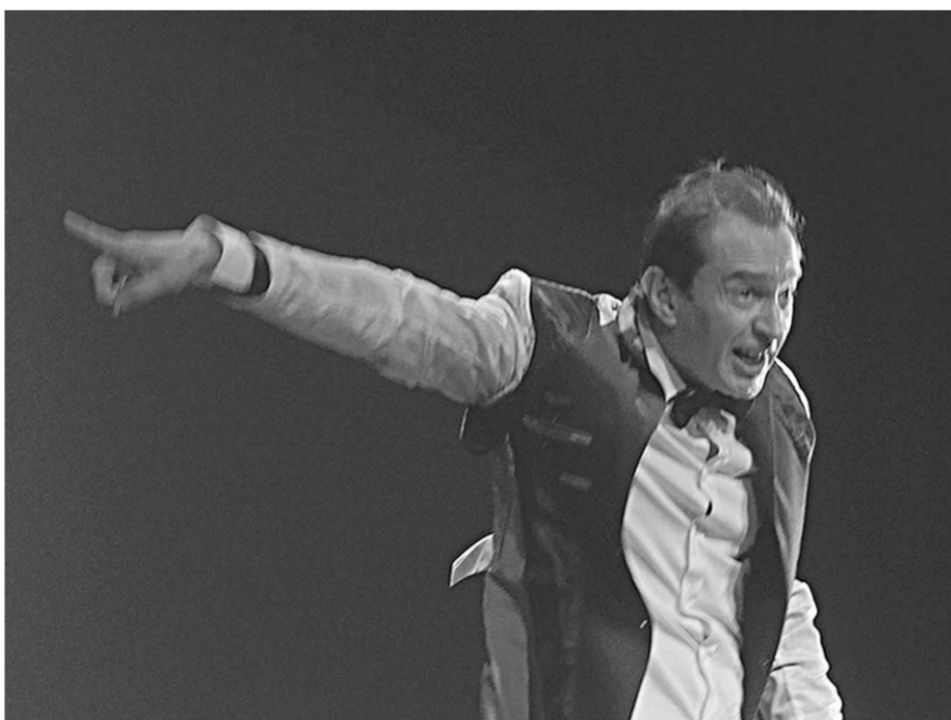
Константин Хабенский играл с детьми на равных.

Спектакль, пожалуй, не во всём понятен человеку, который впервые услышит имя Хармса. Особенно в одном из эпизодов, где действие происходит без слов и предлагается некая метафора про «человеческое общежитие». Из иных миниатюр взяты две-три фразы, и попорбуй пойми, почему альтилисты Бибиков и Аугенафельд познакомились именно таким образом. История человека, который залез в сундук, чтобы наблюдать борьбу жизни и смерти, удачно, казалось бы, смонтирована с