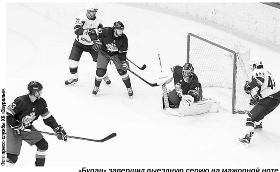
«Буран» завершил выездную серию на мажорной ноте, разгромив ХК «Зауралье».