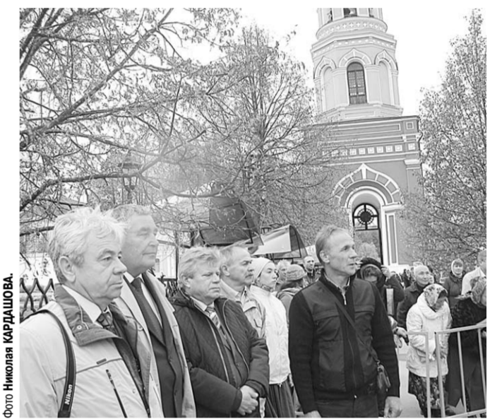
Давыдовцы знакомятся с историческими местами.