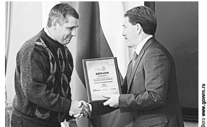
Победителей конкурса «Золотые руки» награждает губернатор Алексей Гордеев.

В Воронеже состоялась церемония награждения победителей областного конкурса профессионального мастера «Золотые руки», который проводится в регионе с 2005 года с целью поднаторства престиж рабочих профессий, стимулировать рост квалификации работников и привлечь молодежь в производственную сферу.