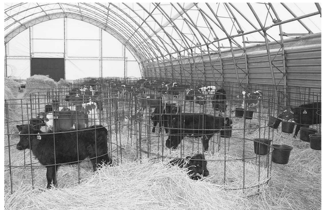
К животноводству – особое отношение.