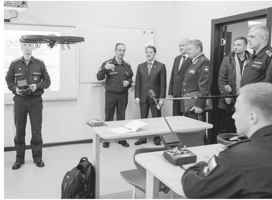
Алексей Гордеев в классе беспилотных летательных аппаратов.

Губернатор Алексей Гордеев после посещения кадетского корпуса отметил: — Это уникальное учреждение общего образования. Таких в стране при содействии Министерства обороны РФ создано три. Можно сказать, что это целевой набор ребят, которые хотят стать военными. Сюда принимают талантливых, активных и подготовленных. Нам важно и то, что на сегодня