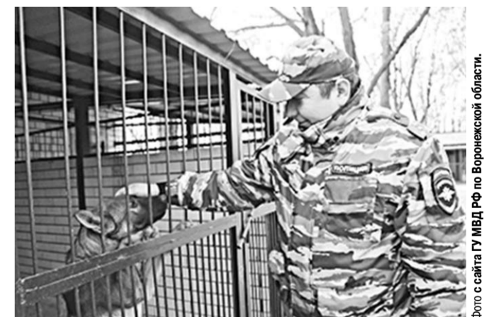
С питомцами здесь очень дружеские отношения.

В Воронеже после реконструкции и модернизации открылся Центр кинологической службы регионального ГУ МВД России. Здание рассчитано на работу 57 сотрудников, а содержать здесь можно до 150 собак.