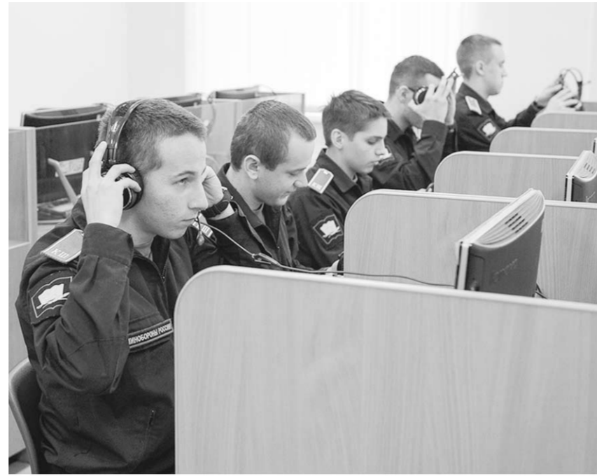
Кадеты на занятии.

Власть | Губернатор Алексей Гордеев: «Кадетская инженерная школа – уникальное учебное учреждение»