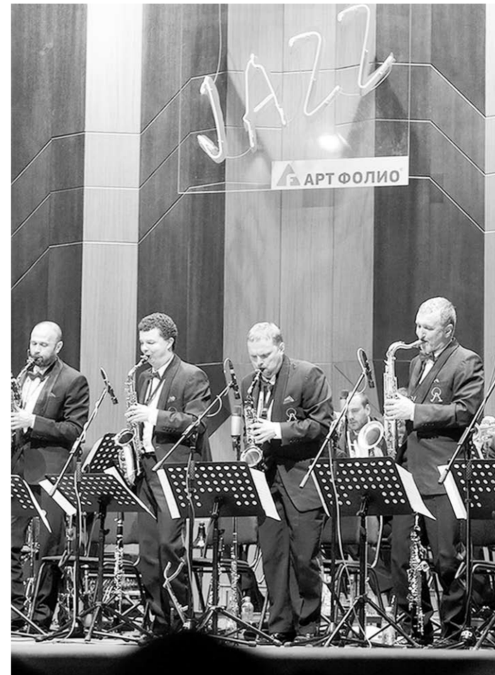
Выступает оркестр имени Олега Лундстрема.