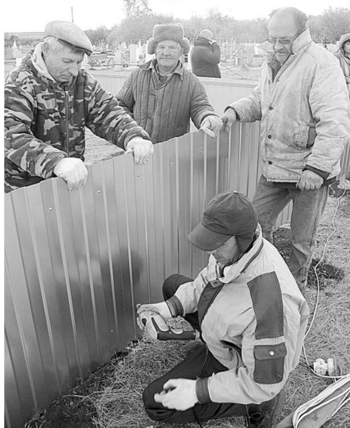
Хоть и непогода стоит, осенняя распутица, а дело надо делать.

День за днём, когда с утра, а то и после обеда, как время свободное появится, съезжаются хуторские мужики на погост. Многие уже успели сделать