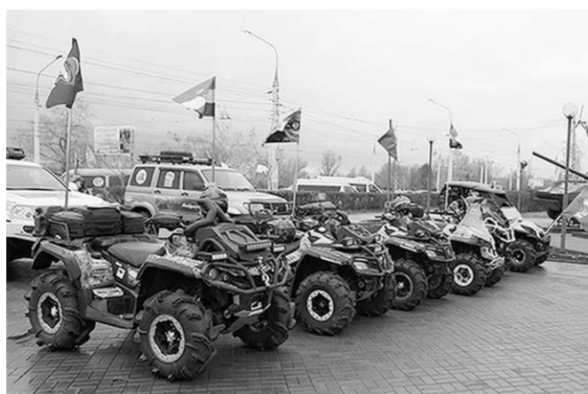
К технике участников пробега был повышенный интерес.

Уверен, это очень своевременная инициатива. Такой парад позволит нам еще лучше ощутить силу и единство современного российского народа! — подчеркнул спикер.