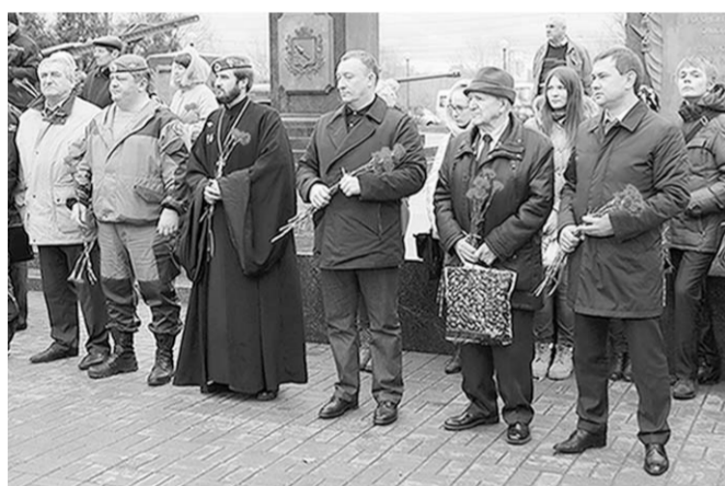
Участники марш-броска в Воронеже.

По силе воздействия на ход событий той Великой войны эти парады приравняются к важнейшей военной операции.