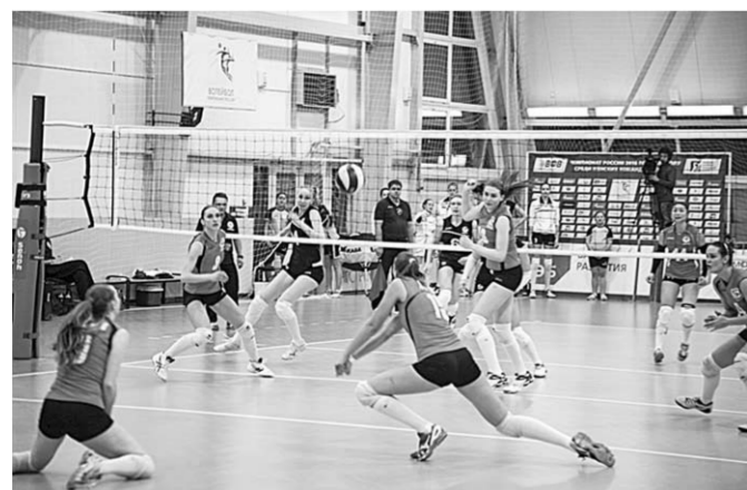
Проявив завидные волевые качества, ВК «Воронеж» одержал первую победу в чемпионате.