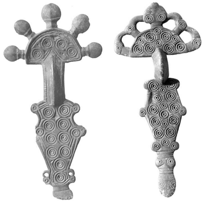
Так выглядят фибулы, а проще говоря, застежки.

Как многообразна и насыщена наша история событиями, которые протесуют робкой поступью через украшения наших предков. Как непрост был их мир и как величествен. А новые находки и открытия – страницы нашего прошлого из великой книги времени ждут археологов. Чтобы понять наших предков и самих себя.