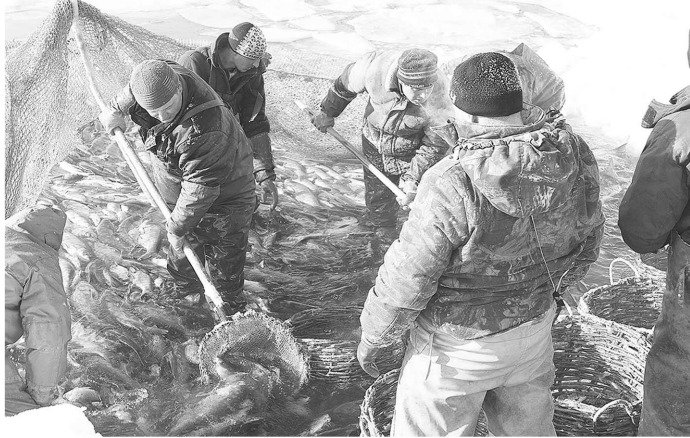
До ежегодной поставки в продажу 5 тысяч тонн товарной рыбы в Воронежской области ещё далеко, но продвижение вперёд уже заметно.

Что касается материальной поддержки, то тут Воронежская область показывает хороший пример многим другим регионам. В частности, на реализацию основного мероприятия «Развитие рыболовства» в 2015 году выделено из областного бюджета 12 миллионов рублей субсидий. Для сравнения: перепеловодам «перепало» 8,6 миллиона