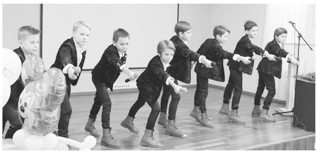
Перед работниками Центра выступили самодеятельные артисты и подарили им хорошее настроение.