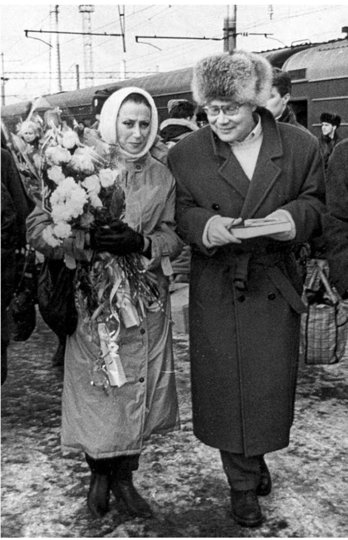
Моё интервью с Майей Плисецкой началось на воронежском перроне.

Впереди сидел водитель, рядом – какой-то тип в двубортном пальто, кроме шеи которого я так больше ничего и не увидел. Мы сели сзади. И поехали.