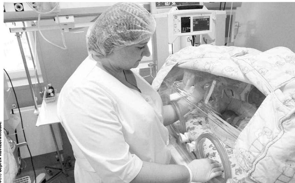
Таких бюветов, в которых находятся младенцы до килограмма весом, в Перинатальном центре шестнадцать. В них создают условия, максимально комфортные для детей.