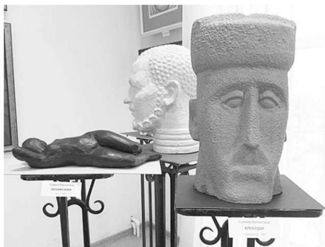
В зале представлены разные грани творчества художницы.