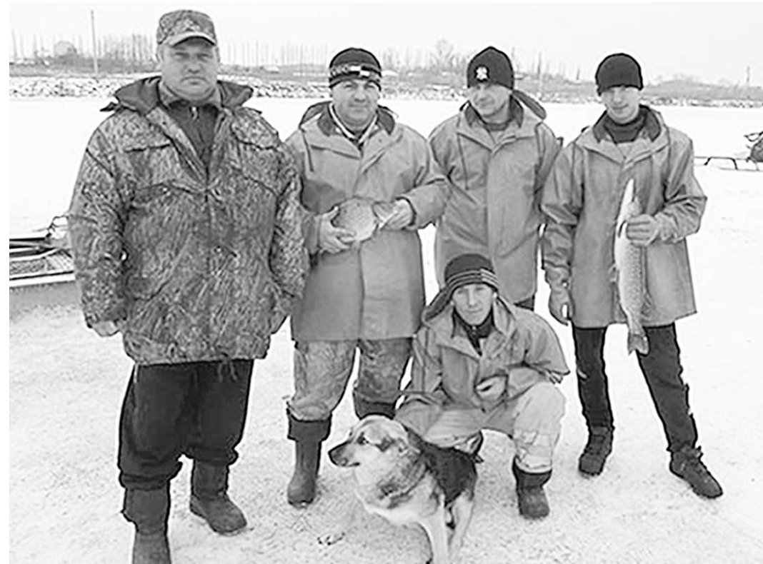
Зимний прудовой хозяйстве требует не меньших забот, нежели летом. На снимке – рыбаки Павловского района.