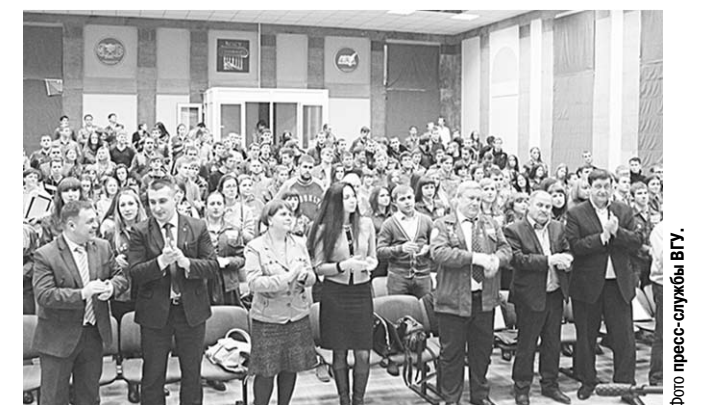
Аплодисменты тем, кто отличился во время трудового семестра.

В концертном зале ВГУ прошло торжественное закрытие трудового семестра воронежских студенческих отрядов и награждение отличившихся.