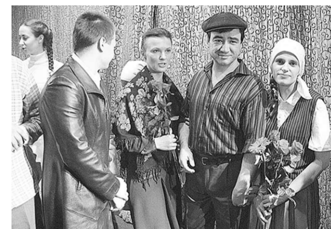
Актёры «Театра равных».

Воронежский «Театр равных» участвовал в Первом открытом фестивале неравнодушных людей «Есть у каждого из нас звёздочка своя».