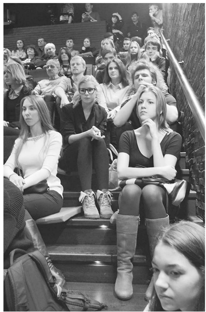
На фестивальных концертах и спектаклях заняты были даже ступеньки.