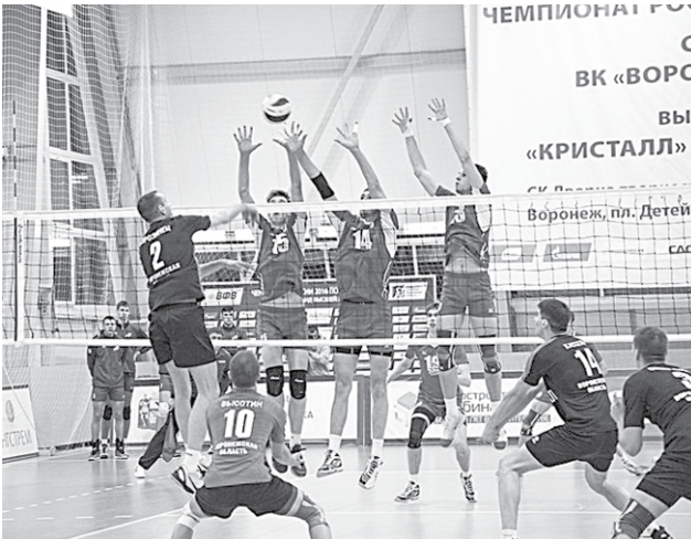
Победная серия «Кристалла» составила уже три матча. Так держат!