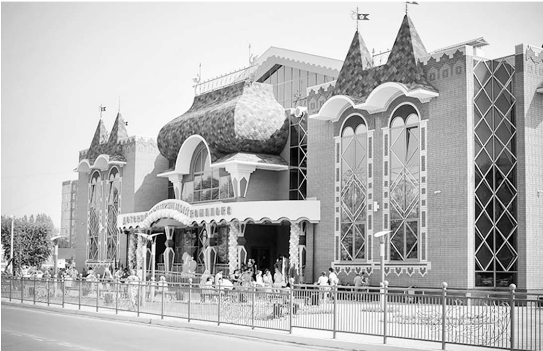
Двери «Измурудного» всегда открыты для детворы.

— Первая задача, которую ставим перед собой, — заниматься землёй. В сельском хозяйстве района есть скрытые резервы. Прежде всего, — в полеводстве. Необходимо начинать менять севооборот. Особенно мелким фермерским хозяйствам. Нужно втягивать в развитие животноводства те села, где, к сожалению, от этого давно отошли. Но сельскохозяйственные территории должны развиваться комплексно, соблюдая определённый баланс. Тогда у большинства людей, проживающих на этих землях, будет достойная оплата труда, у сёл — своевременно уплаченные налоги, а значит, налаженный быт, нормально работающая инфраструктура и т.д. Это — аксиома. Вторая задача — построить рядом с Россошью теплицы. Что касается города, то здесь нам крайне важно, чтобы продолжало развиваться ОАО «Минудобрения» — наше градообразующее предприятие. В плане инфраструктурных преобразований необходимо решить проблему с водой. В социальном аспекте — продолжить строительство жилья для молодых. В каждом селе — добиваться завершения строительства по губернаторской программе спортивных площадок. Ещё — построить ФАП в селе Шрамовка, помочь ремонту дорог, в особенности тех, что расположены внутри сёл. В связи с этим надеемся на поддержку областного дорожного фонда, который отлично себя зарекомендовал, помог решению многих вопросов. Конечно, есть и такие задачи, которые необходимо решать не только на нашем уровне, но и на уровне государства. И все они сводятся к общим целям: дать людям работу, показать перспективы, поддержать и помочь.