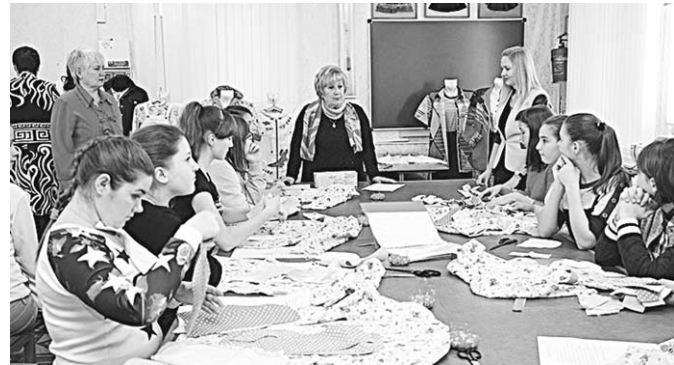
На практических занятиях в «Реальной школе».

Воспитанницы Воронежского центра дополнительного образования «Реальной школы» отправили новогодние подарки ребятам одного из детских домов Северной Осетии.