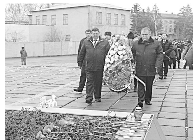
Возложение венков к мемориалу.

В Кантемировке в день 73-й годовщины освобождения поселка от немецко-фашистских захватчиков зажгли Свечу памяти.