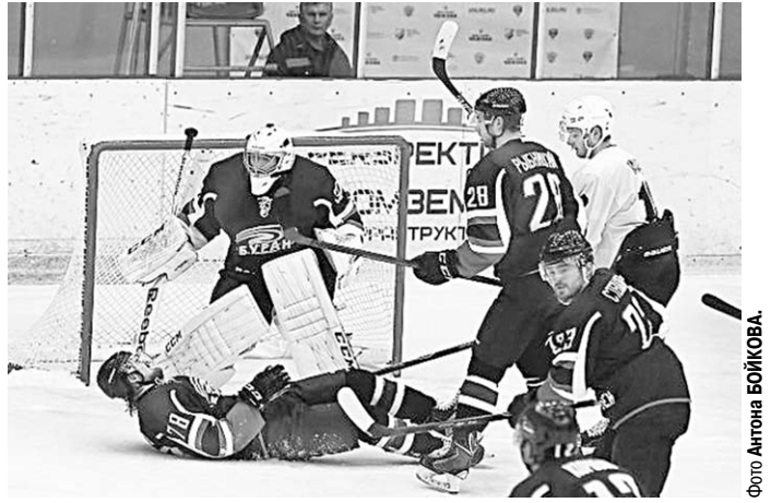
Отстоять свои ворота любой ценой!

Сыграв два матча на выезде, воронежцы открыли очередную домашнюю серию победным матчем с «Чelmetом». Этот коллектив находится на грани попадания в плей-офф,