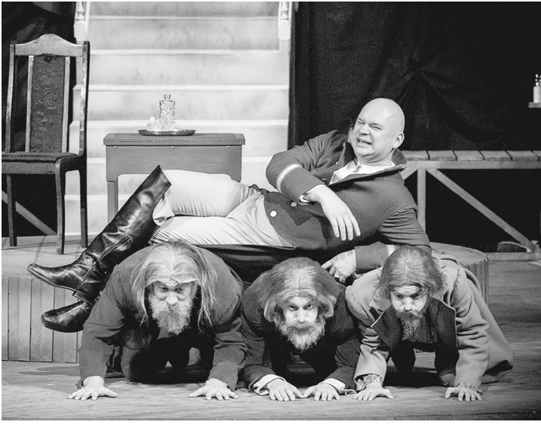
Сцена из спектакля «Ревизор».