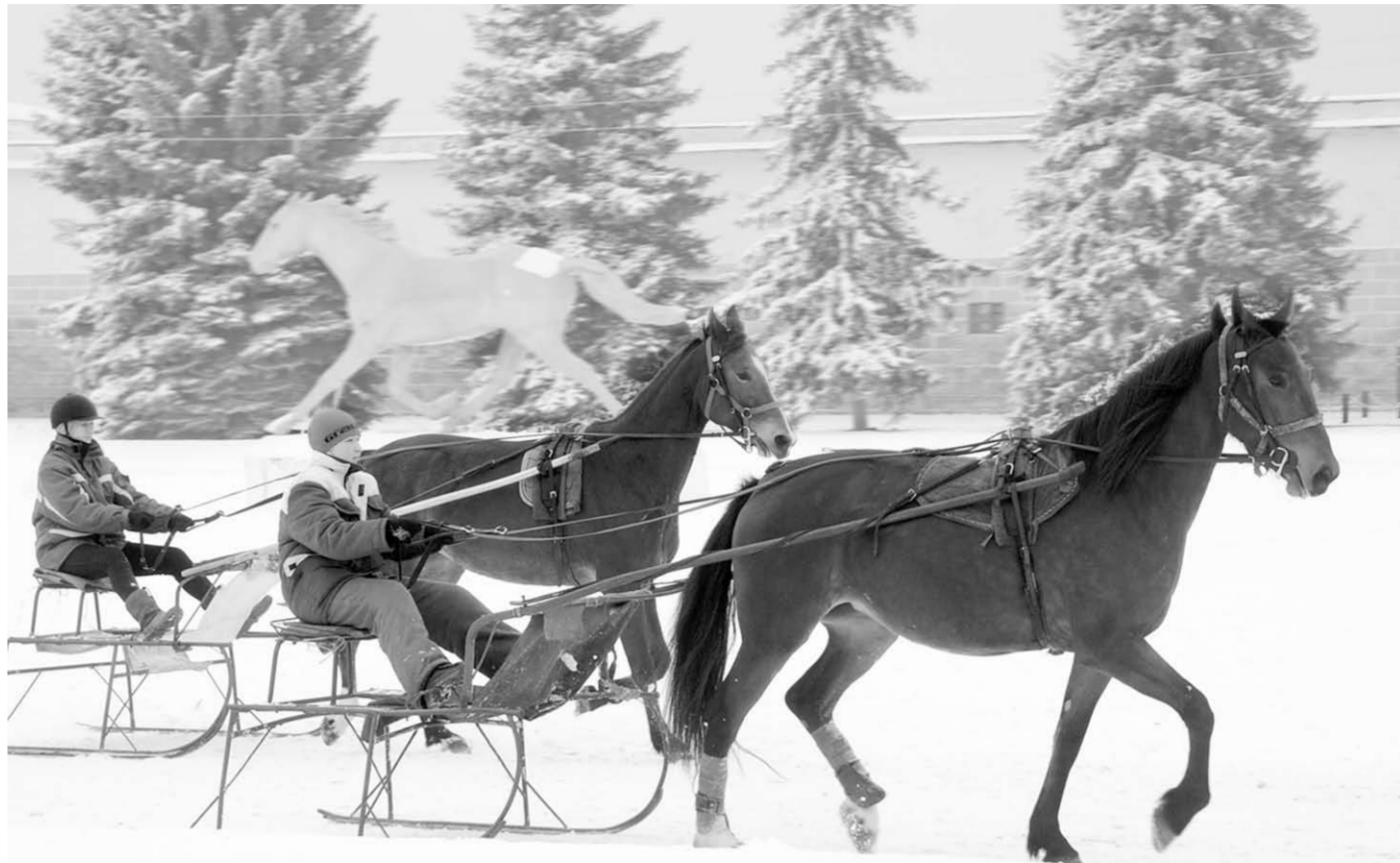
Снегу радуются и наездники, и их питомцы.

В январе 2016 года пройдёт очередной выпуск наездников. Их ждут в разных уголках страны – на Урале, в Сибири, центральных и северных областях страны, а кто-то вернётся в республику ближнего зарубежья. Заявки на выпускников