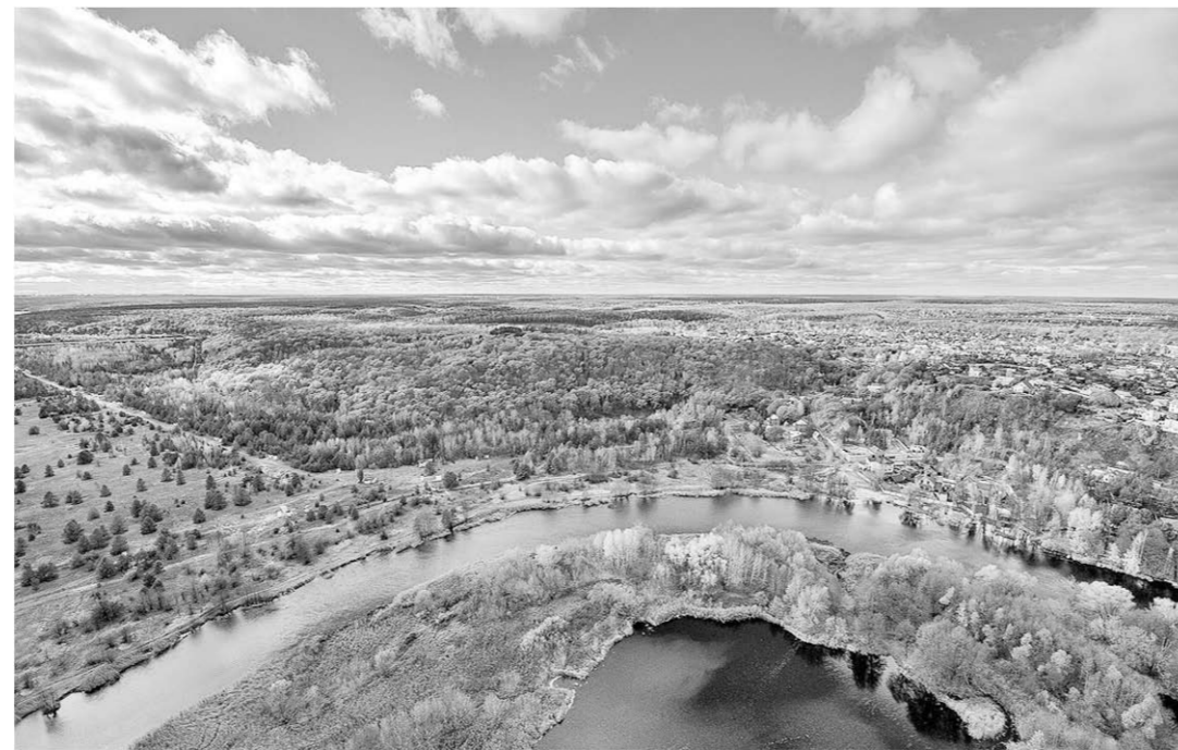
Одна из фоторабот Константина Толokonникова – «Родные просторы».