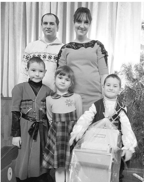
С подарком от Деда Мороза.