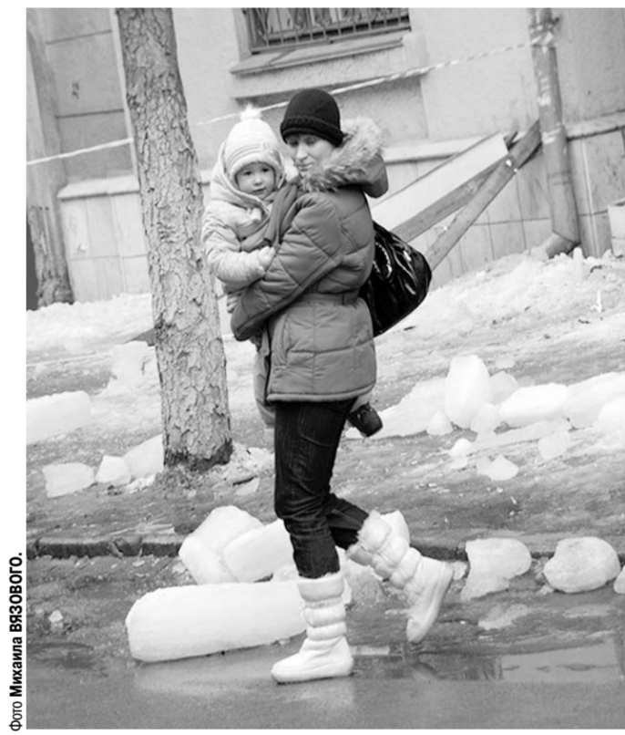
Ледяные испытания воронежцев.

Далее спускается в частный сектор – на Чуиковую, на улицу Одоевского я бы не посоветовал даже злейшему врагу. Ибо по этому буру можно оказаться внизу, перемещаясь только на пятой точке. Подняться же наверх может тот, кто в совершенстве освоил технику передвижения на четвереньках. В этом местные жители-изгой больше мастера. На спусках с улиц 20-летия Октября и Чапаева никто никогда не видел песка, и потому на Одоевского с первым же снегом перестает приезжать мусоровоз. Приходится людям копать пакеты для домашних отходов и разводить крыс.