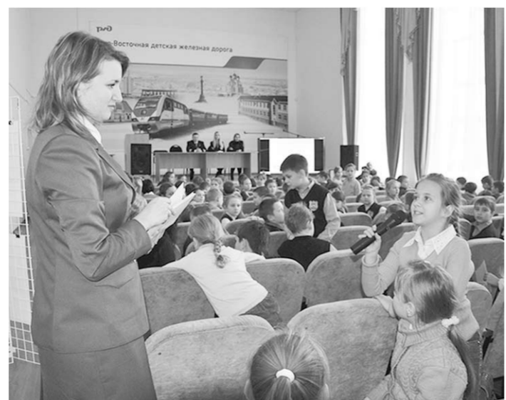
На все вопросы у ребят были правильные ответы.

Третьеклассники – народ непоседливый, фантазирующий и ищущий приключений. Учиты-