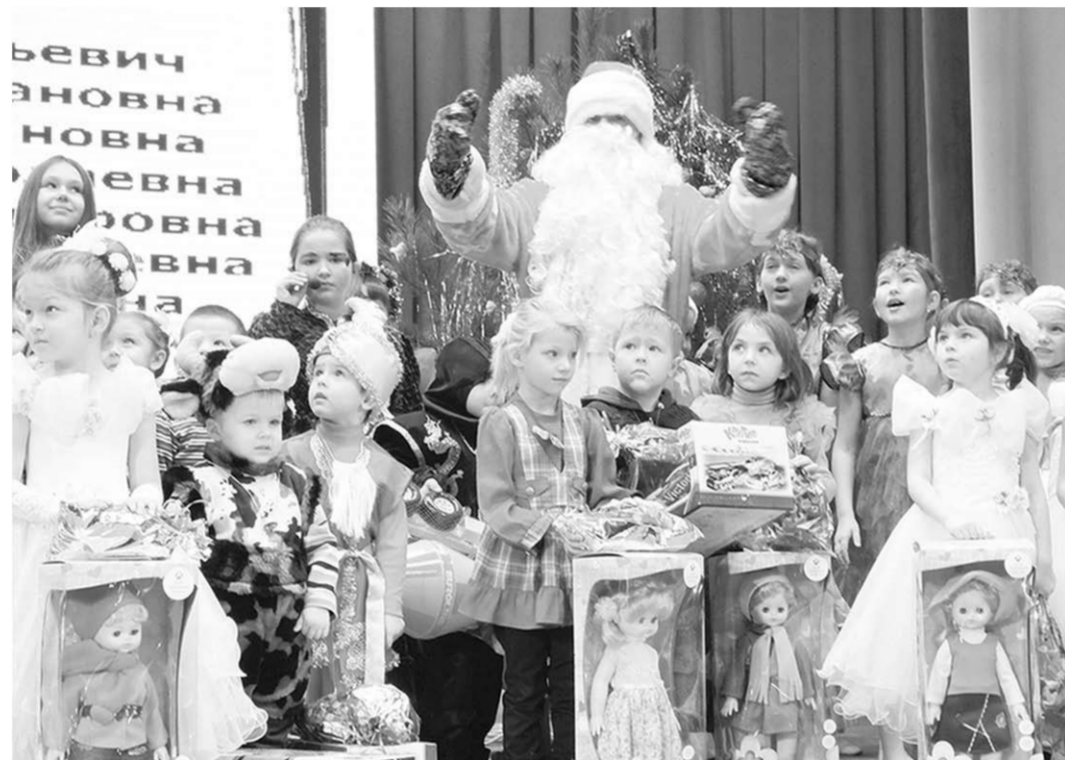
В Рождество мечты сбываются.

для мальчиков – машинки, для девочек – куклы. Ещё – пакеты со сладостями, которые также были приобретены на средства местного предпринимательского сообщества.