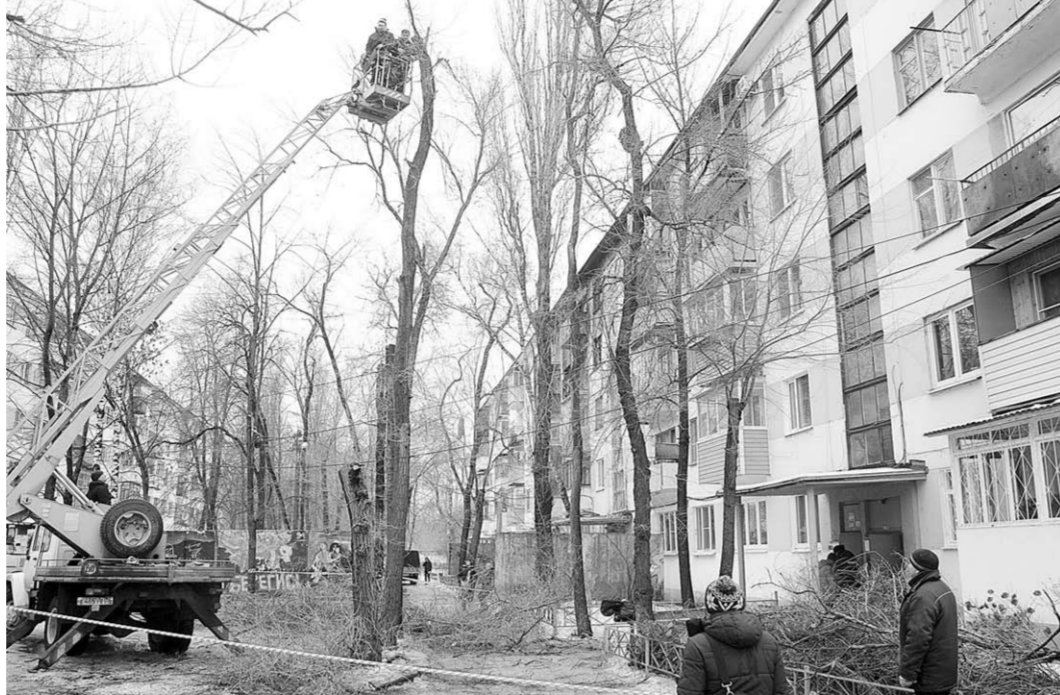
За деревьями – квартиры третьего подъезда, где бушевал пожар.

Спустя несколько дней после пожара его следы ещё очень заметны. На внешних стенах – чёрные пятна, которые оставили языки пламени. Вместо стёкол на окнах натянута плёнка. Вокруг дома – яркая лента, ограничивающая доступ к дому. Стоит машина Службы спасения. С вышки рабочий бензопилой режет ветви и ствол высокого дерева. У подъезда – полицейский. То тут, то там стоят небольшие группы людей – жильцы соседних домов, переживающие за своих соседей.