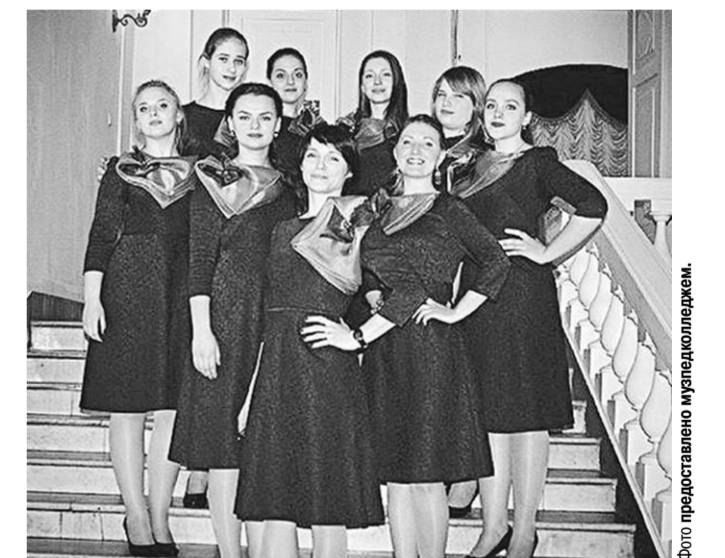
Участницы ансамбля «От классики до джаза».

Вокальный ансамбль Воронежского музыкально-педагогического колледжа «От классики до джаза» стал лауреатом и занял второе место в международном конкурсе «Песни над Невой».