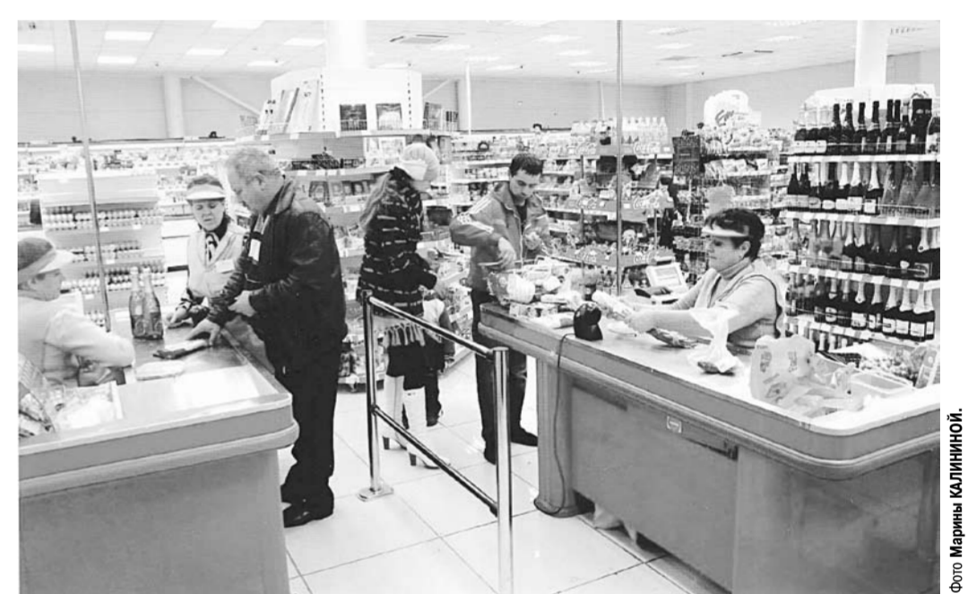
Современные магазины потребкооперации не уступают крупным торговым ритейлерам.

процента оборота розничной торговли потребкооперации, причём среди покупателей – в основном население с низкими доходами, пенсионеры. Треть магазинов расположена в малонаселённых и труднодоступных поселениях. И пусть подобное нерентабельно и никак не оправданно с коммерческой точки зрения, но наши кооператоры продолжают работать себе в убыток, организуя выездную торговлю. Государство, к слову, не оказывает никакой поддержки. Напротив – некоторые недуманные решения ставят нас в очень сложное положение. Как, например, предстоящее введение ЕГАИС – Единой государственной автоматизированной информационной системы, которая в корне изменит систему контроля над производством и продажей спиртных напитков.