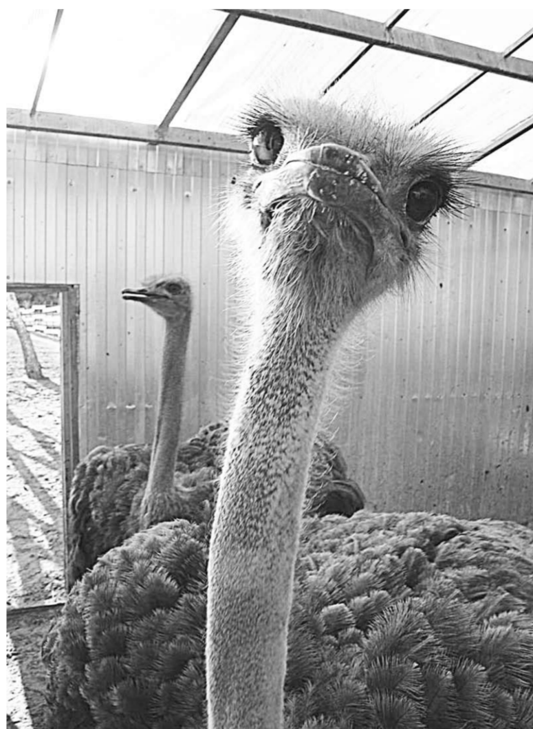
Разведение чёрных африканских страусов и австралийских эму в Воронежской области, похоже, будет свёрнуто.

Тут всё делалось с размахом и на долгие времена. В 2010 году был «нулевой цикл», а вскоре в активах «прописались»: двухэтажное административное здание площадью 450 кв. м, инкубатор и другое оборудование со зданием на 840 кв. м; вольеры огороженные (3,6 тыс. кв. м); скважина глубиной 98 м; трансформаторная подстанция; 10 га земли в собственности