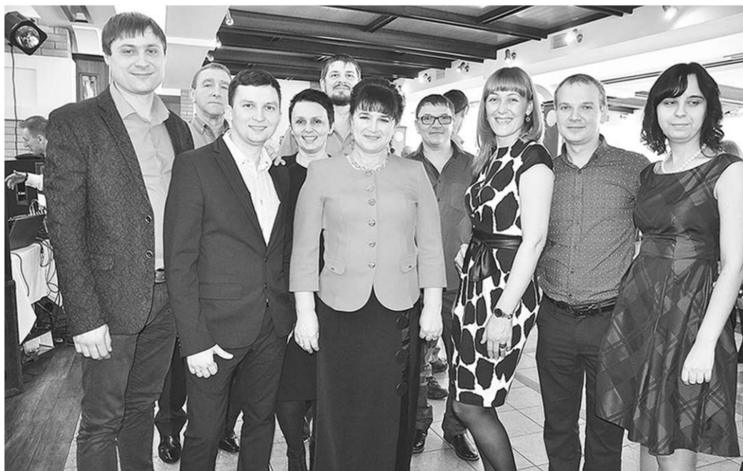
Агрохолдинг гордится своими кадрами.

– Успех любого предприятия решают не деньги и не средства производства, которые, безусловно, необходимы, но недостаточны. Успех дела зависит от количества людей, способных двигать его вперед – своими талантами, мастерством и способностями