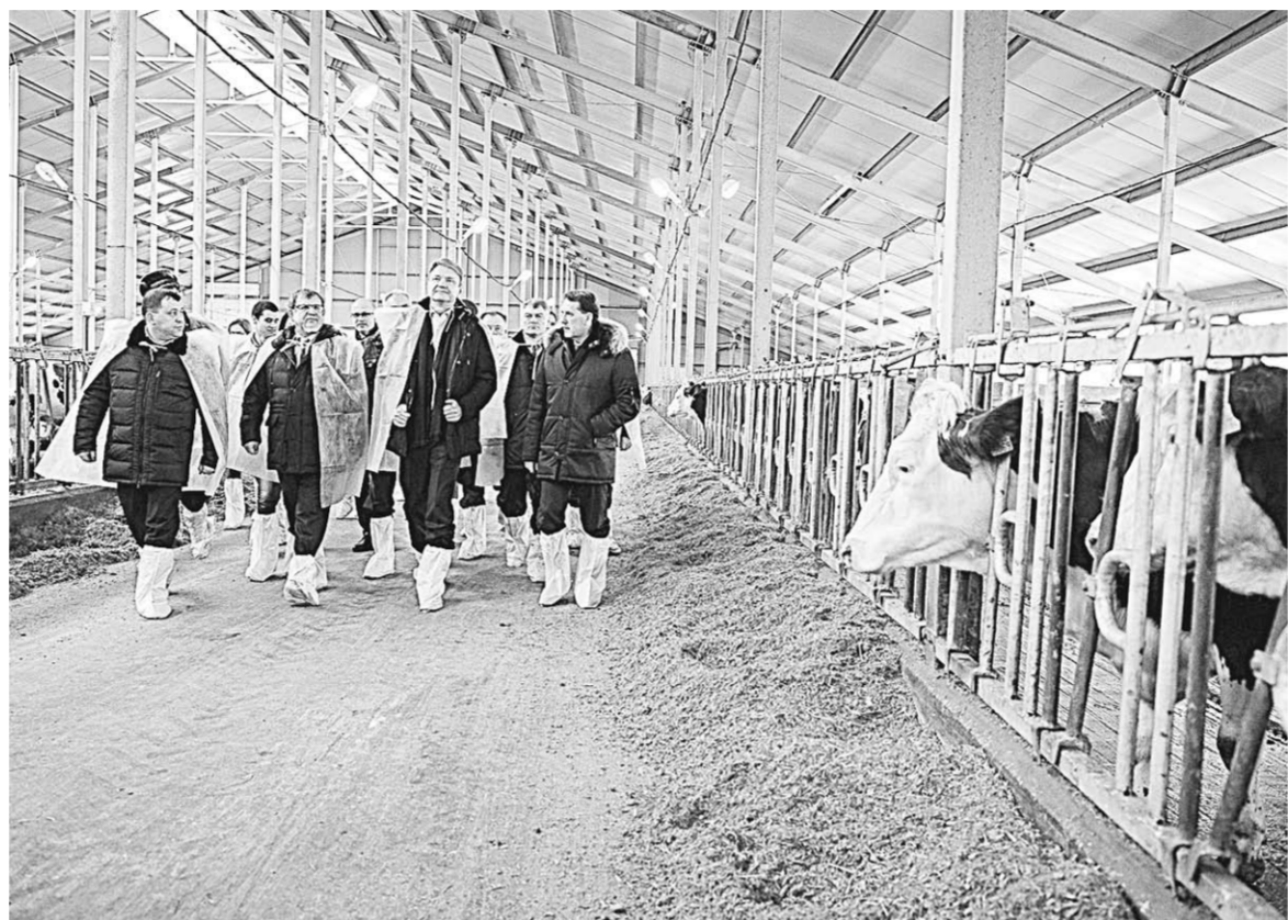
Алексей Гордеев и Александр Ткачев знакомятся с молочным производством ООО СХП «Молоко Черноземья».

При выходе на проектную мощность на комплексе будет производиться 40 тысяч тонн молока в год.