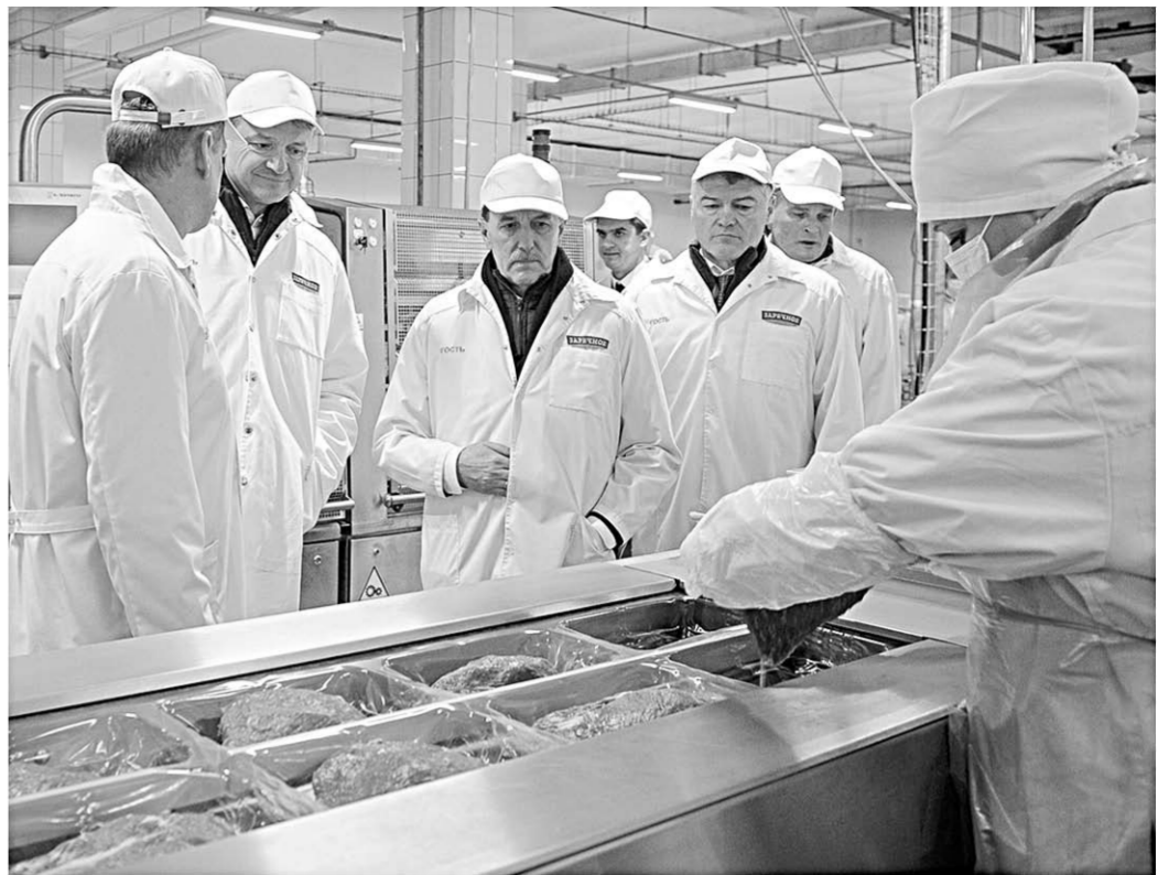
Гости осматривают готовую продукцию в одном из цехов ООО «Заречное».

Самое большое поголовье содержится в сельскохозяйственных предпри-