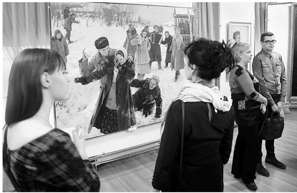
На выставку приходит много молодёжи.

общает подготовленный к открытию выставки пресс-релиз. И всё же у Михаила Лихачёва заметно стремление если не преодолеть «формат», то по-своему его интерпретировать. Понятно, что некоего нового видения требовала и хрущёвская «оттепель», но и сам ху-