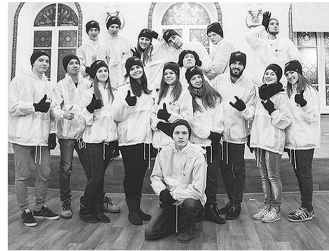
Представители «Снежного десанта» перед поездкой в Рамонский и Поворинский районы.

Студенческие отряды Воронежской области впервые принимают участие в патриотической акции «Снежный десант», которая стала доброй традицией для большинства студенческих отрядов России.