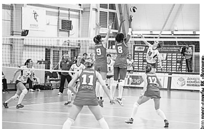
Волейболистки «Уралочки» (на переднем плане) не оставили ВК «Воронеж» ни единого шанса на успех.