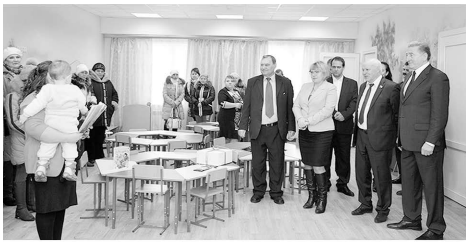
В Перлётке праздник – открывается долгожданный детский сад.