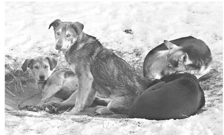
В эти зимние дни собаки греются на тех местах, где проходит теплотрасса.