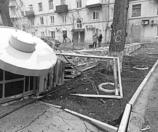
Вот такая картина предстала после падения крана.

Это фото с места происшествия появилось в соцсетях. На снимке видно, что ещё несколько метров – и стрела крана взрывается бы в стену дома.