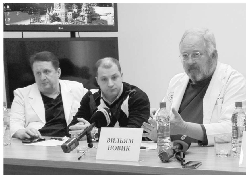
Проект «Детское сердце» в Воронеже продолжается.