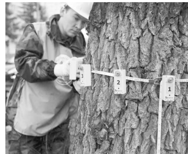
Специалисты исследуют «здоровье» деревьев.

В Воронеже проводятся работы по выявлению внутренней гнили деревьев на улице Кольцовской. Такое внимание к проблеме объясняется тем, что в последнее время участились случаи облома крупных ветвей, а это представляет опасность для людей, коммуникаций и автотранспорта.