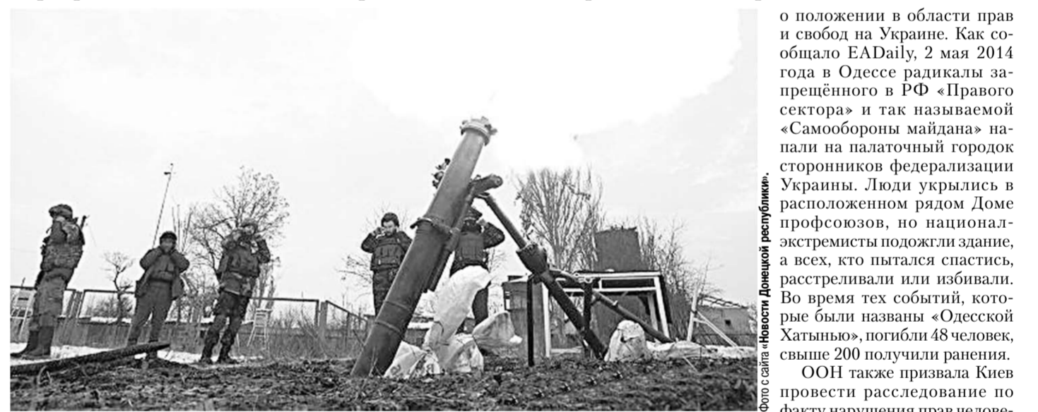
Украинские силовики обстреливают из миномётов село Жабичево и Минеральное к северу от Донецка.

Давайте посмотрим, на каком фоне звучат эти агрессивные заявления. Председатель Еврокомиссии Жан-Клод Юнкер исключил возможность вступления Украины в ЕС в ближайшие 20-25 лет. Об этом сообщила РИА «Новости». Заявление сделано как безоговорочный и очевидный всеми факт. Также высокопоставленный еврокомиссар отметил, что шанс вступления Украины в НАТО тоже исключен. В 2014 году Киев и ЕС подписали Соглашение об ассоциации. С этого года вступила в силу часть договора по свободной торговле между Украиной и ЕС. Однако, по словам представителей Евросоюза, это Соглашение не является абсолютно никакими гарантиями на вступление Украины в ЕС, подчёркивает сайт телеканала «Звезда».