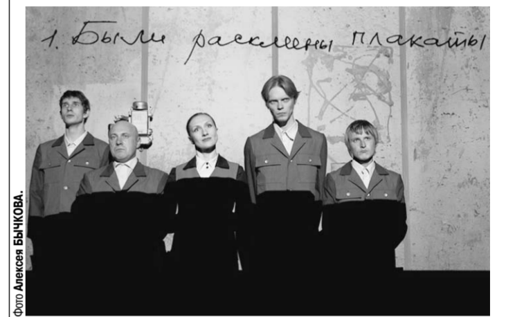
Сцена из спектакля «Ак и человечество».

Рассказ Ефима Зозули, положенный в основу спектакля, написан в 1919 году, когда ужасающая идея избавления от «человеческого хлама» была весьма актуальной. Родившись ещё в XVIII веке во времена якобинского террора во Франции, она пришла в советскую Россию, фашистскую Германию, а во второй половине XX века — в маоцздунский Китай и полтвовскую Камбоджу, лишив жизни миллионы ни в чём не повинных людей. Об этом написано много и подробно, ярче всех, вероятно, Андреем Платоновым в «Чевенгуре», но литература и театр постоянно возвращаются к этой теме. И правильно делают, ибо одно из свойств искусства — побудить человека размышлять об увиденном, сопоставлять и анализировать.