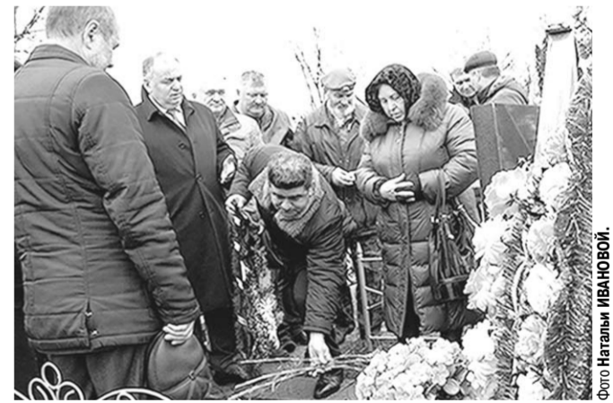
Цветы — отважному воину.

Шестнадцать лет прошло со дня бессмертного подвига воинов-десантников 6-й парашютно-десантной роты 104-го десантно-штурмового полка 76-й Псковской десантно-штурмовой дивизии.