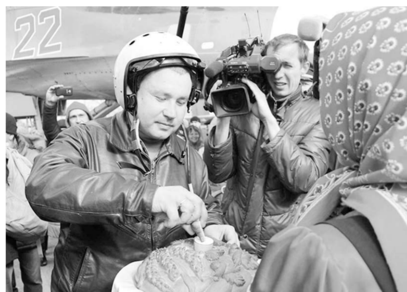
Тёплая встреча на воронежской земле лётчиков, вернувшихся с выполнения военной операции в Сирии.

завершением поставленной боевой задачи. Вы ещё раз доказали всему миру – выучка лётчиков Воздушно-космических сил находится на самом высочайшем уровне, – сказал главнокомандующий. – Вы с честью и достоинством выполнили ответственную миссию, и на нас мирные жители и граждане Сирии никогда обижаться не будут.