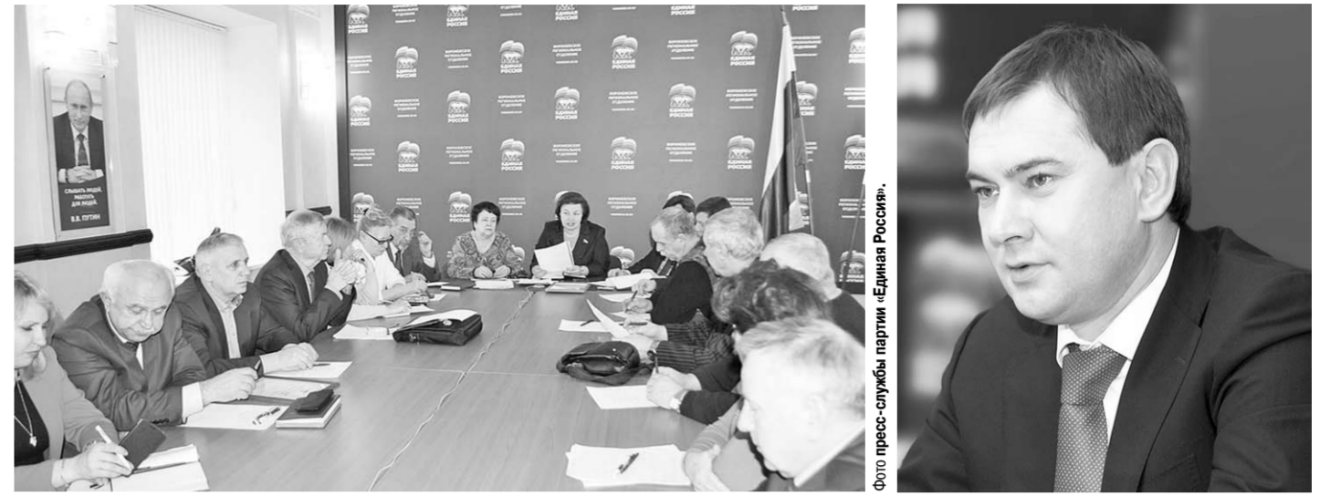
Воронежские общественники в ходе встречи высказали конкретные пожелания.

Большое счастье видеть перед собой пример независимого творческого