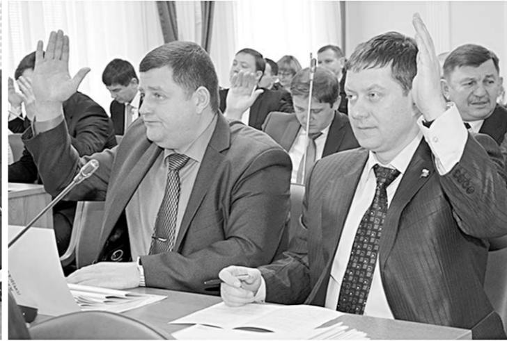
По обсуждаемым вопросам – единогласие.

Депутаты на законодательном уровне согласовали создание муниципального бюджетного учреждения городского округа город Воронеж «Туристско-информационный центр Воронежа». Эта структура займется не только продвижением Воронежа в части инвестиционной привлекательности на внутреннем и внешнем туристических рынках, но и будет осуществлять информационную деятельность: администрирование и продвижение туристического информ-портала, выпуск имиджевых печатных и электронных изданий, развитие детско-юношеского туризма, проведение инфотуров различной тематики.