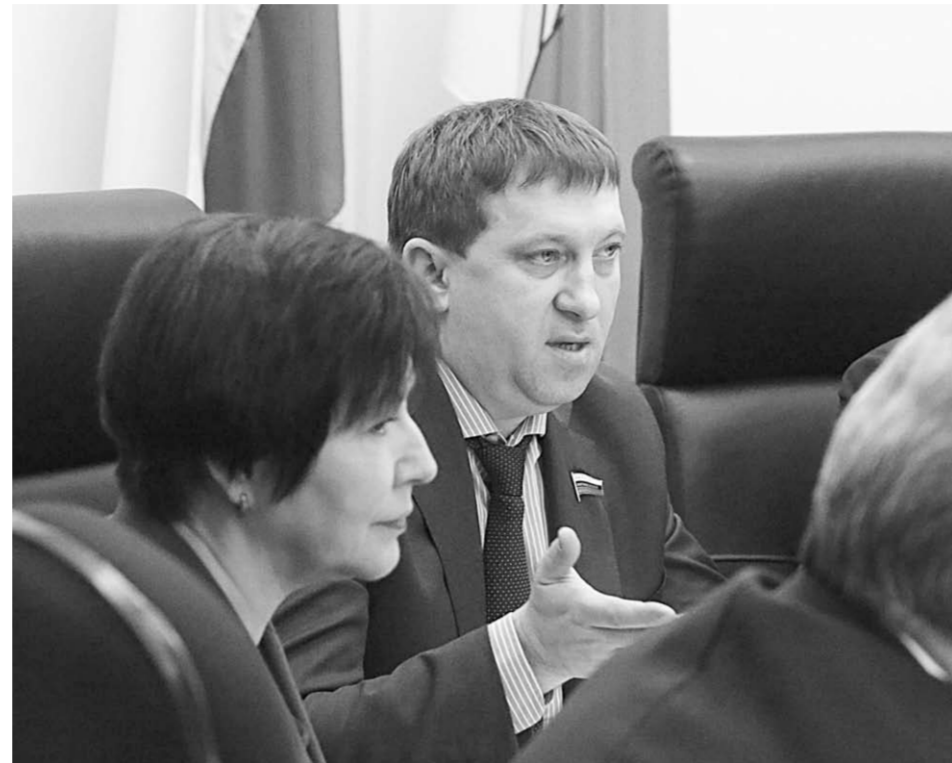
Председатель Комитета по местному самоуправлению, связям с общественностью и средствам массовых коммуникаций Роман Жогов.

Актуальная тема | Продолжается приём заявок на региональный конкурс проектов территориального общественного самоуправления в 2016 году