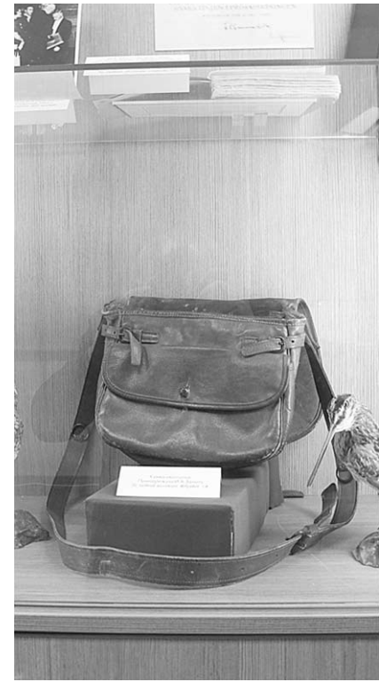
Охотничья сумка, принадлежавшая писателю.