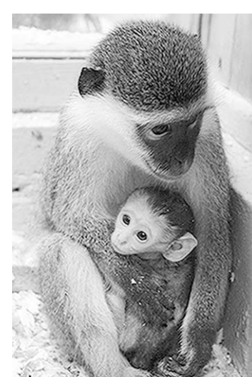
Под надёжной защитой мамы.

Очаровательный детёныш появился на свет 14 марта. Ему очень рада «семейная пара» зелёных мартишек в Воронежском зоопарке имени А.С.Попова.