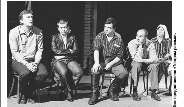
Сцена из спектакля «Пустодушие».

Воронежский «Театр равных» показал своё «Пустодушие» на сцене Волгоградского молодёжного театра.