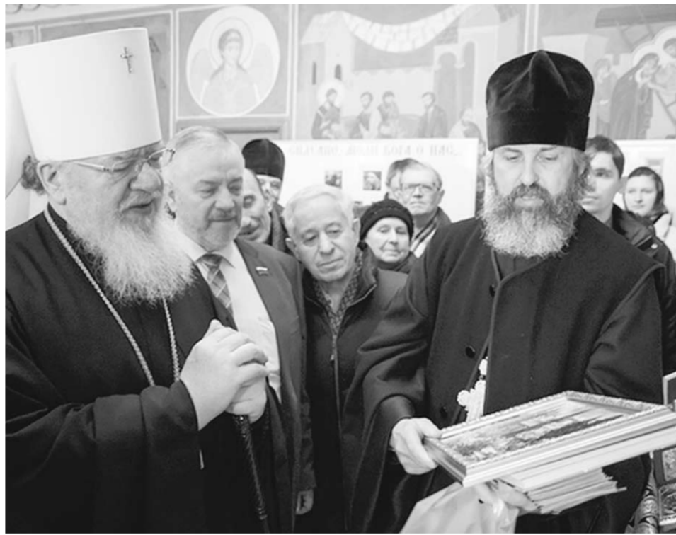
Фотовыставку открыл митрополит Воронежский и Лискинский Сергей.

Православие | Фотовыставку под таким названием открыл 25 марта, в День независимости Греции, митрополит Воронежский и Лискинский Сергей