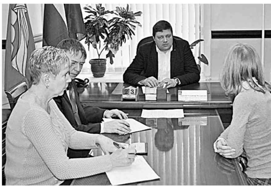
«Единая Россия» помогает решать вопросы, волнующие воронежцев.

— Мой участок находится в конце улицы в низине. Чтобы грязь и вода не стекали ко мне во двор, я отгораживал дорожку бордюром. В 2013 году при расширении полотна рабочие демонтировали камень и вывезли. Теперь к дому невозможно подойти. Вот уже третий год пытаюсь добиться установки бордюра обратно, — обратился к депутату местный житель.