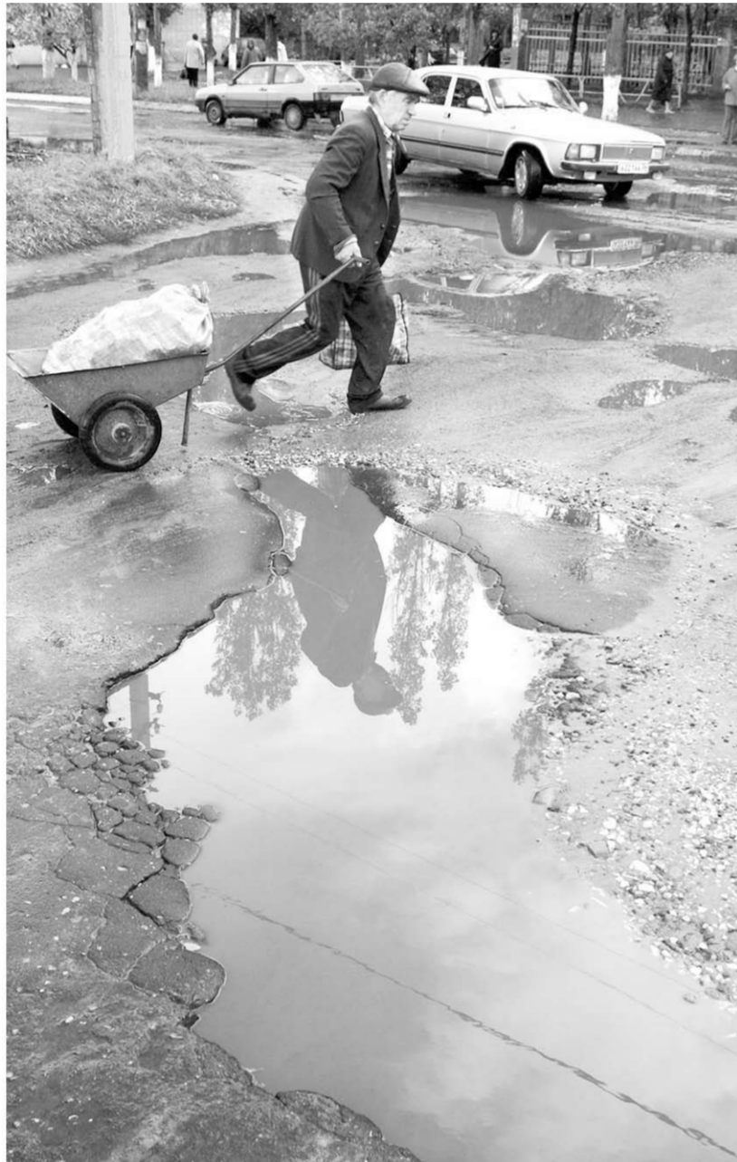
Сорок три процента воронежцев уверены, что неудовлетворительное состояние дорог – одна из главных причин ДТП.

Состояние наших дорог, как известно, удручающее, а количество ДТП столь велико, что ежегодно страна теряет население небольшого города. Поэтому не удивительно, что Президент Владимир Путин вынужден был провести в Ярославле заседание президиума Госсовета по проблемам безопасности дорожного движения. А проблемы эти застарелые и укоренившиеся.