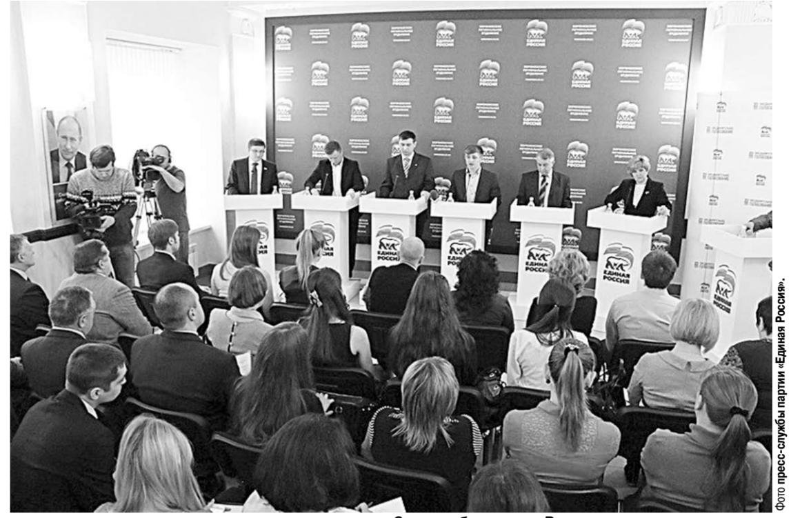
Старт дебатам дан. Впереди – жаркие дискуссии.