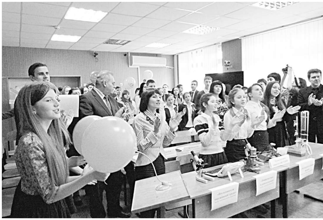
Кантемировские ребята приветствуют своих сверстников-крымчан.