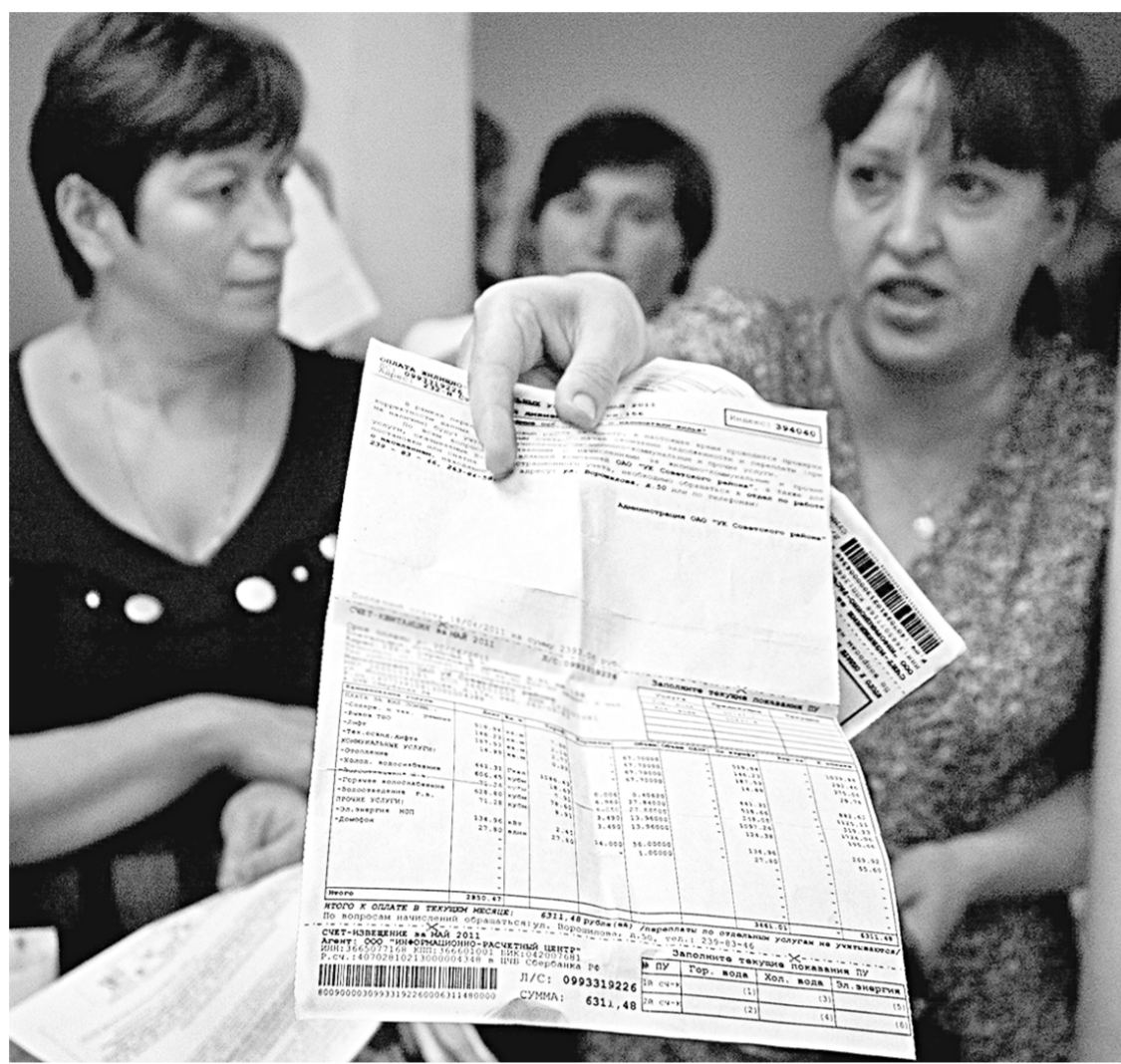
Качество и стоимость услуг ЖКХ не удовлетворяют многих жителей многоквартирных домов.

Увы, экономический кризис отразился на каждой семье. И если с продовольственными продуктами, одеждой и обувью мы вольны выбирать — покупать сейчас или повременить, прицениться, взять меньше или дешевле, сэкономить — вместо бренда приобрести дешёвый аналог, то с услугами ЖКХ всё обстоит куда сложнее. Здесь счётчик работает, и время поджимает — будь добр, оплати квитанции вовремя и в полном объёме.