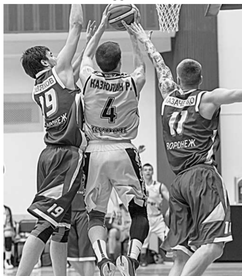
Упорное противостояние воронежских и курских баскетболистов завершилось в пользу «Русичей».

Баскетбольный клуб «Согдиана-СКИФ» и в этом сезоне останется без наград. Это стало известно после того, как воронежцы не смогли пробиться в полуфинал. Шлагбаум на пути «скифов» поставили курские «Русичи».