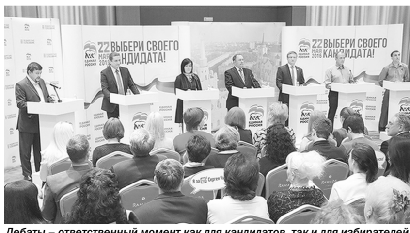
Дебаты – ответственный момент как для кандидатов, так и для избирателей.

По регламенту каждый выступающий имел возможность в течение двух минут рассказать о себе, а также высказать свою точку зрения по заявленной теме. Вместе с избирателями на площадке присутствовали группы поддержки участников предварительного голосования, которые задали свои вопросы по обсуждаемой теме. Интересно, что для участия в дебатах в Панино приехали жители четырёх ближайших районов Воронежской области. Их