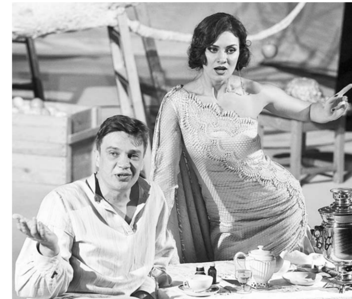
Игорь Ткачёв в спектакле «Касатка».

– Хотелось выразить восхищение воронежским зрителем, – признался главный режиссёр театра драмы имени М.С.Щепкина, актёр Игорь Ткачёв. – Мы вышли на сцену – и почувствовали, что она нас прощупывает. В Воронеже публика искушенная! И Платоновский фестиваль, и театральная жизнь вашего города воспитали зрителя тонко чувствующего.