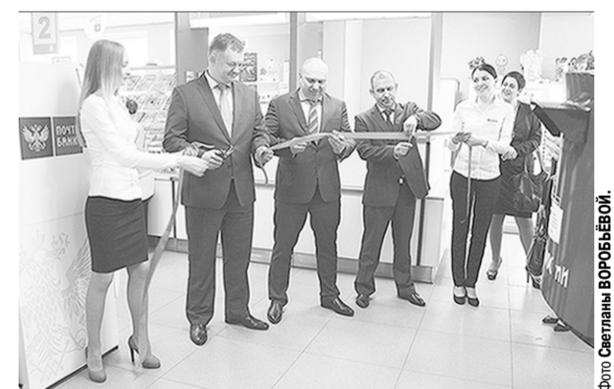
Открытие первого офиса «Почта Банка».

В Воронеже в почтовом отделении №77 на улице Генерала Лизюкова открылся первый офис «Почта Банка».