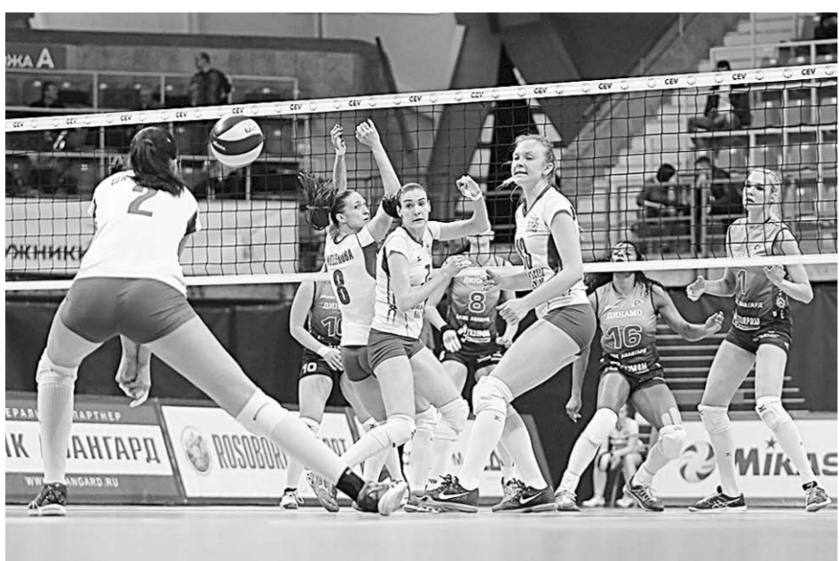
Воронежские волейболистки завершили сезон на мажорной ноте.