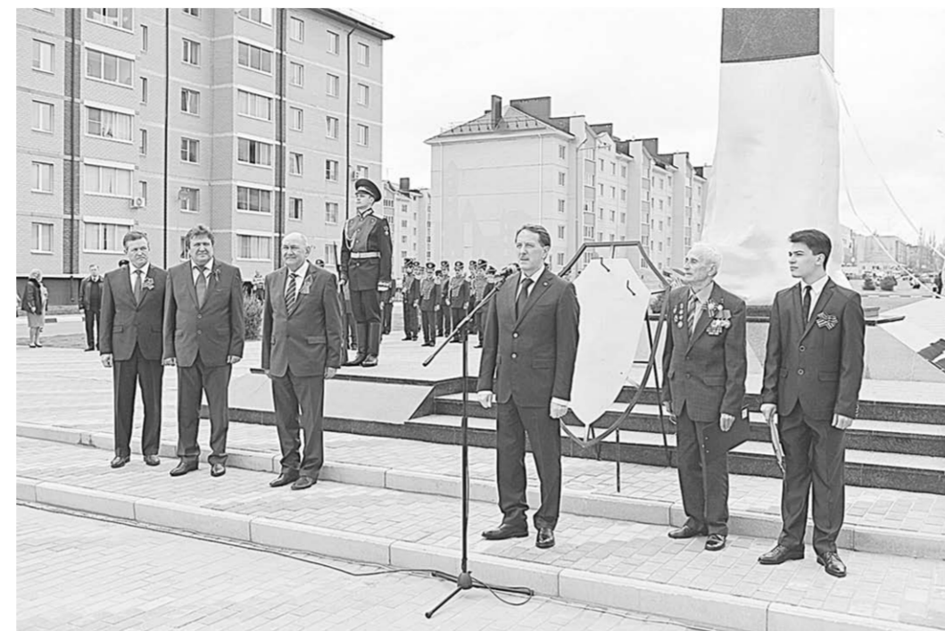
Губернатор Алексей Гордеев благодарит ветеранов на открытии стелы «Населённый пункт воинской доблести».

Власть | Сдать все строящиеся важные объекты к декабрю нынешнего года – такую задачу в ходе своей рабочей поездки в Лиски озвучил губернатор Воронежской области Алексей Гордеев