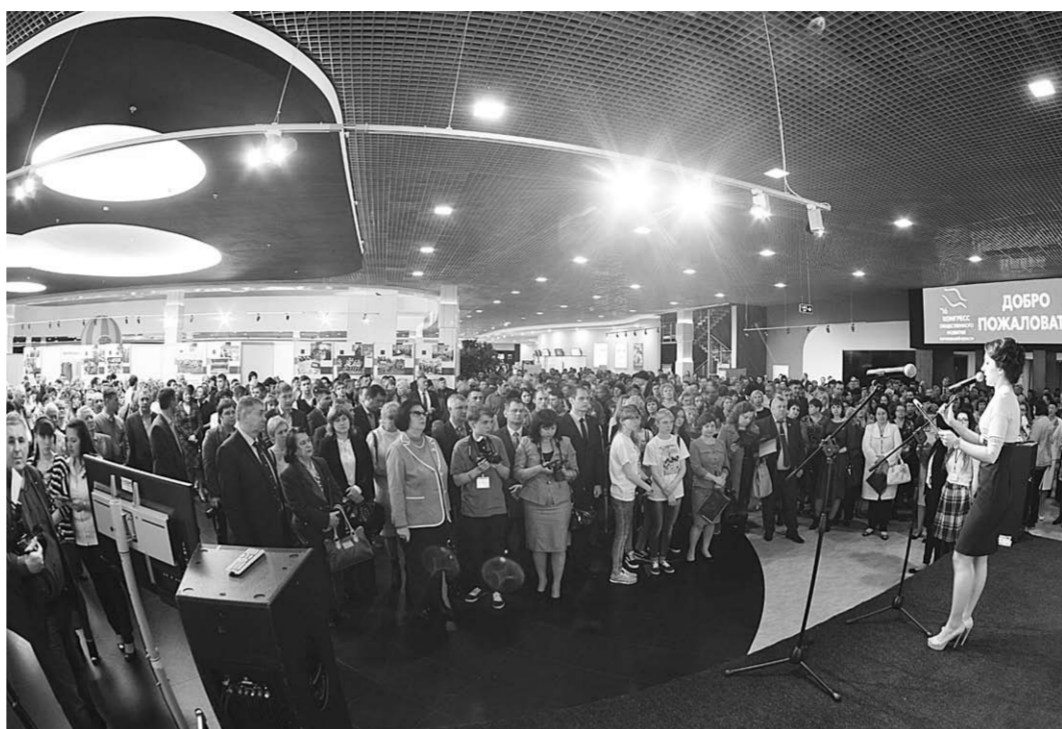
На площадках конгресса получали новые знания, делились опытом.

Общественники стали главными фигурами конгресса. Семинары, лекции, «круглые столы» – все формы взаимодействия выдвигали на первый план активных представителей некоммерческих организаций, волонтерских обществ, ТОСов. Рабочие площадки конгресса посетил губернатор Алексей Гордеев. Глава региона включился в дискуссию по теме «Механизмы взаимодействия муниципальных общественных палат с местными сообществами». – Сегодня рассматривается много направлений привлечения инвестиций в экономику, – сказал Алексей Гордеев. –