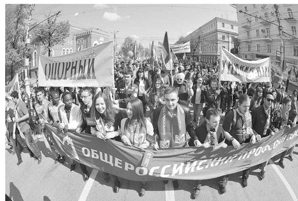
Защита интересов человека труда – главный лозунг Первомая.

Праздничную колонну, которая проследовала от площади Победы вдоль проспекта Революции до площади Никитина, возглавил губернатор Алексей Гордеев. Рядом с ним шли главный федеральный инспектор по Воронежской области Александр Солодов, мэр Воронежа Александр Гусев,