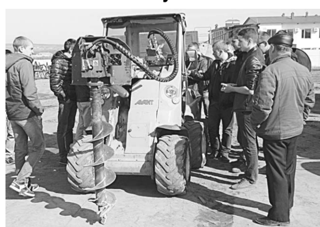
Машины к работе готовы.

В Кантемировском ДРСУ состоялся показательный технический осмотр самоходных машин и других видов техники. Представили её ДРСУ и «ЦА АПК» филиал «Кантемировский».