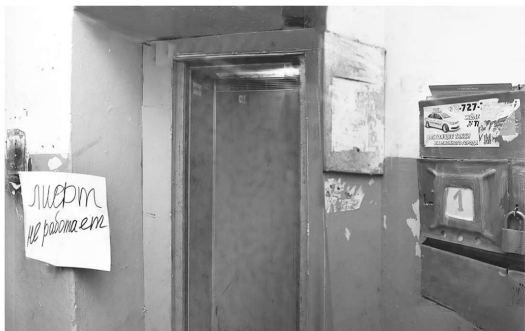
Из почти 6,5 тысячи лифтов в воронежских многоквартирных домах треть выработала свой ресурс.

«Управляющая компания Железнодорожного района» не соблюдали установленные законодательством и договором управления многоквартирным домом обязанности по обеспечению содержания лифтов в исправном состоянии. Значительное количество лифтов уже отработали установленный 25-летний срок службы, однако проведение оценки их соответствия установленным требованиям организовано не было. Не приняты меры по установке ограждений на порталы дверей кабин и шахт лифтов. Допускались протечки атмосферных осадков на электрооборудование лифтов. Всё это могло стать причиной аварий, несчастных случаев и травмирования жильцов. По результатам проверки прокуратура возбудила дела об административных правонарушениях, предусмотренных ч. 1 ст. 14.43 КоАП РФ (нарушение исполнителем требований технических регламентов). Арбитражный суд Воронежской области удовлетворил прокурорские требования о признании управляющих компаний виновными в нарушении законодательства в сфере обеспечения безопасности внутридомового лифтового оборудования. При этом представлены документы, подтверждающие устранение выявленных при проверке нарушений, информирует прокуратура Воронежской области.