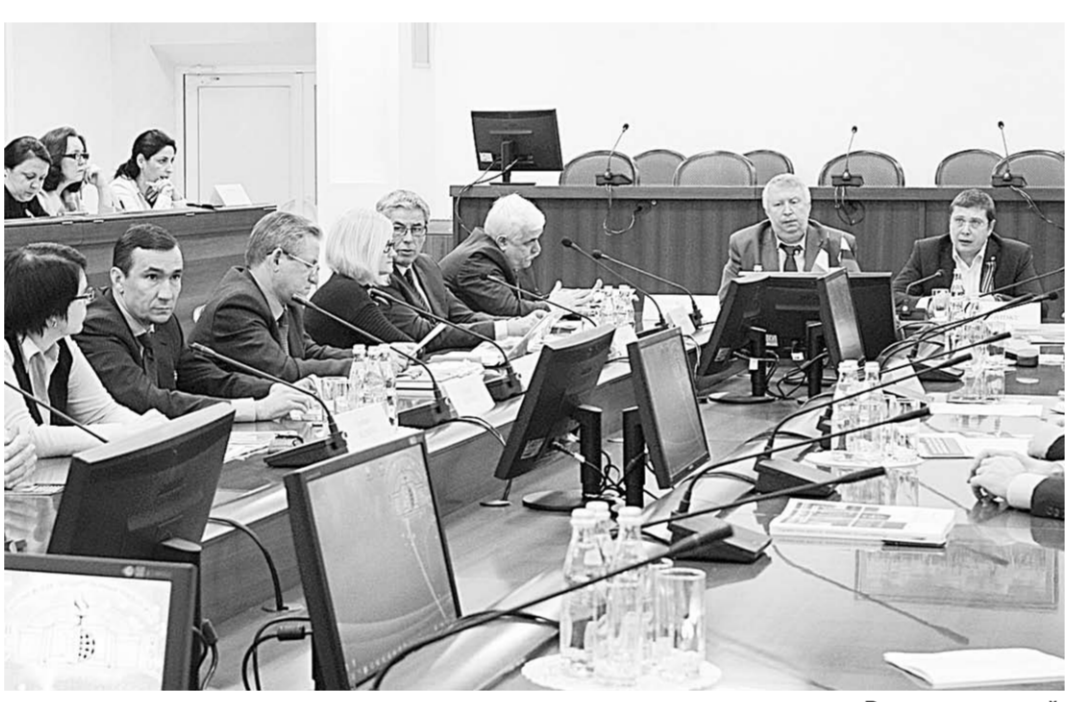
В зале заседаний.

контактов, знать его потребности и проблемы. Очень важно решать кадровую проблему. Так, по инициативе губернатора на базе Торгово-промышленной палаты создан Центр делового образования, и в плане подготовки специалистов нашим стратегическим партнером является ВГУ. – Несмотря на санкции, международные связи между Францией и Россией только крепнут, климат взаимоотношений теплеет, – поделился своими размышлениями советник по внешнеэкономическим вопросам при правительстве Франции, президент Международной комиссии MEDEF Шампань-Арденны Филипп Вербер.