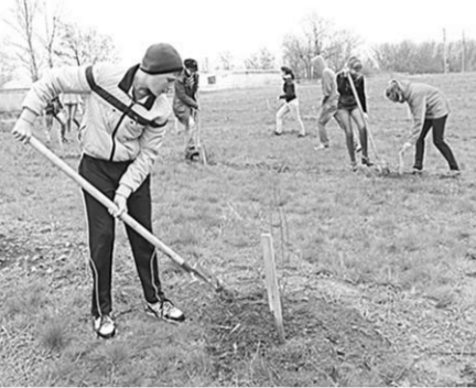
Школьники из Новомарковки высадили новые саженцы в Лес Победы.

Специалисты всех отделов администраций Кантемировского района, городского и сельских поселений в ходе субботника навести порядок в лесополосах, прилегающих к трассам на въезде в райцентр и населённым пунктам.