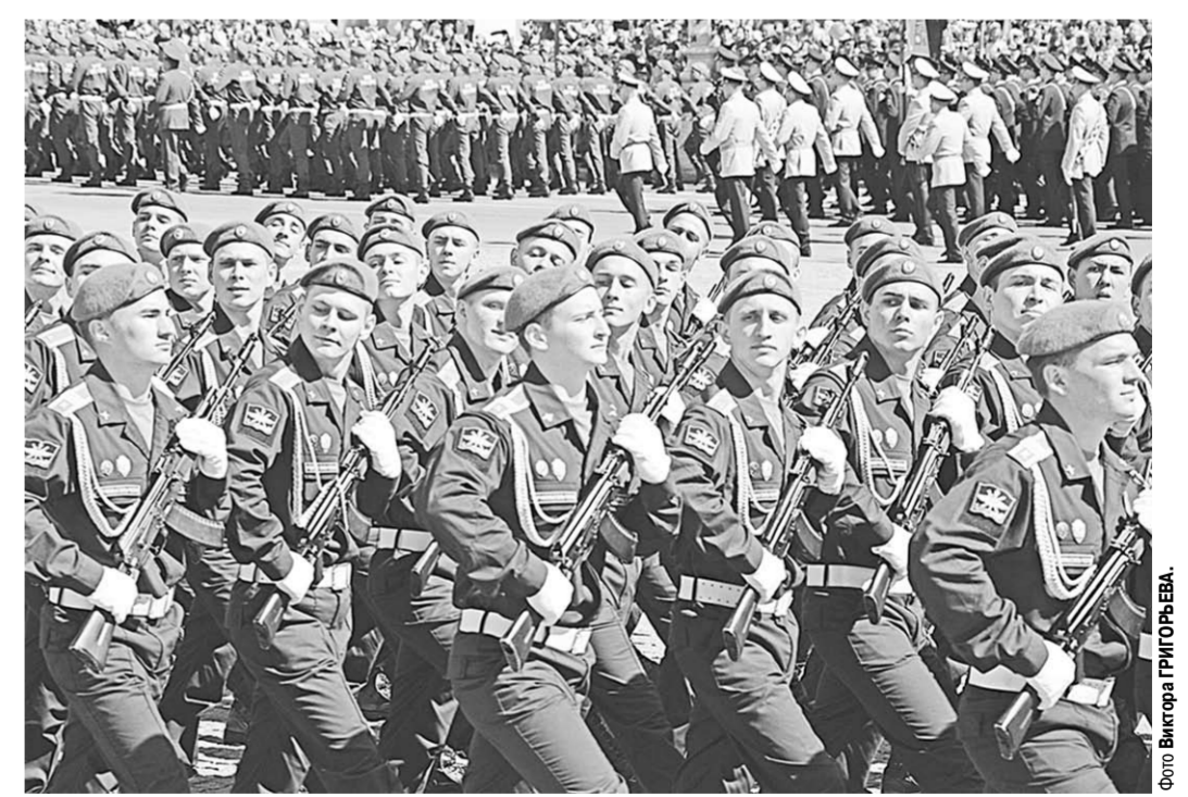
По традиции 9 Мая в Воронеже пройдёт военный парад.

ведение возложения венков и цветов ко всем братским могилам и воинским захоронениям. Кроме того, впервые в обновлённом Воронежском центральном парке пройдут обширные культурная и спортивная программы. На Никитинской площади под открытым небом будет показан спектакль театра драмы имени А.В. Кольцова «Ворон – песни войны».