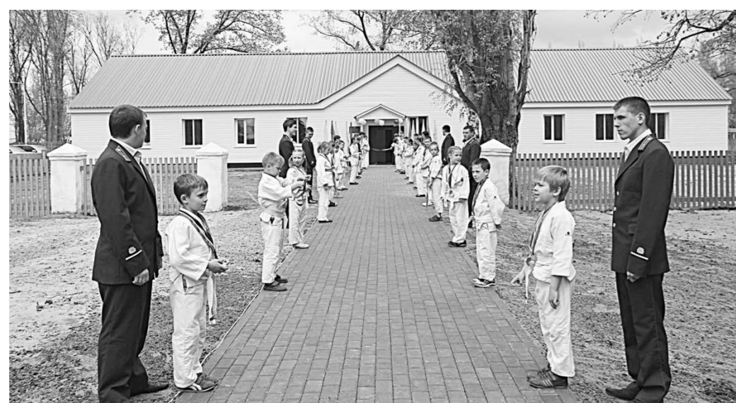
Торжественные минуты открытия детско-юношеской школы по дзюдо.