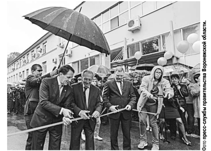
Алексей Гордеев и руководители предприятия разрезали символическую ленту, дав старт отправке машин.

Вчера ЗАО «Воронежстальмост» отгрузило первые четыре балки пролётных строений Керченского моста.