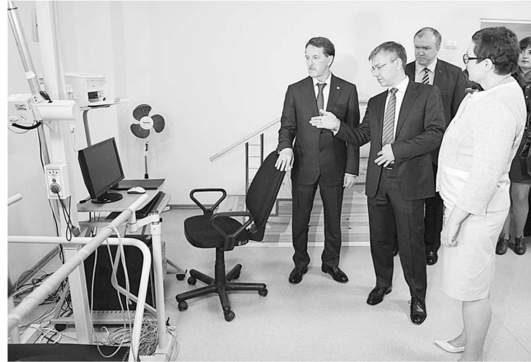
Комплекс для искусственной коррекции движения заработает уже в ближайшее время.

Общество | Идея сделать среду доступной и удобной для всех категорий объединяет два разноплановых учреждения — областной Центр реабилитации детей и подростков с ограниченными возможностями «Парус надежды» и Многофункциональный центр предоставления государственных и муниципальных услуг