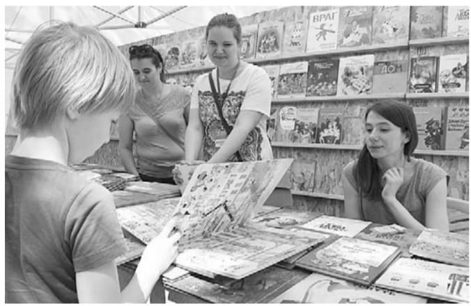
На книжной ярмарке можно увидеть литературу для всех возрастов.