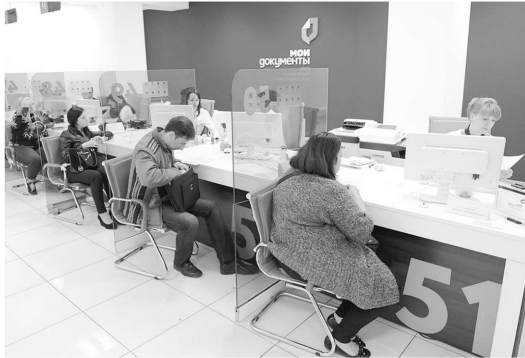
В Воронежской области завершено создание сети МФЦ.