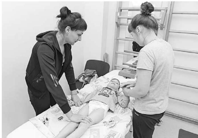
Уже более 600 детей-аутистов получили помощь в «Парусе надежды».