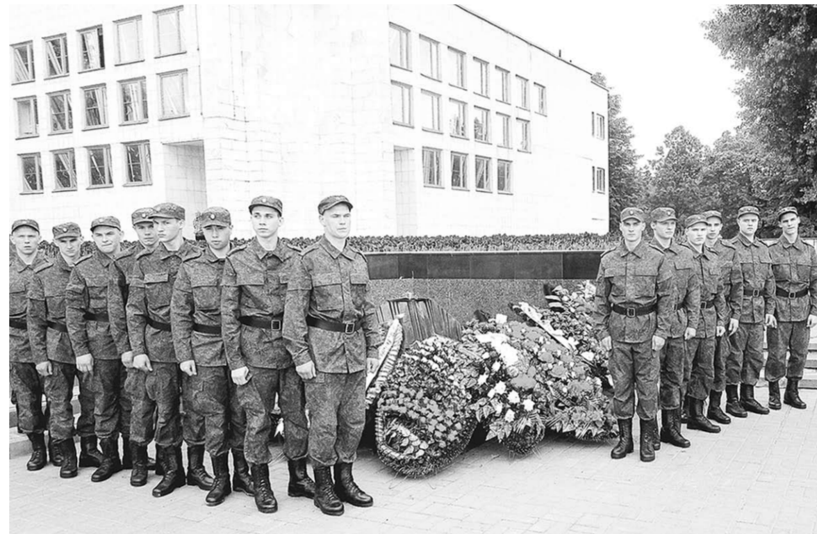
Перед отъездом в Москву призывники почтили память защитников Воронежа.

– Кремлёвцем стать непросто. В полк берут молодых людей с безупречной биографией, в которой нет места уголовному прошлому, и уж тем более – судимости. Помимо отличного здоровья, приятной внешности и роста не ниже 175 сантиметров новобранцы должны иметь образование не ниже законченного среднего. Без шрамов и крупных татуиров-