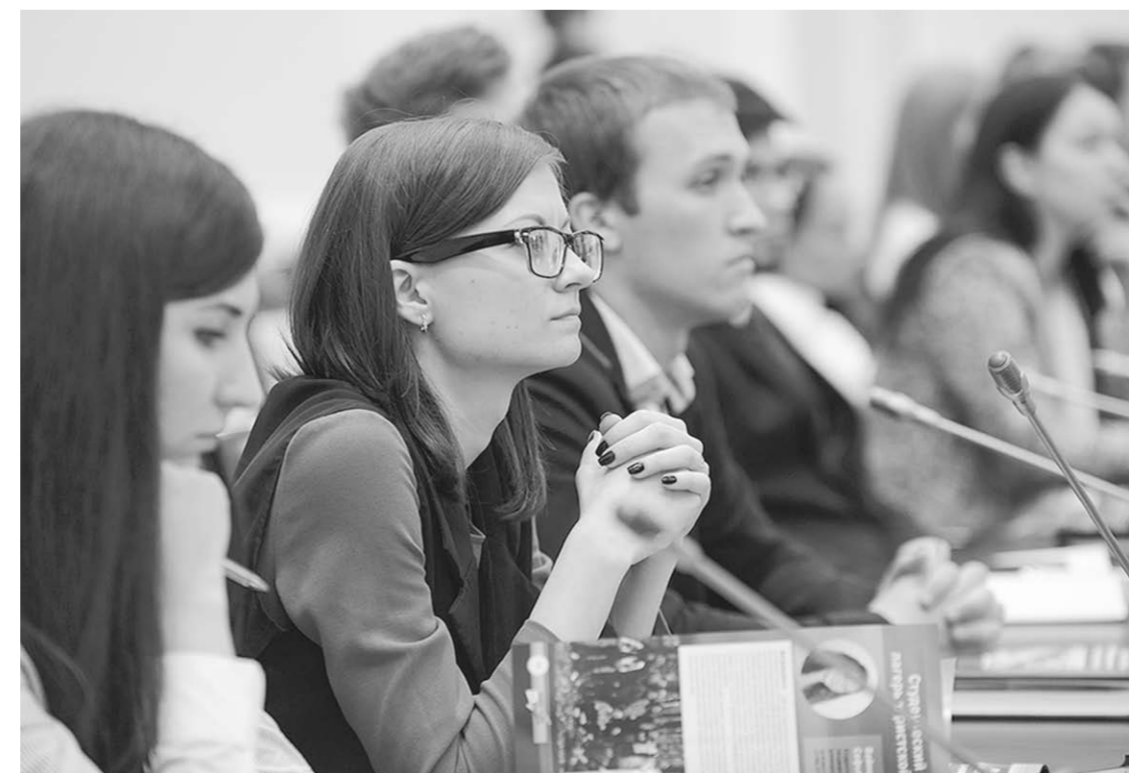
Программа молодёжного форума в Воронеже была насыщенной и познавательной.

Об этом сообщили на открытии Всероссийского съезда молодёжных правительств, заседание которого впервые за пять лет переехало из Москвы в столицу Черноземья.