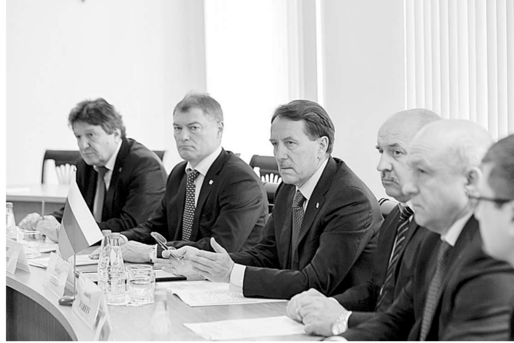
Губернатор Алексей Гордеев приветствовал укрепление экономических отношений между Чешской Республикой и Воронежской областью.

– Завод имеет возможность расширения до 500 рабочих мест. Важно, что он станет новым градообразующим предприятием города Боброва как районного центра. При этом здесь возникает и промышленный кластер, где будут готовиться высококачественные специалисты. Хреновской лесной колледж уже сориентирован с учётом требований компании по подготовке специалистов высокого уровня, рабочих по различным направлениям. В этом смысле может быть перенесён европейский опыт в Бобровский район. Мы здесь задаём не только промышленный уровень, но и интеллектуальный, – подчеркнул Алексей Гордеев.