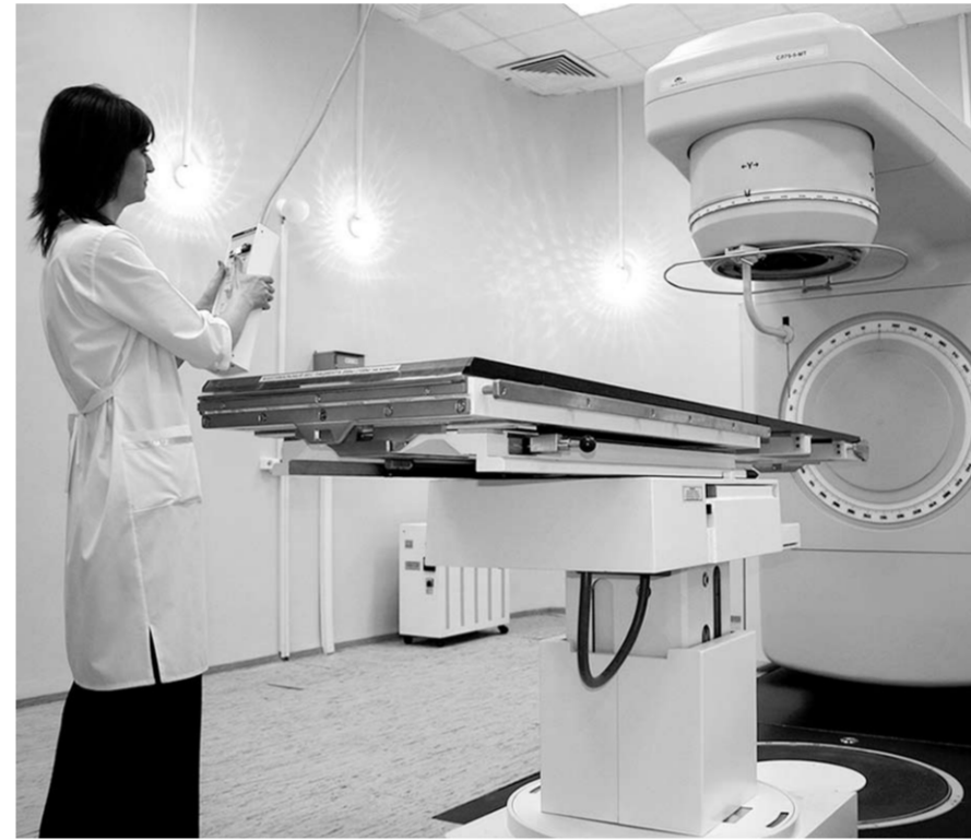
В руках медработников новейшее оборудование. Сможет ли помочь оно всем больным?

Платная система медицинского образования и упразднение обязательного распределения выпускников привели к выпуску тысяч профессиональных недорослей, которые вовсе не стремятся