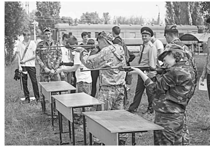
Кто самый меткий?

Два дня на базе Воронежского института ФСИН России проходил первый этап военно-патриотической игры «Орлёнок», участниками которой стали лучшие школьные дружины Воронежа.