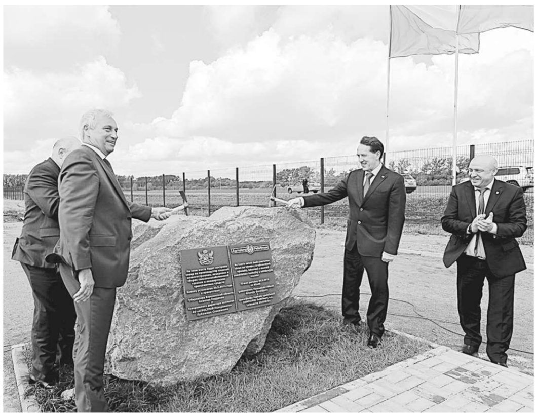
Заложен камень в основание нового завода в Боброве.