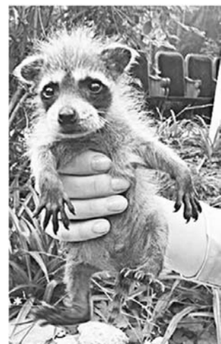
Симпатяга-енот быстро набирает вес.

http://www.kommuna.ru Вчера / 14655 661 За текущий месяц 62480 TWITTER http://www.twitter.com/kommunavnews FACEBOOK http://www.facebook.com/kommuna VKONTAKTE http://www.vk.com/kommunavnews