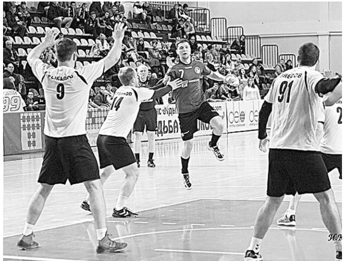
Дальнейшая судьба воронежской «Энергии» овеена пеленой тумана.

«Отмучились» – именно так хотелось озаглавить заметку об итогах выступления гандбольной «Энергии» в чемпионате России сезона-2015/2016.