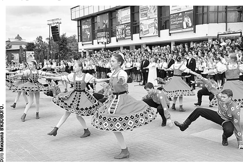
В финале выступил сводный хор и хореографический ансамбль «Радуга».