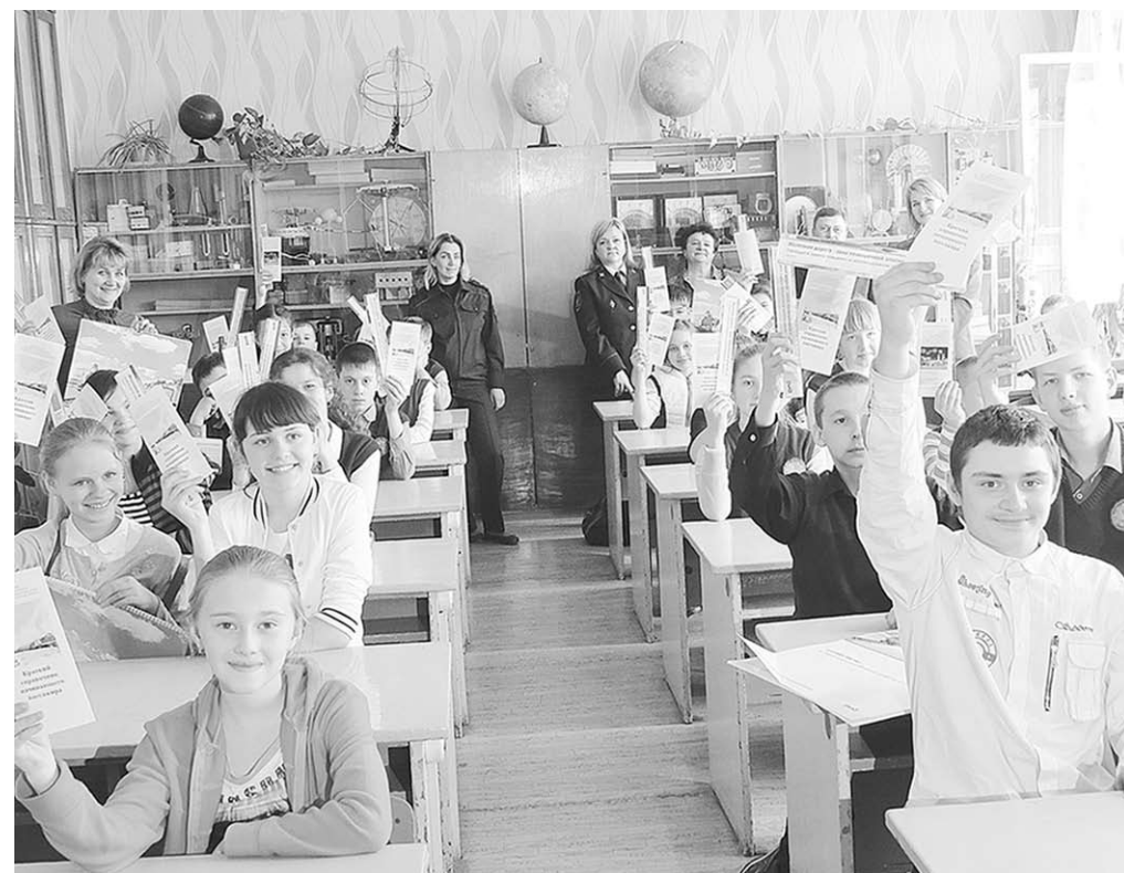
Урок безопасности с «неправильным» мультфильмом и видеороликом вызвал у школьников живой интерес.

ся задумками Мёдова. – Располагая после масштабной реконструкции уникальной технической, информационной и коммуникационной базами, ДЖД может стать региональным центром не только обучения железнодорожным профессиям, но и профилактики детского травматизма, преступности среди подростков, антинаркотической пропаганды. Этому способствуют и добрые деловые связи, установившиеся с сотрудниками транспортной полиции и прокуратуры, отделом образования Лискинского района. Мы готовы проводить совместные и нескучные профилактические акции с детьми и особенно «трудными» подростками из любого района Воронежской области. Побывать у нас в гостях уже успели школьники даже из самого отдалённого региона ЮВЖД – из Мичуринска Тамбовской области.