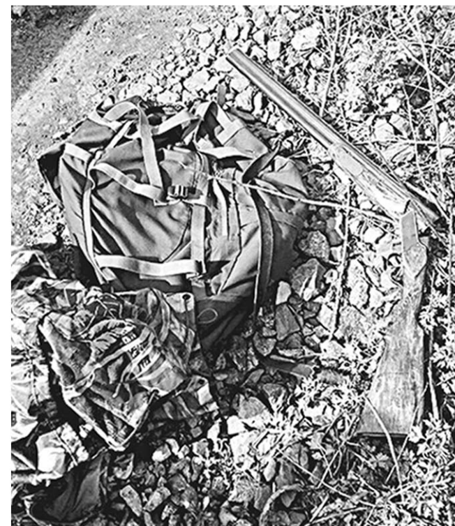
Часть изъятого у браконьеров снаряжения для незаконной охоты.

При помощи радиостанции была передана информация о случившемся старшему государственному инспектору Усманского участка лесничества, который прибыл