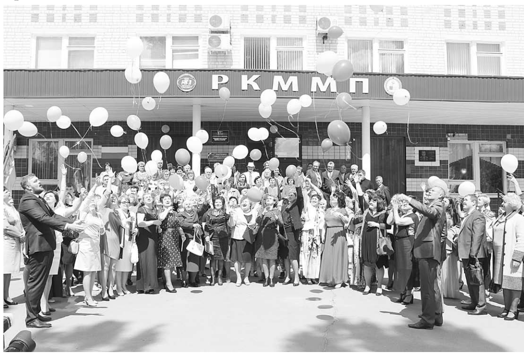
Заключительный аккорд праздника.

Юбилей | Россошанскому колледжу мясной и молочной промышленности исполнилось 85 лет