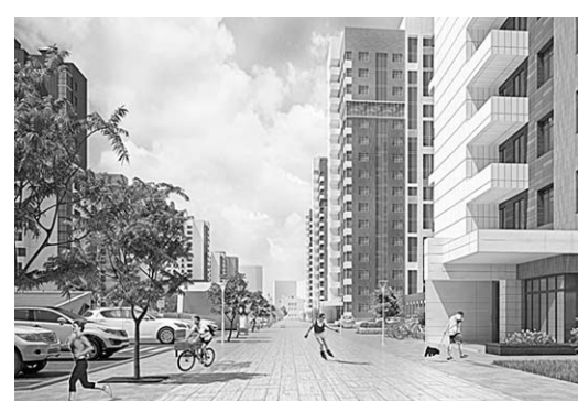
«Современник» вознесётся ввысь на бывших землях завода «Сельмаш», что на улице 9 Января.