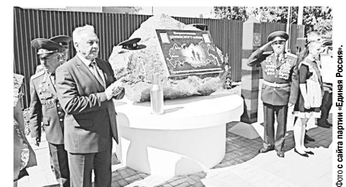
Анинцы свято чтят традиции своих дедов и отцов.