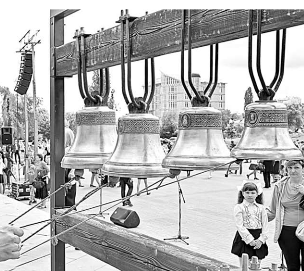
Мелодичный перезвон колоколов стался по площади.