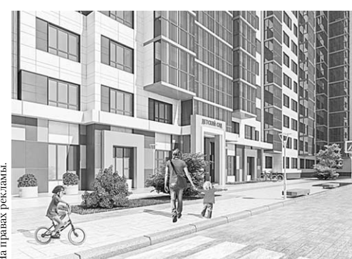
Жилой квартал «Европейский» появится в районе улиц Станкевича и Красных партизан.

Оба проекта предусматривают создание скверов и масштабное озеленение.