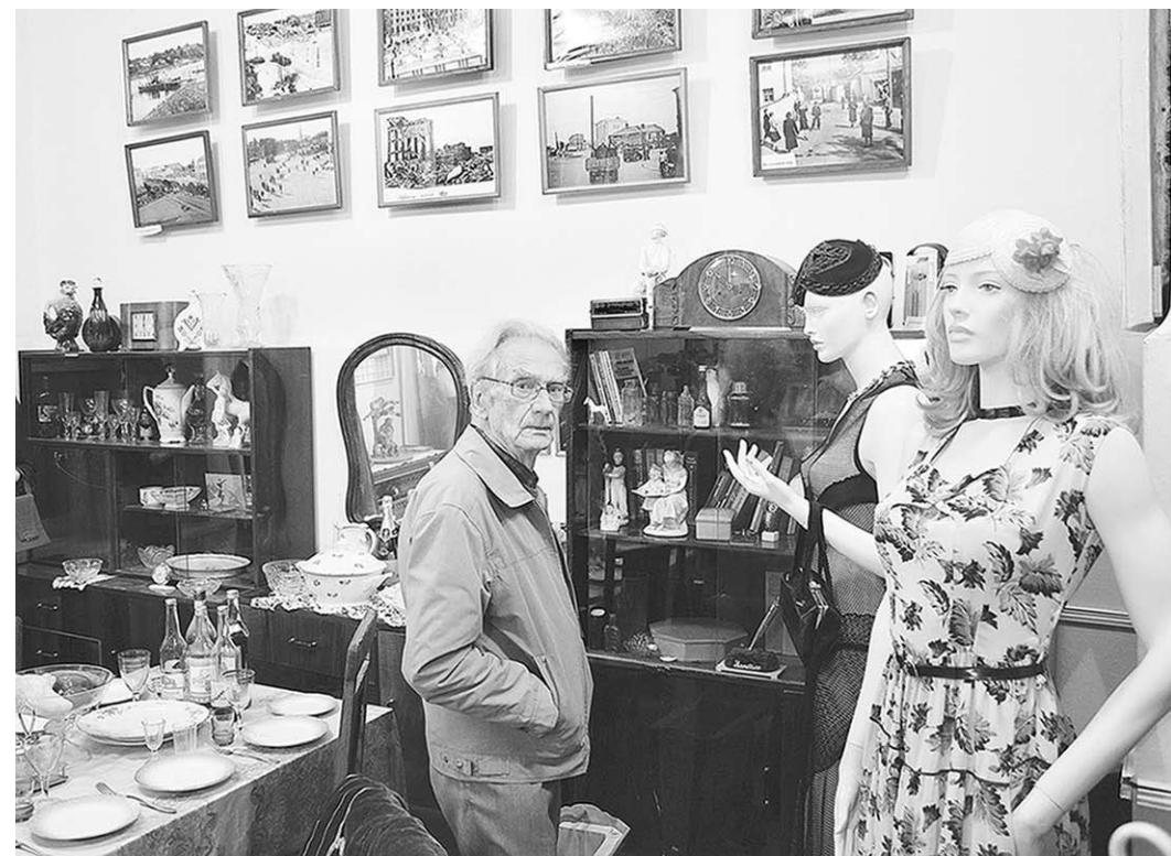
Заглянув в эту комнату, посетитель словно попадает в мир советского человека.

Далёкое – близкое | Информационный центр историко-культурного наследия советской эпохи развернул музейную экспозицию в Советском районе Воронежа