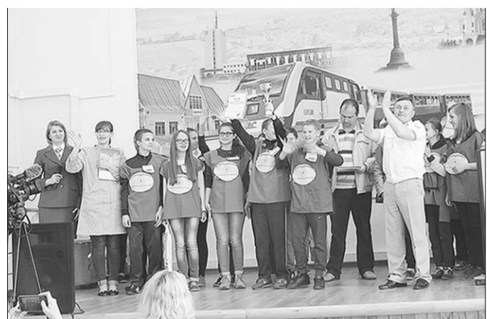
Участники квест-викторины «Безопасная железная дорога».

«Малая магистраль» в Лисках готовит школьников к безопасным каникулам.