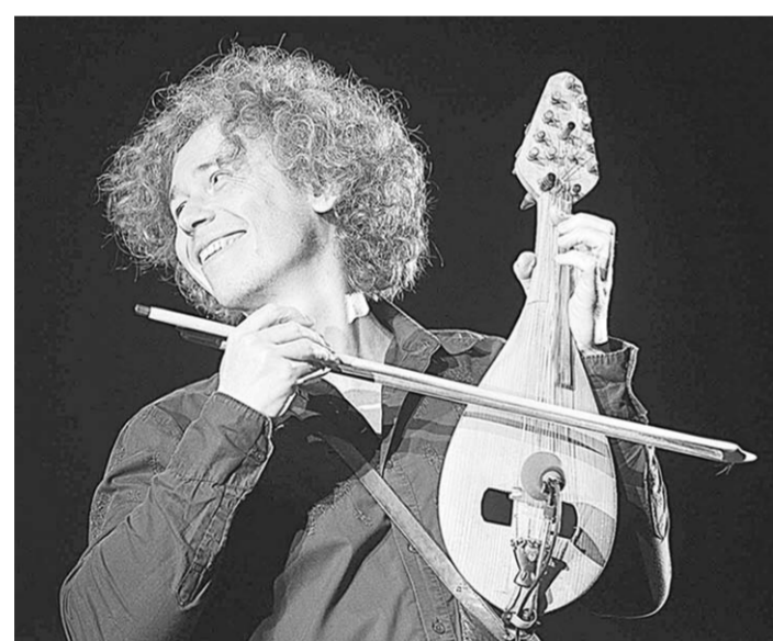
На сцене Зелёного театра звучала музыка народов мира.