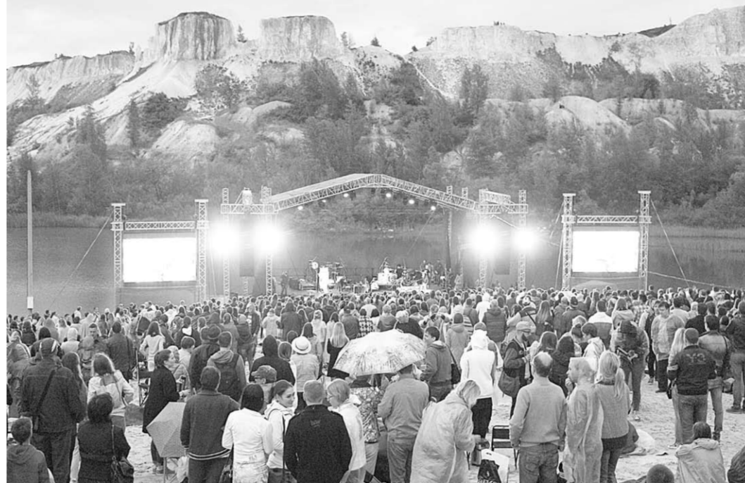
Несмотря на дождь, музыку слушали более трёх тысяч человек.

Литовская регги-команда Ministry of Echology накануне успела отыграть концерт на открытии книжной ярмарки и найти новых друзей в Воронеже. Публике в «Белом Колодце» даже начавшись после выхода на сцену этих музыкантов ливень никак не мешал слушать и веселиться. Где-то в середине своего выступления благодарные музыканты спели для своих свежесобранных поклонников народную песню «Ой, мороз, мороз». Дождь, кстати, участникам Ministry