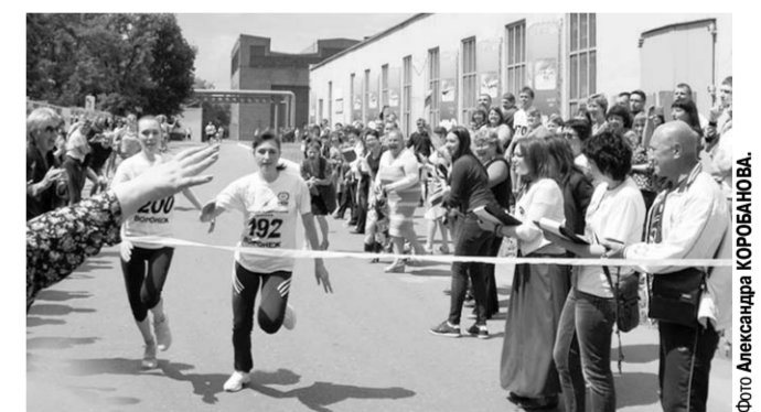
Забег объединил всех сотрудников завода.

На Воронежском авиационном заводе прошли соревнования по бегу «Миля ВАСО». Забег проводится второй год подряд, и в планах руководства завода сделать его ежегодным.