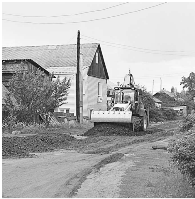
Ещё немного – и улица станет как новая.