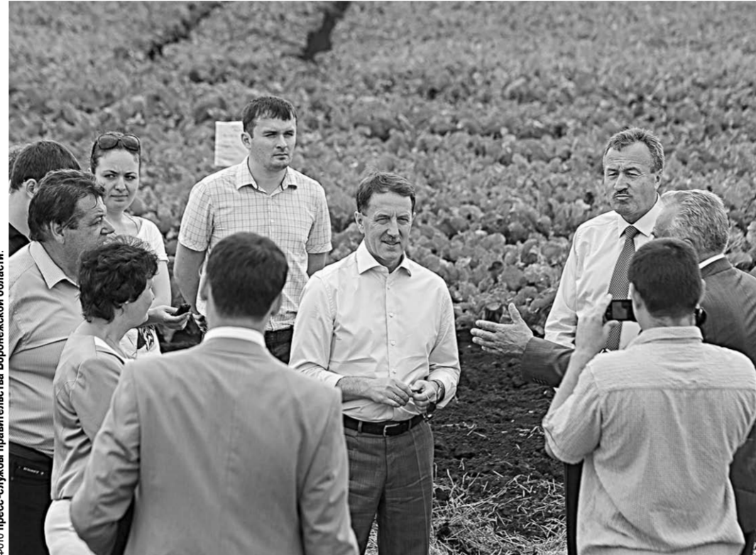
Губернатор осмотрел посевные площади Группы компаний «Агротех-Гарант».

Власть | Это подчеркнул в ходе рабочей поездки в Аннинский район губернатор Воронежской области Алексей Гордеев