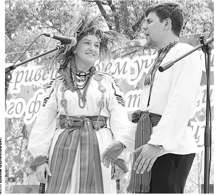
Старинная песня душу разбередит.