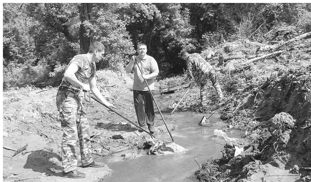
Вот так баграми приходилось вытаскивать из речки весь хлам.

«Поднимать» реку мужики решили не одним днём. На уличном баннере и в районной