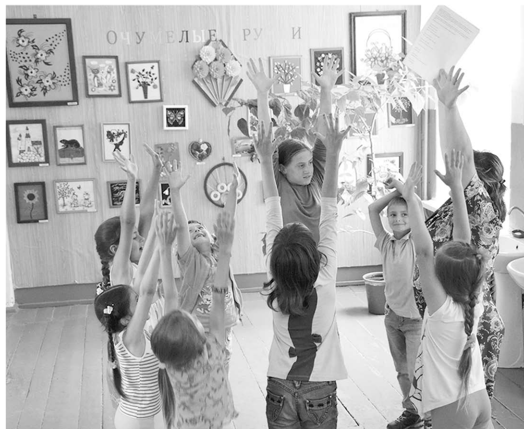
Физкультминутка в летнем школьном лагере.

ХОЗЯЙСТВО И СОЦИАЛЬНАЯ СТРУКТУРА. На территории поселения трудоспособного населения 570 человек, но на местных производствах трудятся 239 сельчан. Они работают в ООО АПК «Русич», ООО «Раздольное-Ангус», крестьянских фермерских хозяйствах, предприятиях торговли и общественного питания. В среднем школу Никольского посещают дети не только из села, но и хуторов. Заканчивают в ней девять классов. В детском саду более 30 малышей. Сельский Дом культуры получил недавно новые помещения. Есть библиотека, отделение банка и почта. Уровень газификации поселения охватывает более 80 процентов жилых домов. Водоснабжение осуществляется из трёх артезианских скважин, трёх башен Рожновского, проложено более десяти километров водопроводных сетей, к которым подключено 65 процентов жилых домов. Полностью выполнено освещение центральных улиц всех населённых пунктов. Трёхжды в день в Никольское заходит рейсовый автобус Лиски–Бобров.