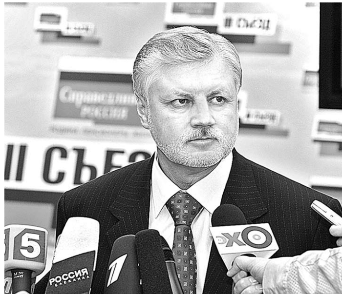
это перечень наиболее важных и популярных у граждан законодательных предложений эсэров.

С учетом народных требований формировалась и предвыборная программа «СР», утверждена на съезде. Она получила название «25 справедливых законов». По сути,